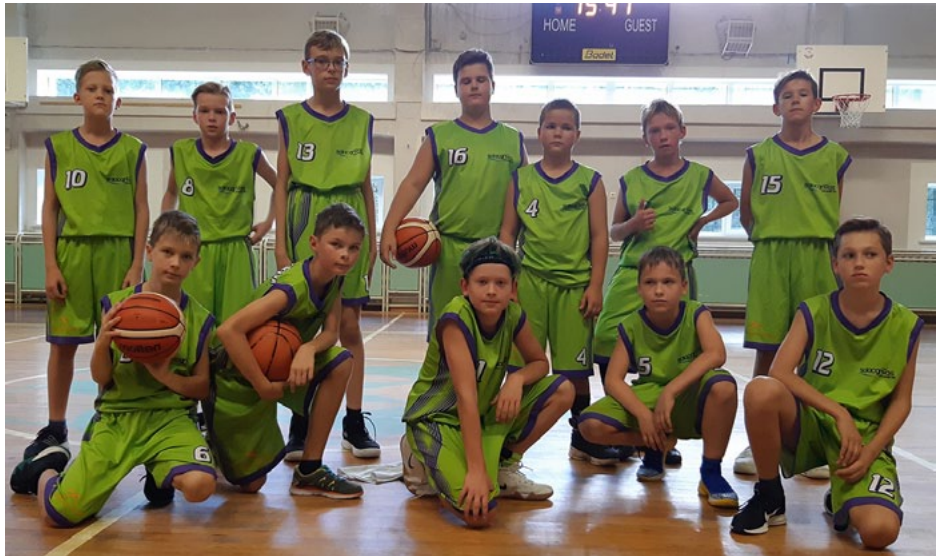
Salacgrīvas jaunie basketbolisti