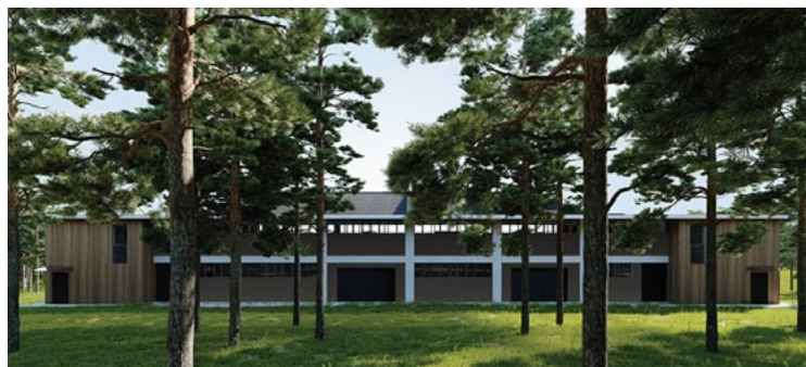
Rekonstruējamās Zvejnieku parka estrādes vizualizācijas

tējā teritorija pie sēdvietām un estrādes. Projektētāji atraduši veiksmīgu risinājumu, kā saglabāt tuvumā augošos kokus, pie tiem plānots ierīkot vietas ar krēsliem un galdīņiem, kas dažādotu skatītāju iespējas. Projekts paredz, ka estrāde būs no nerūsējošā tērauda plāksnēm, kas radīs