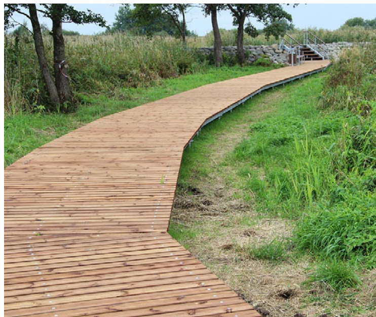
Tāda tagad izskatās laipa pie Ziemeļu mola Ainažos