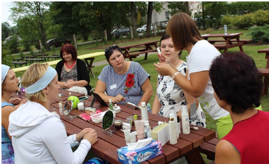
Dāmas iepazīst Oriflame produktus

salūts. Dziedājām, priecājāmies, dejojām un bijām lustīgas un lustīgi (pievienojās arī ciema puiši) līdz pat gaismaiņai.