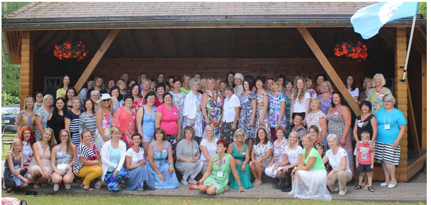
Nometnes dalībnieču kopbilde

Izskanot koncertam, dāmas devās pucēties Vislatvijas zaļumballei. Nakts kulminācijā nometnes dalībniecēm tika dāvāts