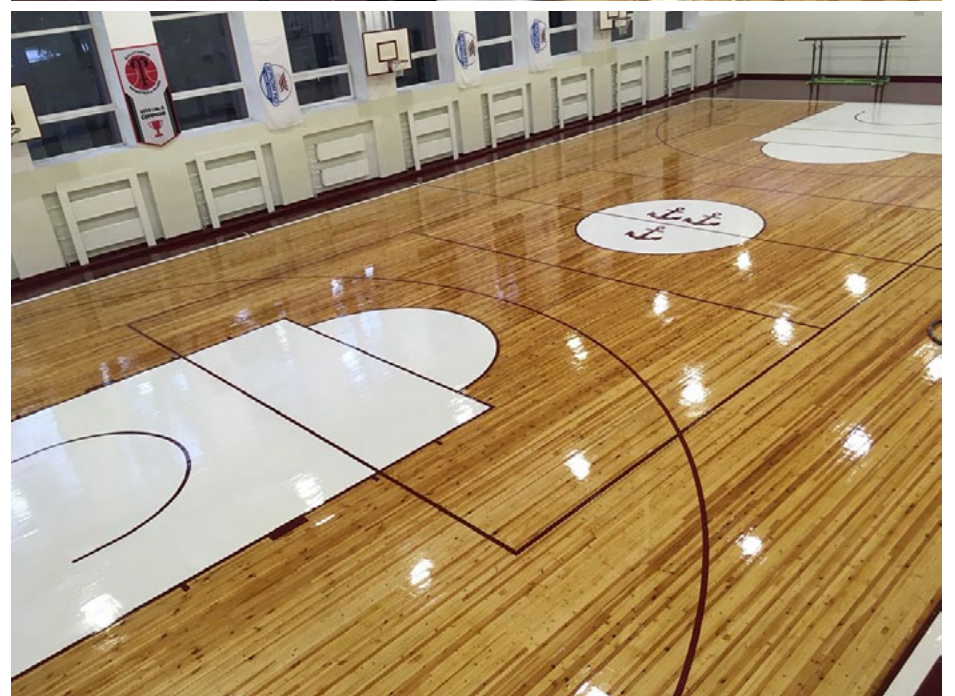
Pēc kārtīga vecāku darba Salacgrīvas vidusskolas sporta zāles grīda tagad izskatās šāda