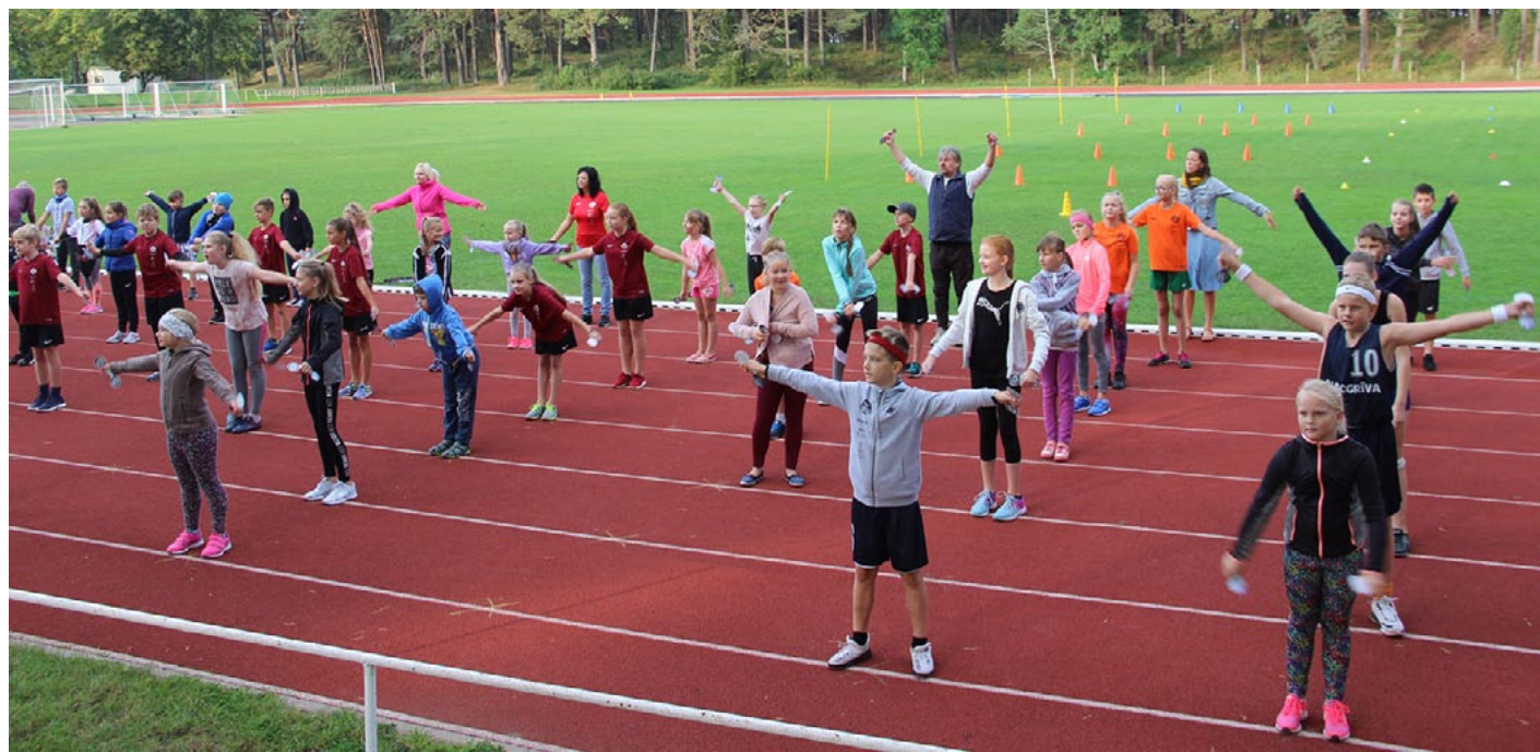
Olimpiskās dienas dalībnieki, starp viņiem arī novada domes priekšsēdētājs, iesildās sportošanai

Radošā apvienība Teātris un ES piedāvā jautru komēdiju bērniem un vecākiem