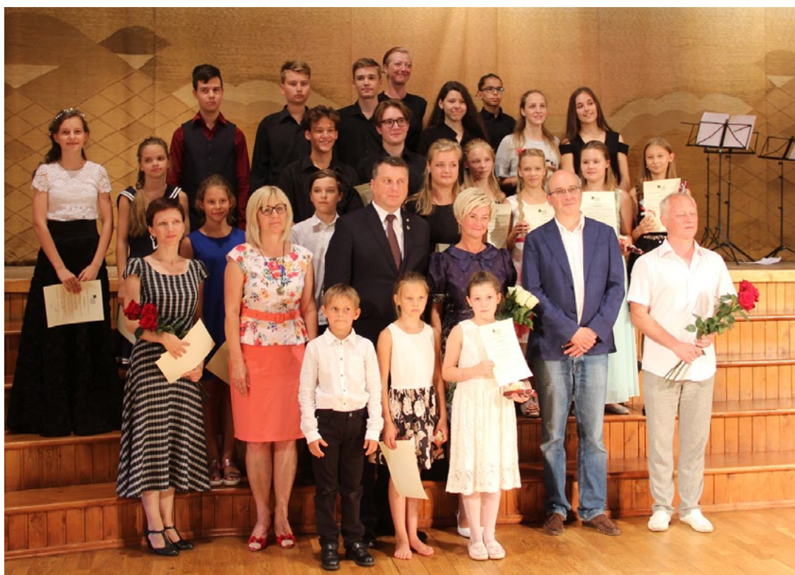
Meistarklašu audzēkņi un pedagogi kopā ar Latvijas Valsts prezidentu Raimonda Vējoni un meistarklašu patronesi Ivetu Vējoni

Šogad klasiskās mūzikas festivāla galā koncerts pirmo reizi