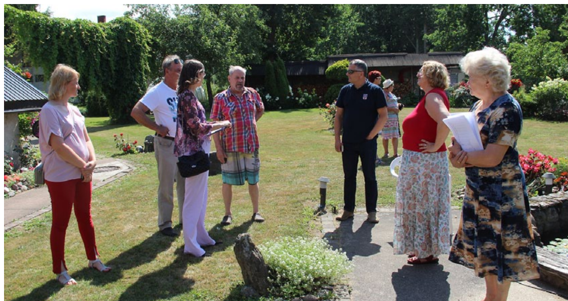
Tereškoviču ģimenes īpašums priecēja ar krāšņi ziedošām puķu domēm un pārdomāto dārza plānojumu