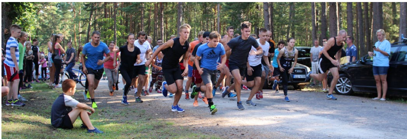
Startē Ziemeļlivonijas Stipro skrējiena pieaugušo grupa

Guna pastāstīja, ka piektdienas vakarā Ainažos noticis jau tradicionālais futbola mačs – Ainažu seniori pret junioriem. Šajā divpadsmitajā mačā uzvarēja seniori ar 10:4. Spēlē bija rekordskaits dalībnieku – katrā komandā 13! Izpēlēties dabūja visi.