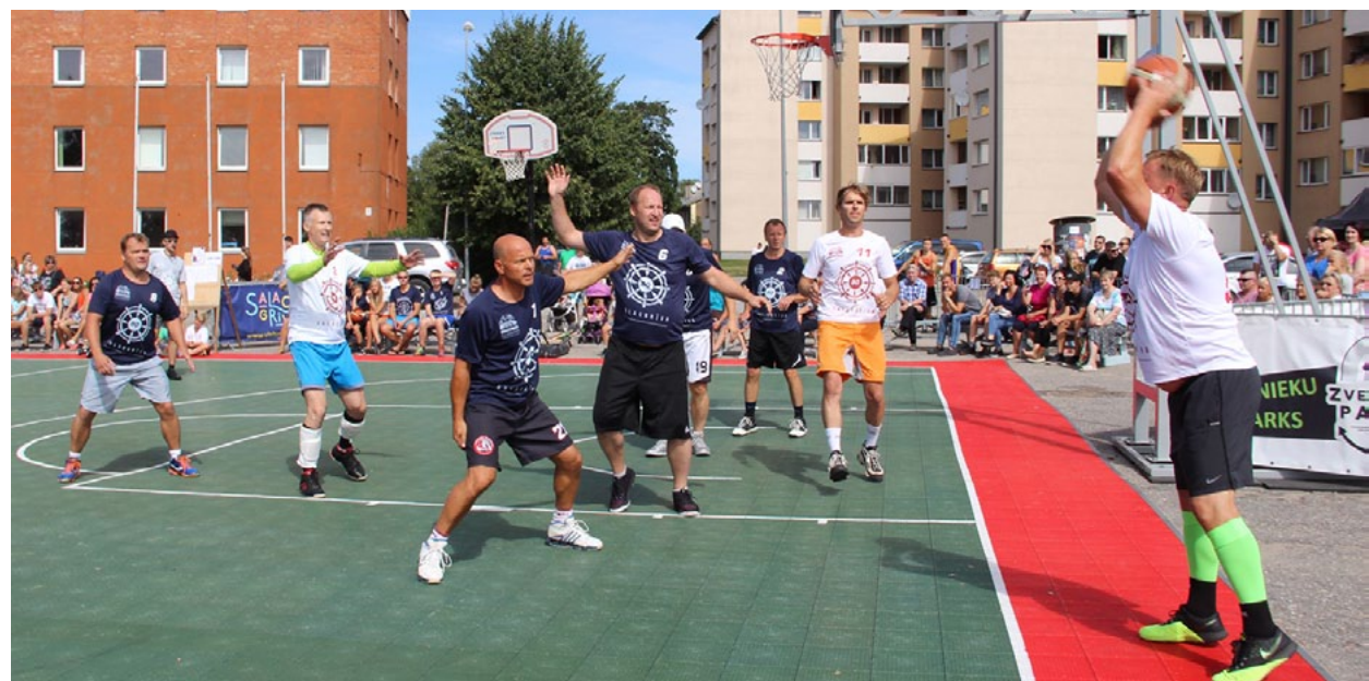
Vecmeistaru spēle ar 15:13 uzvarēja kreisais krasts