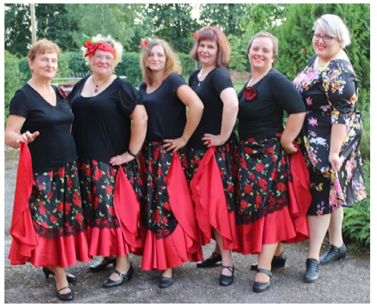
Korģenes kantriklubiņš K3 pirms sava priekšnesuma

Biedrības Mēs Korģenei biedri ir gandarīti par apmek-