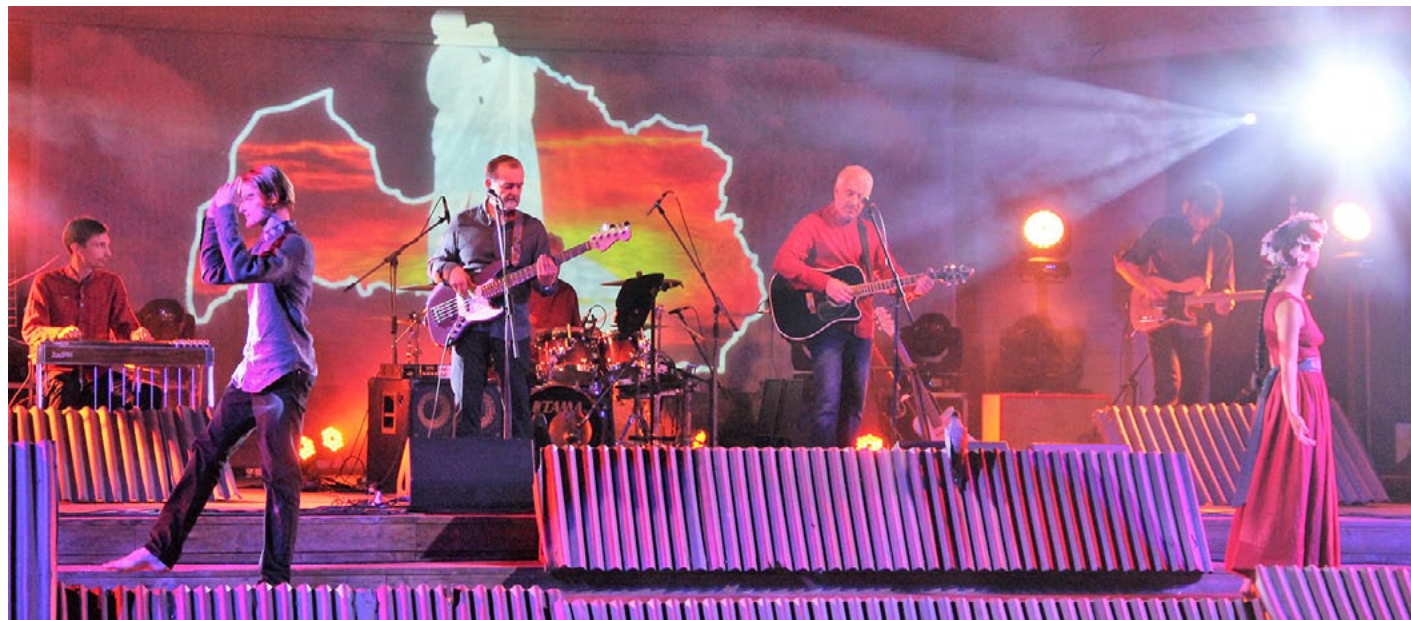
Sestās jūdzes koncertuzvedums Man citas zemes nevajag bija ļoti emocionāls, kustībām, skaņām un gaismām bagāts

Paldies par jaukajiem svētkiem un krāšņo salūtu!