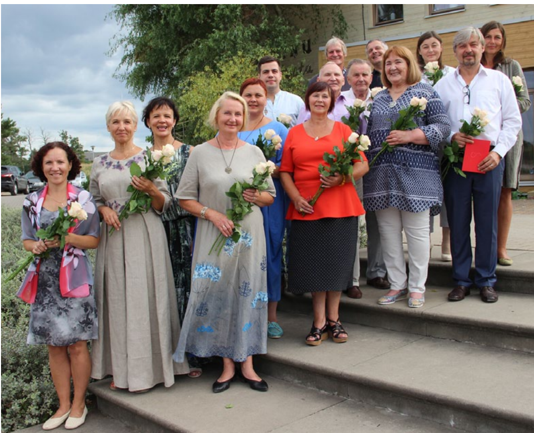
Kolektīvu vadītāju kopbilde

Vienmēr svētkos ir divas puses – viena, kas var, prot un grib darīt, un otra, kas ļauj to darīt. Šajā gadījumā tā noteikti ir Salacgrīvas novada dome un priekšsēdētājs