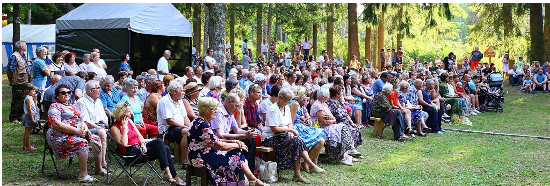
Liepupiešu izstudējumam Limuzīns Jāņu nakts krāsā skatītāju netrūka