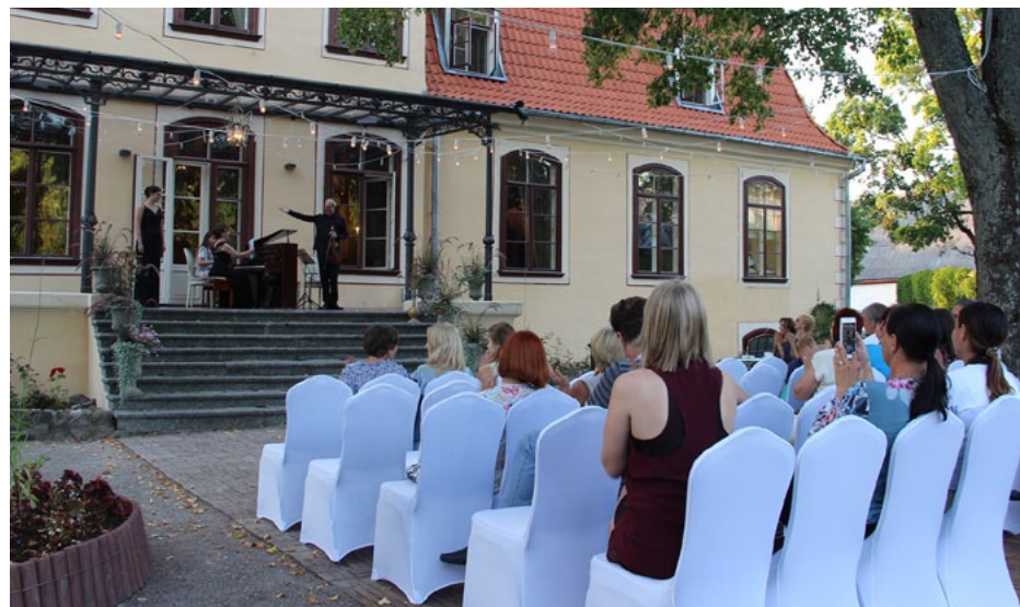
Mūzikas svētki Liepupes muižā bija īpaši, ar savu noskaņu