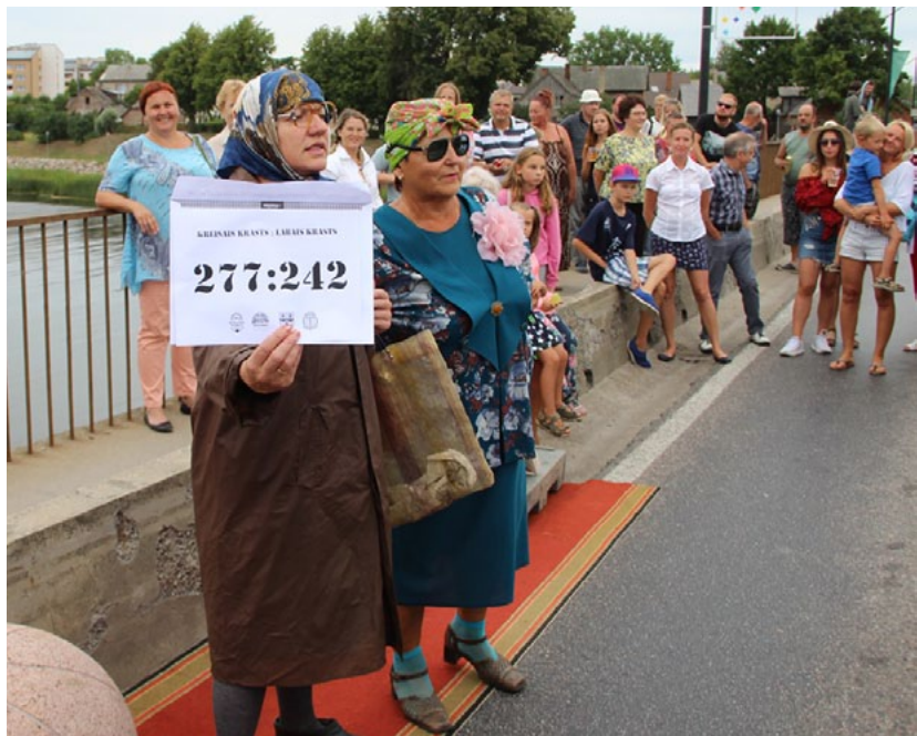
Bumbas velšanas brīdis uz uzvarētāju krastu ir klāt – Alms paziņo rezultātu...