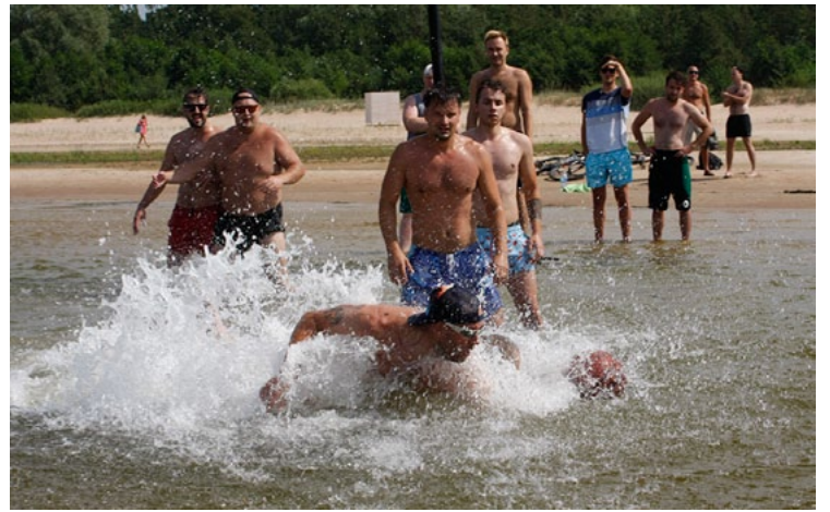
Strītbols ūdenī ir ne tikai atvērinoša, bet arī ļoti grūta spēle

28. jūlijā skaistajā Salacgrīvas kreisā krasta pludmalē notika jau ceturtais pludmales strītbola čempionāts. Šis ir viens no neparastākajiem strītbola turnīriem Latvijā, jo sportisti spēles aizvada ūdenī.