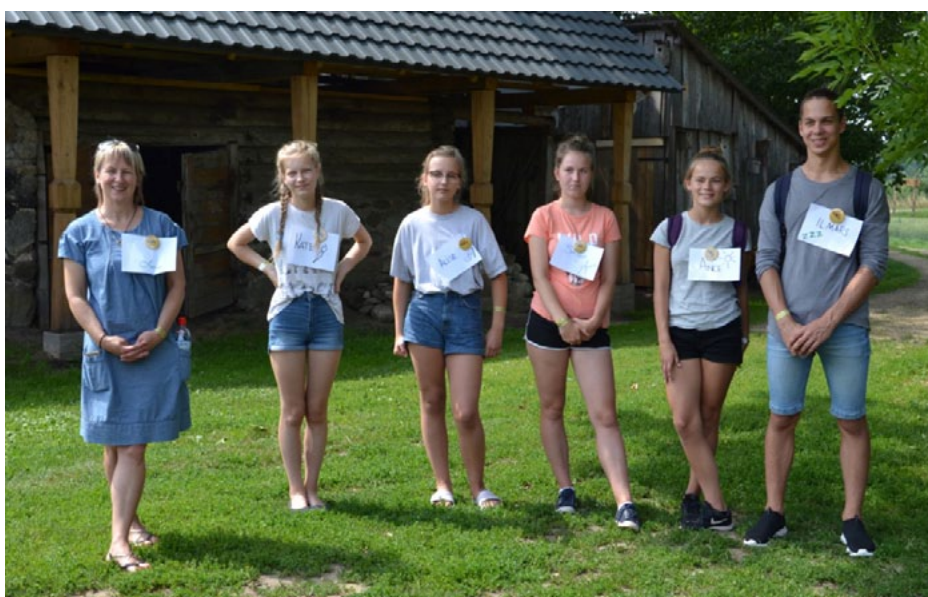
Salacgrīvas jaunieši Viļānos

Intensīvā mācīšanās procesa starplaikos jaunieši saliedējās kopīgā dancī, dziesmā un paguva atveldzēties arī Radopoles ezerā. Vienā no kopvakariem, spēlējot spēli Mafija , jauniešiem radās doma izveidot