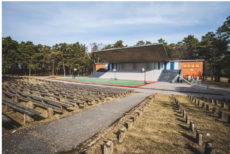
Estrāde gaida savu atjaunošanu

piekrastē. Projektā paredzēts pārbūvēt un modernizēt pašu estrādi, kā arī labiekārtot tās apkārtni un uzlabot vides pieejamību.