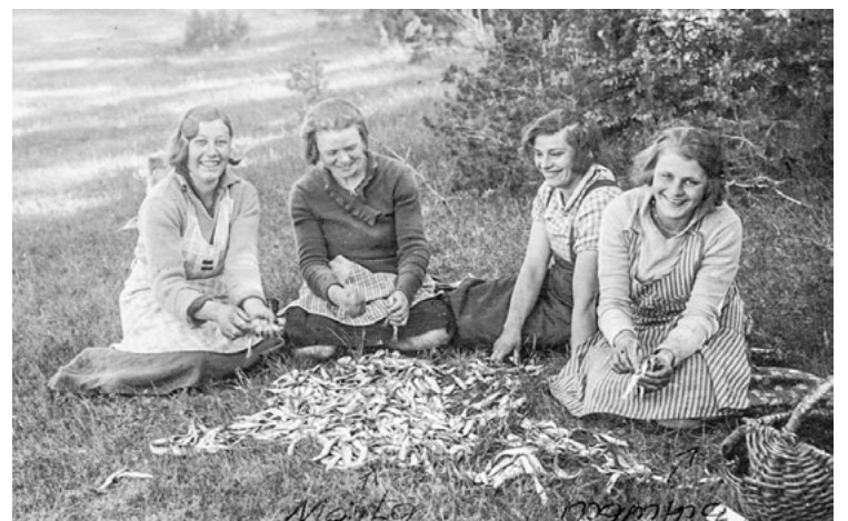
Kaut kas tiek sievietēm izķidāt... 1930. gadi