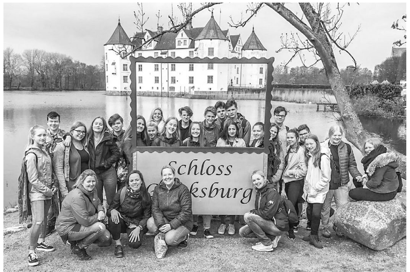
Salacgrīvieši kopā ar draugiem no Handevitas pašvaldības pie Gliksburgas pils