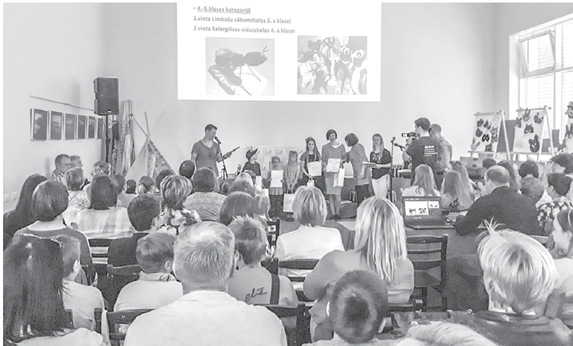
ZAAO vides projekta Cilvēks vidē noslēguma pasākums Daibē

ZAAO vides izglītības aktivitātes ir vērstas uz sabiedrības izglītošanu, informēšanu un līdzdalību vides kvalitātes uzlabošanā savā dzīvesvietā. ZAAO vides projekts Cilvēks vidē skolām un bērnudārzniekiem darbojas kopš 2001. gada. Tajā ietvertas gan radošās, gan praktiskās aktivitātes, tāpat zināšanu apguve par atkritumu lietderīgu apsaimniekošanu un ietekmi uz vidi. Skolas un bērnudārznieki projekta laikā var izvēlēties sev saistošos konkursus. Darbošanās vides projektā veicina bērnu un jauniešu izglītošanu un informēšanu, kā arī mudina līdzdarboties vides kvalitātes uzlabošanā pilsētās un laukos.