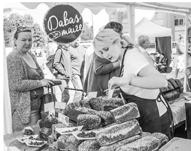
Dabas maizes stendā – reņģu maize