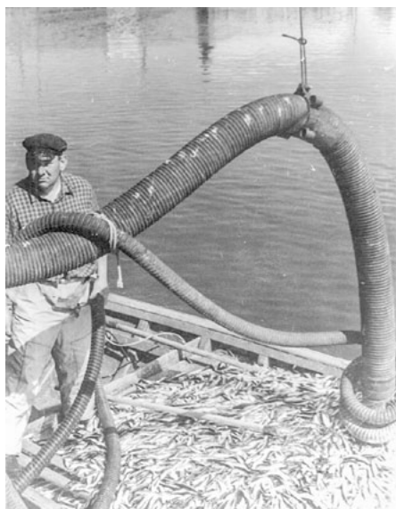
Reņģu sūknis jau gatavs darbam. 1960., 70. gadi