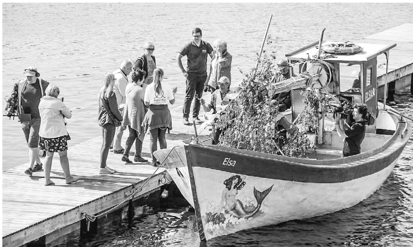
Festivālā liela piekrišana reņģu zvejniekiem bija gan no televīzijas, gan iedzīvotāju puses

Pēc koncerta dalībniekiem un viņu ģimenēm bija laiks rosīties radošajās darbnīcās Rakuru murdiņā , baudīt piepūšamo atrakciju priekus un gaidīt, kad krastā piestās Salacas plosts. Lielajā svētku jūklī daudzi droši vien bija piemirsuši, ka šajā dienā savu darbu beidza Salacas plostnieki, kuri trīs dienas cītīgi bija strādājuši un