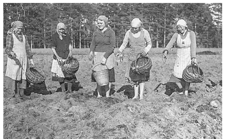
Ja vēl paliek pāri, tad var arī iestādīt. 1930. gadi