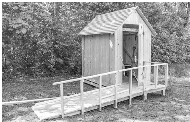
Universālā dizaina objekts – ekotualetes – Ainažos

20. maijā Ainažos, stāvlaukumā pie Igaunijas robežas, turpinot Latvijas Zaļās kustības aizsākto kampaņu Saglabāsim Latvijas kāpas , šīs kustības aktīvisti uzstādīja ekotualetes invalīdiem.