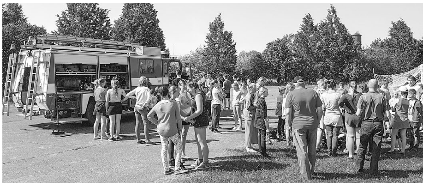
Liepupes skolēnu interese par ugunsdzēsēju darbu bija ļoti liela

šā situācija ugunsdzēsībā. Latvijā tā ir vislietākā Eiropā. Daudzās Eiropas valstīs valsts dienestam blakus allaž strādā brīvprātīgie ugunsdzēsēji. Latvijā daudzas BUB un vienības nolikvidētas. Labi, ka Ainažos ar pašvaldības atbalstu tā joprojām strādā. Pēc BUB likvidēšanas izveidoja centralizēto Valsts ugunsdzēsības un glābšanas