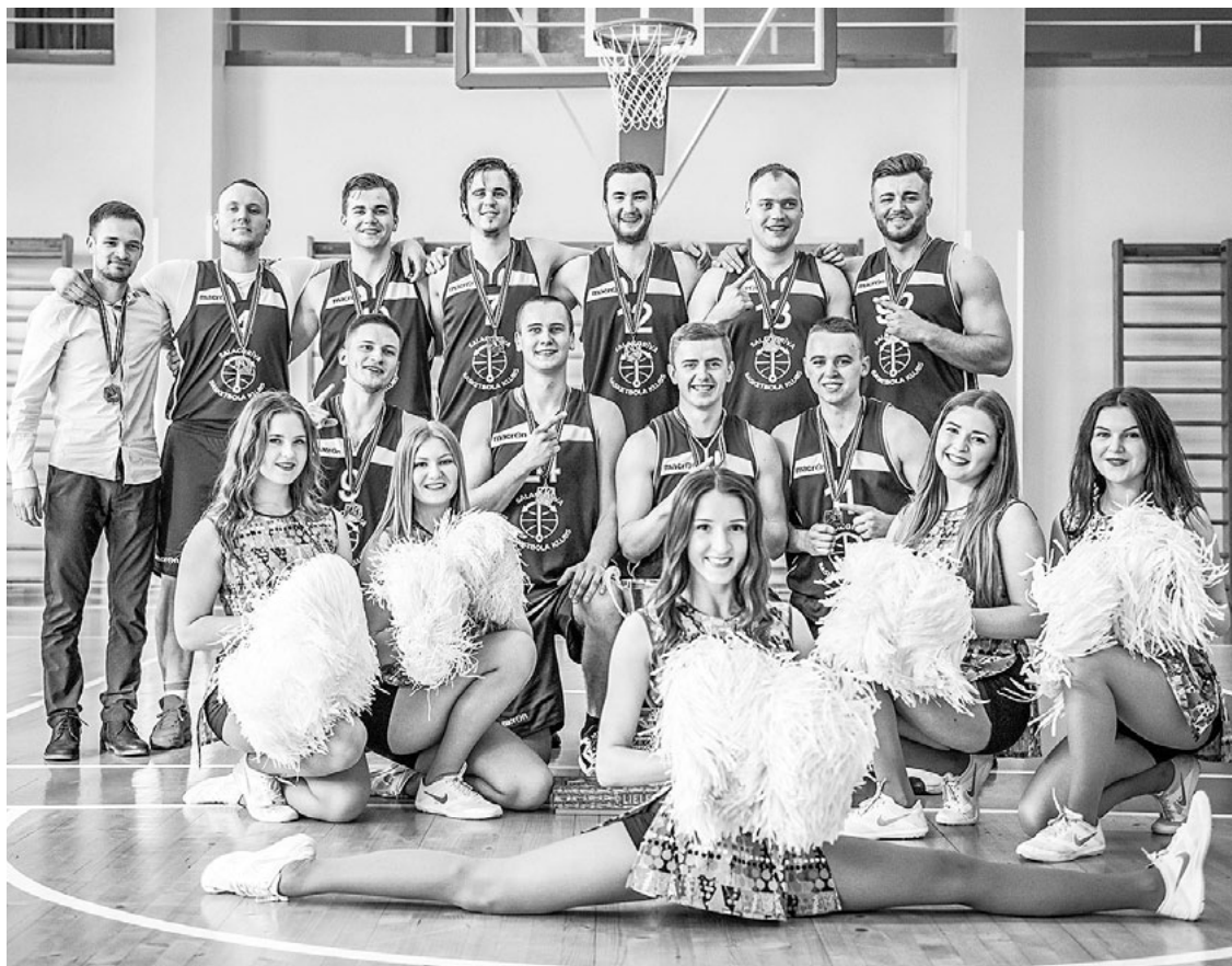
28. aprīlī Limbažos ar BK Salacgrīva uzvaru finālā pār Spartaku noslēdzās Olimpiskā centra Limbaži basketbola čempionāts