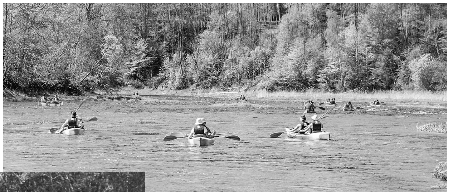
Saulainā un siltā maija diena kā radīta laivošanai