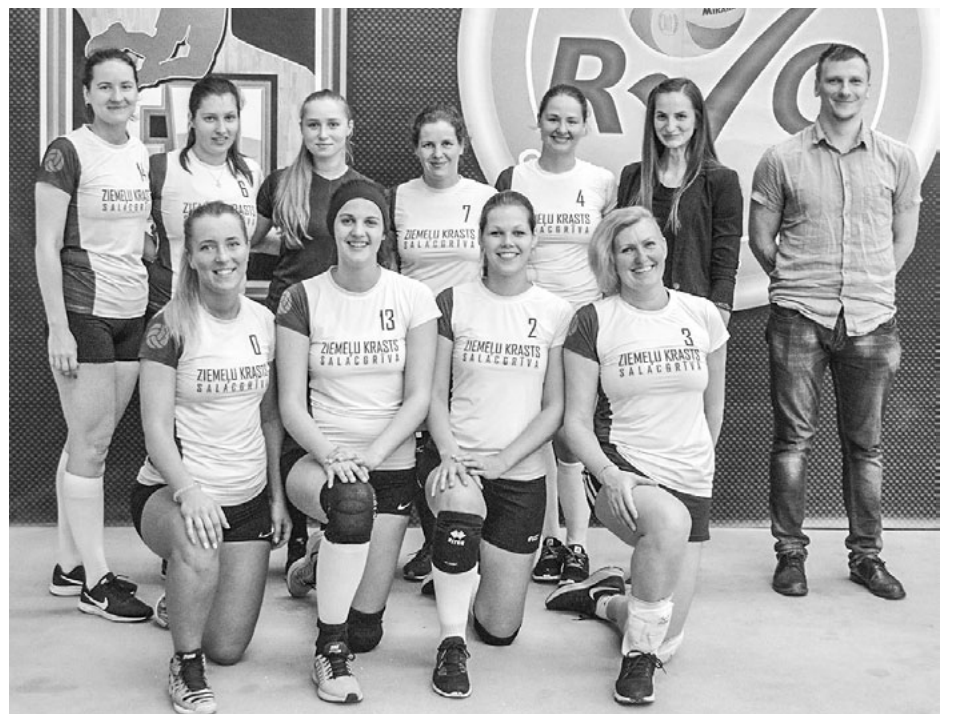
Volejbola kluba Ziemeļu krasts – Salacgrīva sievietes komanda