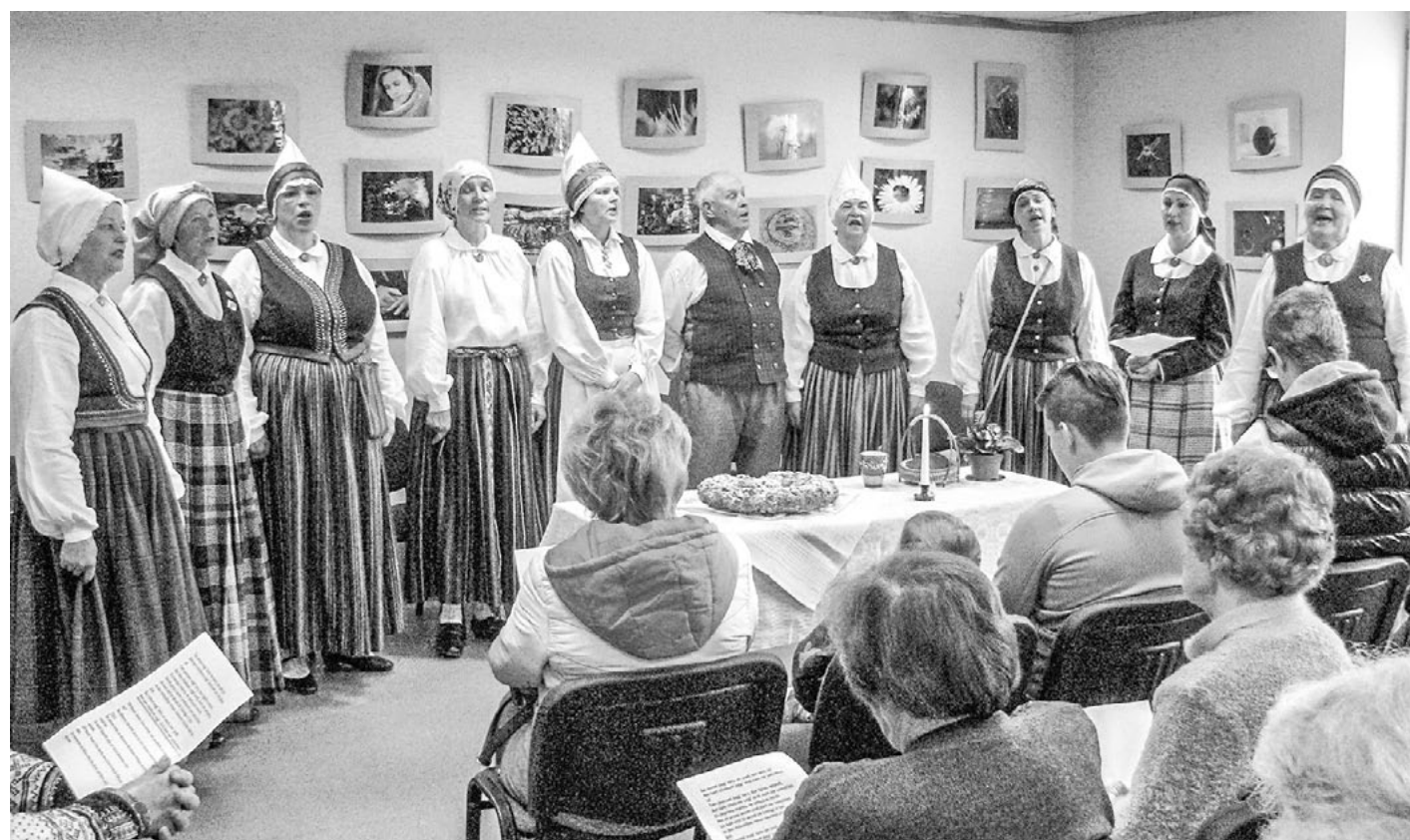
Tūjā Baltā galdauta svētki šogad kopā ar folkloras kopu Cielava

Svētku koncerta izskaņā katram no dalībniekiem Tūjas bibliotēkas vadītāja