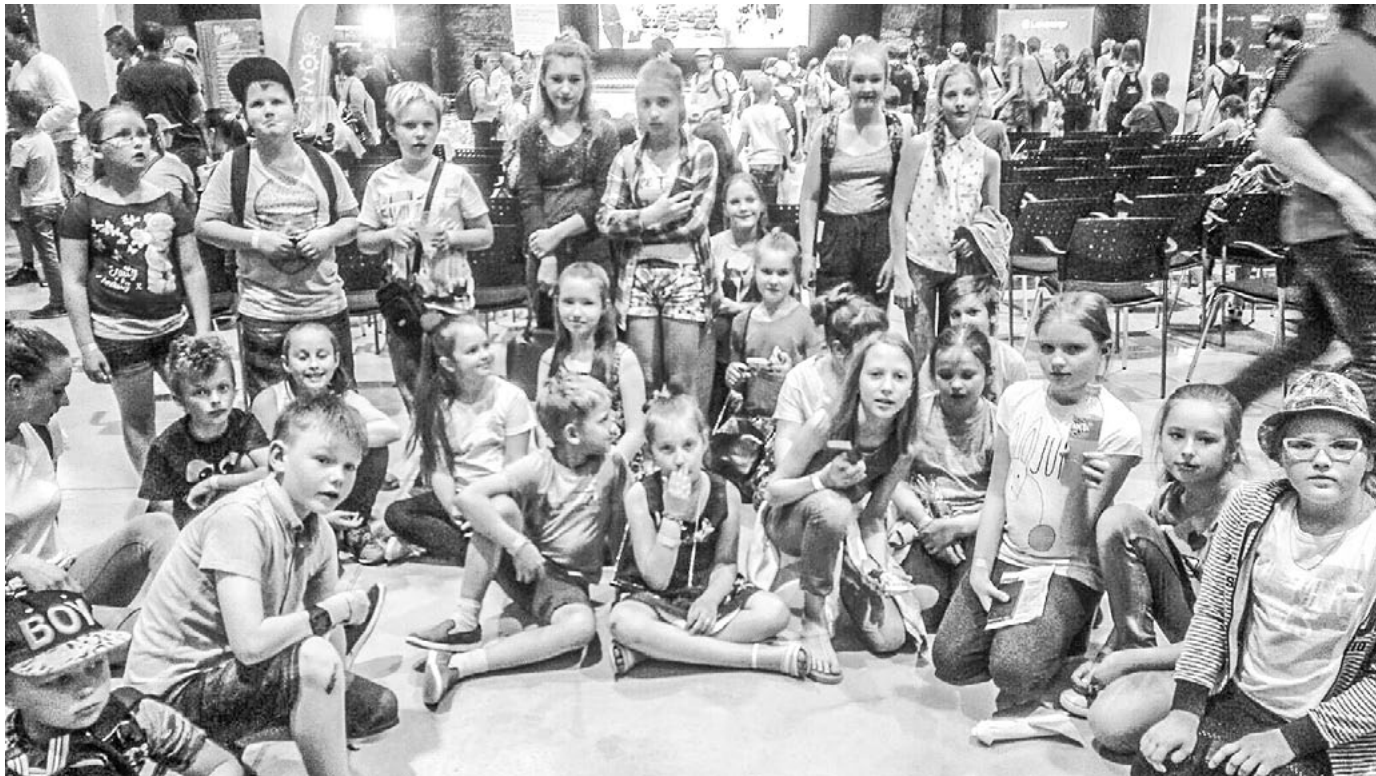
Salacgrīvieši fizikas festivālā Rīgā FIZMIX Eksperiments RISEBA Arhitektūras un mediju centrā H2O

Šogad tajā iesaistījās 84 dalībnieki, no kuriem 17 skolēnu 1.–2.kl. grupā, 34 – 3.–4. klašu grupā, 17 – 5.–8.kl. grupā, četri no 9.–12. klasēm un 12 vecāku un skolotāju. Maratonā līdz finišam nokļuva tikai 56 dalībnieki.