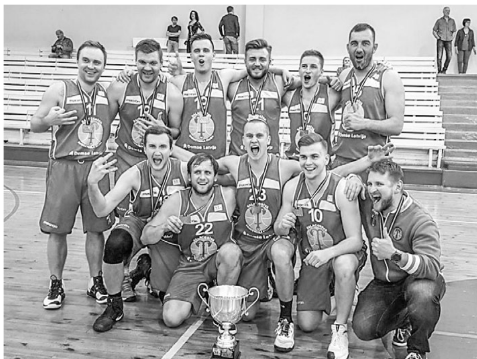
Basketbola kluba Salacgrīva komandai ļoti garā sezona noslēgusies uz pozitīvas nots