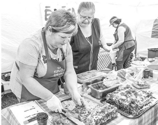
SIA Kuivīžu enkurs ēdnīcā reņģu torte guva ēdāju un skatītāju simpātijas