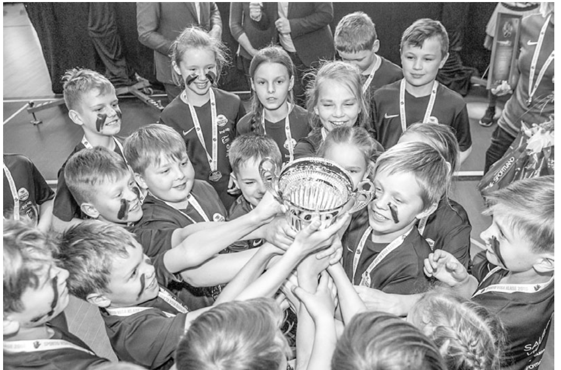
Salacgrīvas vidusskola var lepoties, jo 3.a klase ieguva 3. vietu trešklasnieku grupā SVK finālā