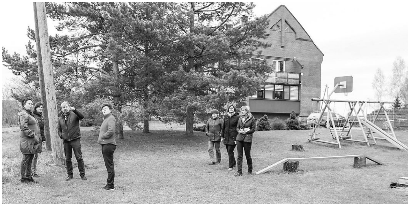
Iepazīstoties ar Liepupes pagasta iedzīvotāju grupas projektu Sēj un stādi

Vispirms komisija iepazīna sešus no Salacgrīvas. Ēkas Vidzemes ielā 4 apsaimniekotāji uzrakstījuši projektu Savam namam – savai pilsētai , Salacgrīvas Svētās Dievmātes patvēruma pareizticīgo draudze – Salacgrīvas pareizticīgo baznīcas kāpņu remonts , biedrība WeRock – pilsētvides objektu Kaleidoskops . Ir arī iecere veidot Saulrieta laipu, Mīlestības paviljonu Salacgrīvas pilskalnā. Savukārt Septītās dienas adventistu Salacas draudzes projekts ir Pamatnes sagatavošana bruģa ieklāšanai Zvaigžņu ielā 13 . Tad vērtētāji devās uz Ainažiem, lai skatītu aktīvo Krišjāņa Barona ielas 10. mājas iedzīvotāju projekta Mums sakārtots un sakopts pagals īstenošanas vietu, uz Korģeni, lai iepazītos ar Sprīdīšu atbalsītāju iecerēto projektu par atpūtas vietu-nojumi pie veco ļaužu mītnes Sprīdīši , un biedrības Mēs Korģenei iesniegto projektu par Korģenes sabiedriskā centra Zītaru ielā 3 piegulošās teritorijas labiekārtošanu. Liepupes pusē komisija apskatīja trīs projektu īstenošanas vietas un tikās ar to realizētājiem. Liepupes pagasta iedzīvotāju grupas iesniegušas projektus Veselības fabrika un Sēj un stādi , Melbārzu ciema iedzīvotāju