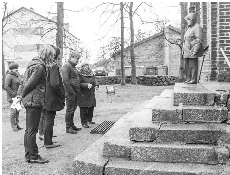
Komisija vērtē Salacgrīvas Svētās Dievmātes patvēruma pareizticīgo draudzes projektu Salacgrīvas pareizticīgo baznīcas kāpņu remonts