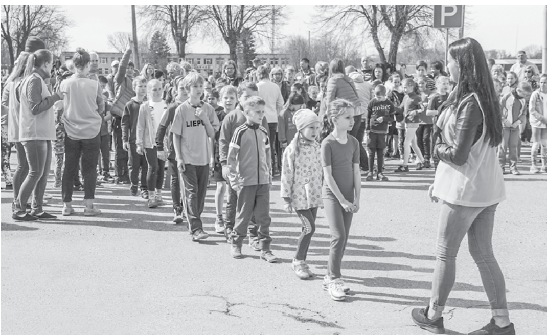
Uz skrējiena stafetes posmiem dodas mazie skrējēji