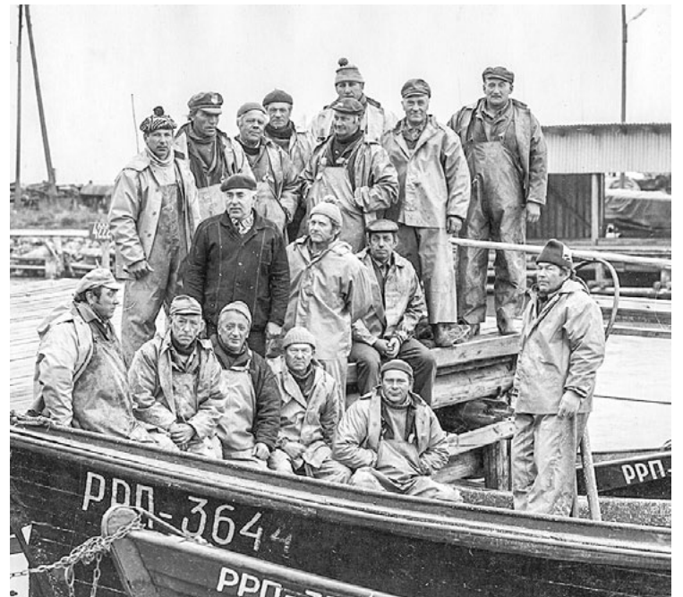
Gatavi doties zvejā. Kolhoza Brīvais vilnis zvejnieki švītās Kuivižu zvejas ostā. 1980. gadi