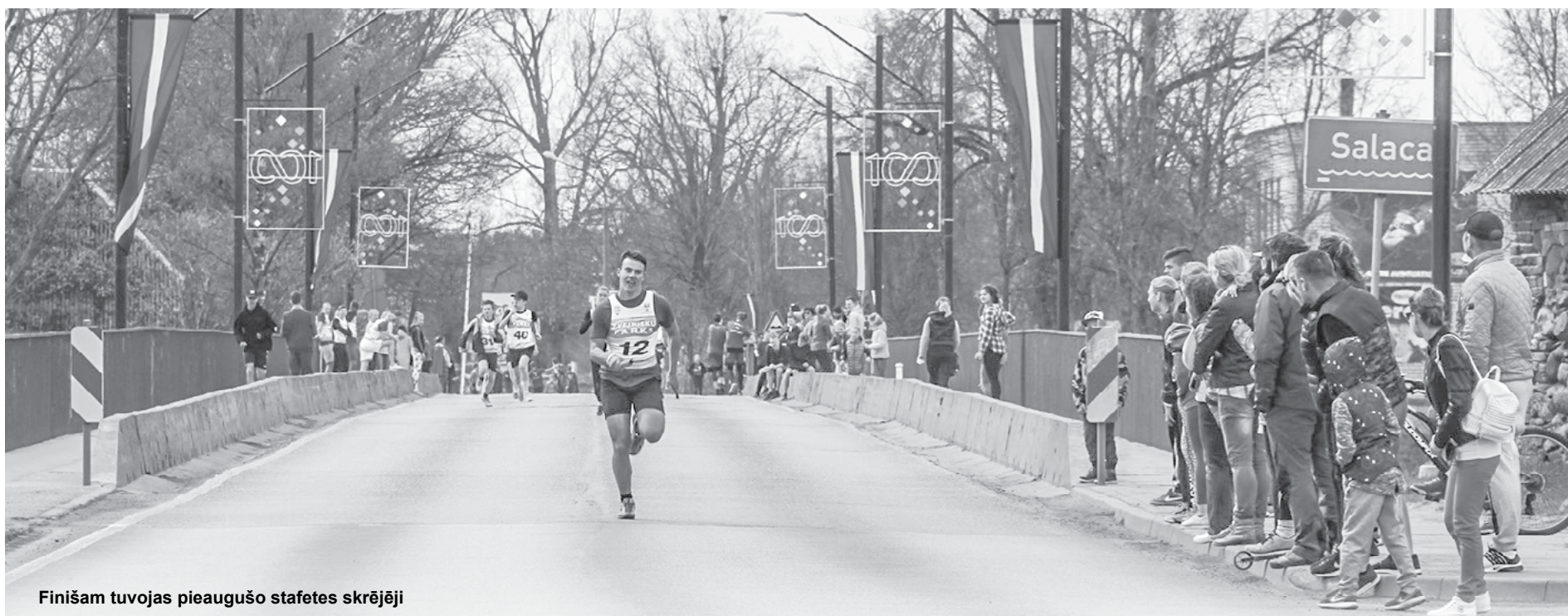
Finišam tuvojas pieaugušo stafetes skrējēji