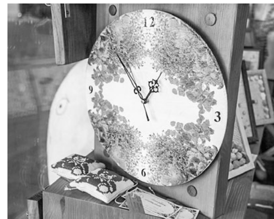
Salacgrīvas vidusskolēnu darbus iespējams apskatīties un iegādāties veikalā-izstāzū zālē Radīts Salacgrīvas novadā