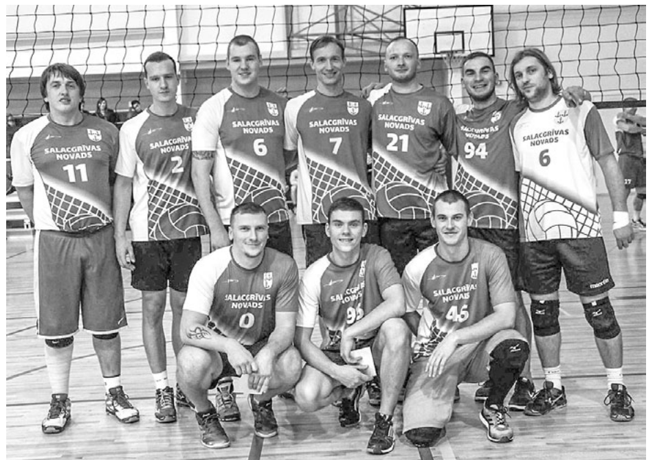
Volejbola kluba Ziemeļu krasts – Salacgrīva vīriešu komanda