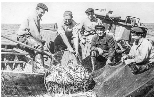
1950., 60. gadi