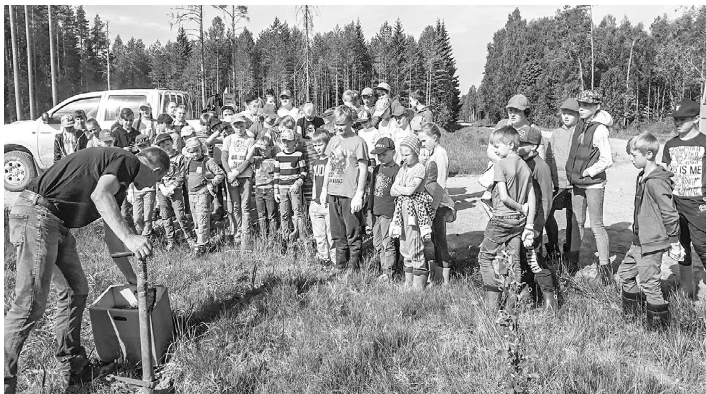
Salacgrīvas vidusskolas audzēkņi Meža meistardienā

Mammadaba meistarklases dalībniekiem mācību gada laikā jāpaveic trīs meistardarbi: 1) āra meistarstunda;