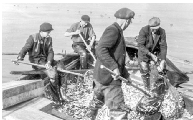
Kopīgiem spēkiem. 1950. gadi