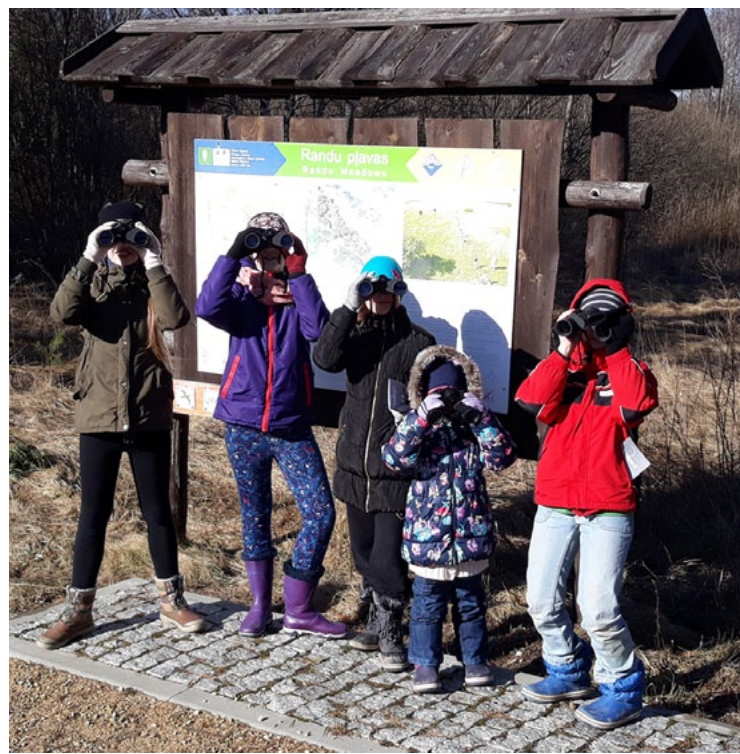
Ar tālskati labāk ieraudzīt putnus... Un ne tikai tos!