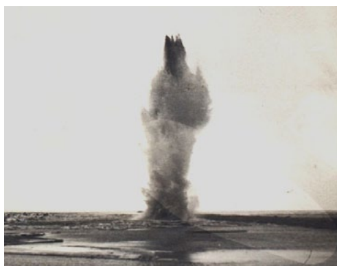
Nekas cits neatliek – jāspridzina, lai atbrīvotu ledu ceļu