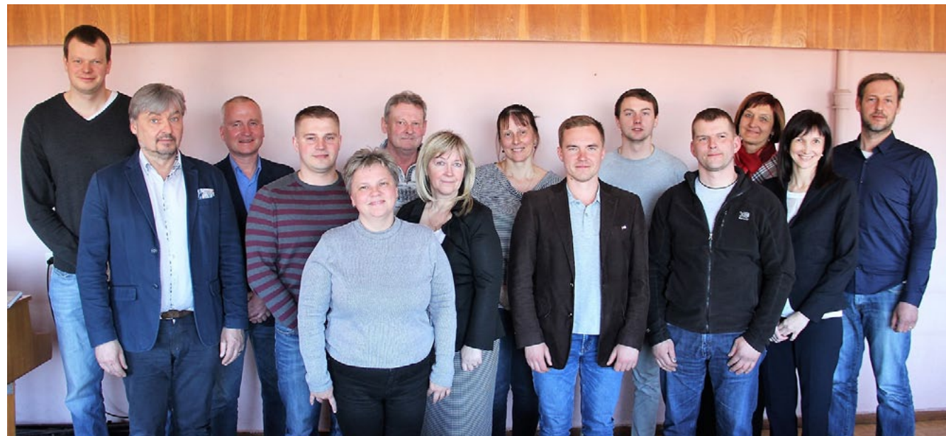
Jaunievlētā biedrības Jūrkante padome

13. aprīlī Salacgrīvas kultūras namā notika biedrības Jūrkante atkārtotā pilnsapulce, uz kuru no Ainažu un Salacgrīvas pilsētas, Ainažu, Salacgrīvas, Liepupes, Pāles, Viļķenes un Skultes pagasta 93 biedriem bija ieradušies 67.