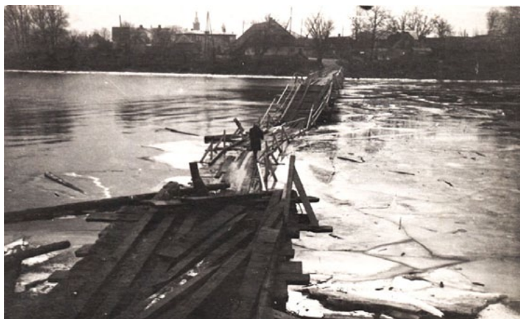
1950. gadu fotogrāfija rāda, kā ledus salauzis koka kājnieku tiltu pār Salacu, bet drosmīgie salacgrīvieši turpina šķērsot upi

Beidzot pavasaris, Salaca brīva no ledus un ūdeņi brīvi plūst uz jūru! Bet tā tas ir šogad. Mūsu muzeja fotokolekcijā ir liecības, kas rāda pavisam citu ainu, ko daudzi salacgrīvieši arī atceras.