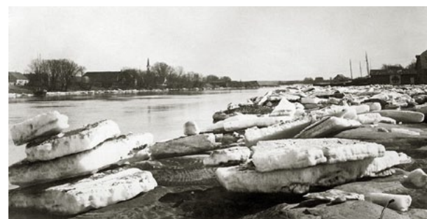
Arī 1920. gados Salacu klājis biezs ledu, krastā vēl palikuši krāvumi