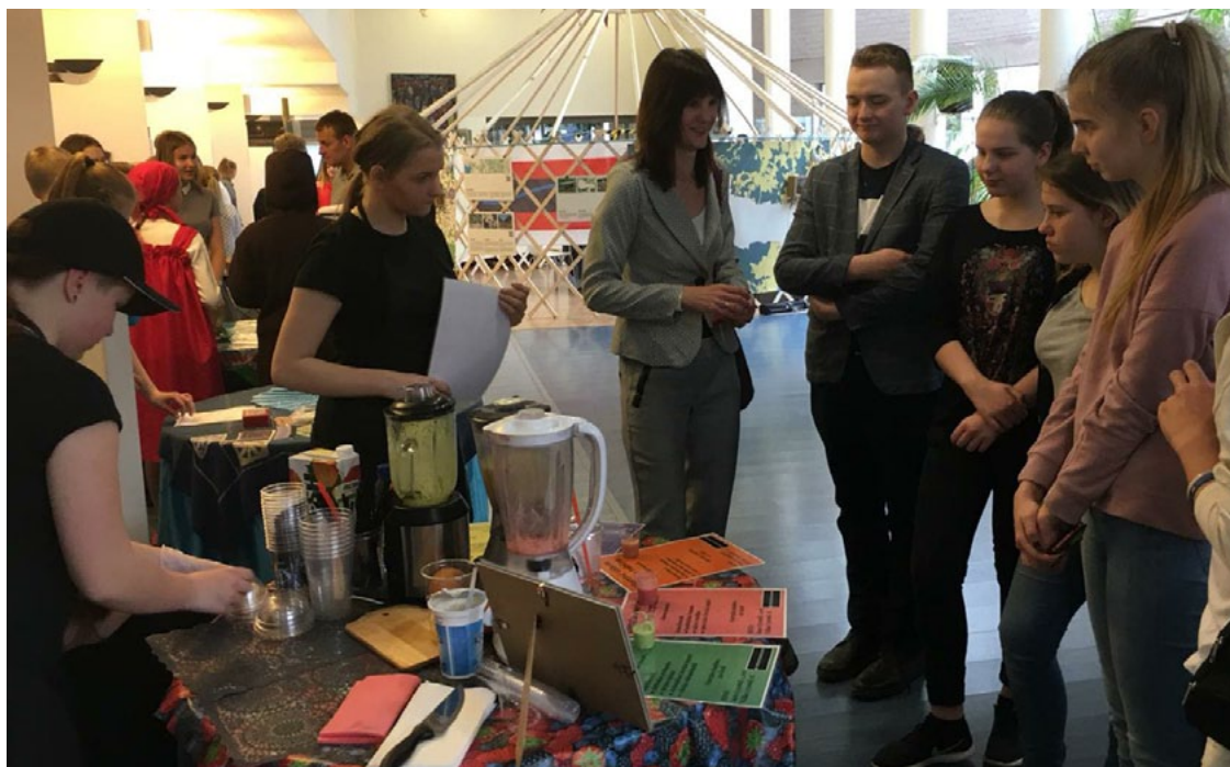
Salacgrīvas skolēni Valgā

16. aprīlī Salacgrīvas vidusskolas skolēnu mācību uzņēmumu (SMU) dalībnieki devās pieredzes apmaiņas braucienā uz Igaunijas pilsētu Valgas kultūras un interešu centru, kur notika Igaunijas SMU gadatirgus, kā arī šo uzņēmumu gada atskaites prezentācijas. Šo braucienā SMU dalībniekiem nodrošināja projekta Igaunijas–Latvijas uzņēmēju pārrobežu sadarbības platforma ( Interreg ), kurā partneris ir Salacgrīvas novada dome.