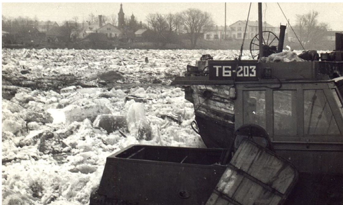
Osta un kuģi ledu gūstā