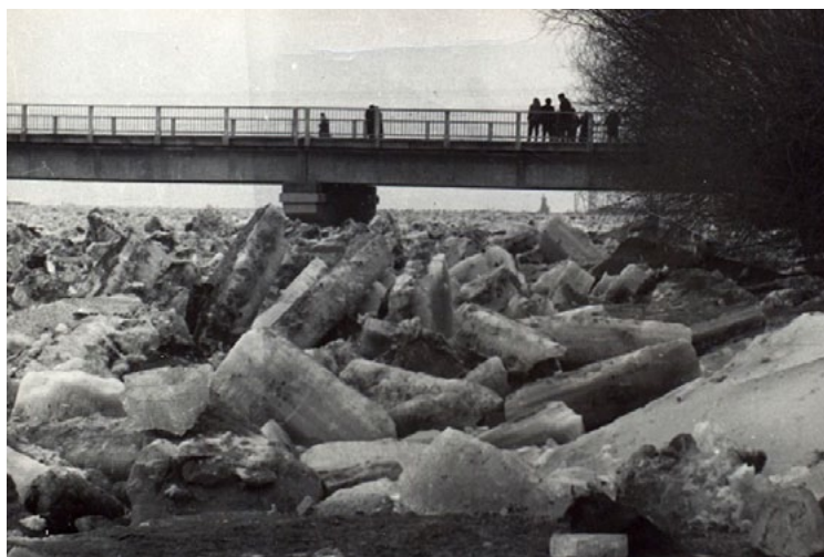
Ledus kāpj ārā no krastiem un gandrīz jau sasniedzis tilta augšū