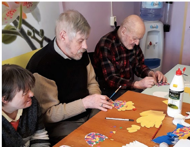
Liieldienu svinēšanai gatavojas seniori Sprīdīšos

Folkloras kopas Cielava meitenes arī bija nokrāsojušas oliņas. Dāvanā iemītniekiem viņas atveda arī kliņģeri un, protams, skaistu skaistās dziesmas. Tika dziedātas spēka dziesmas, tautasdziesmas un tās, ko pansijas iemītnie-