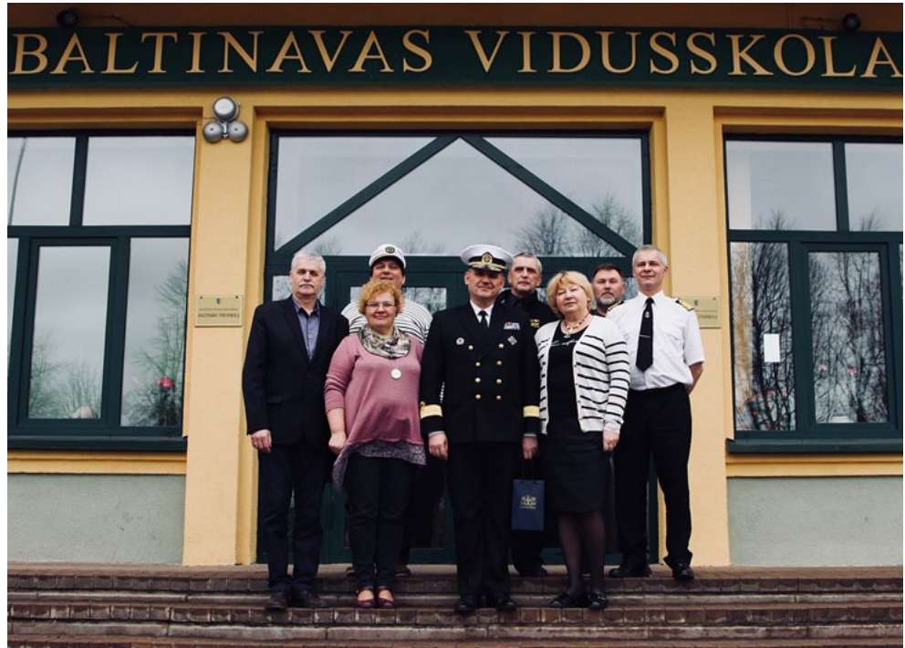
Bibliokuģa komanda Baltinavas vidusskolā