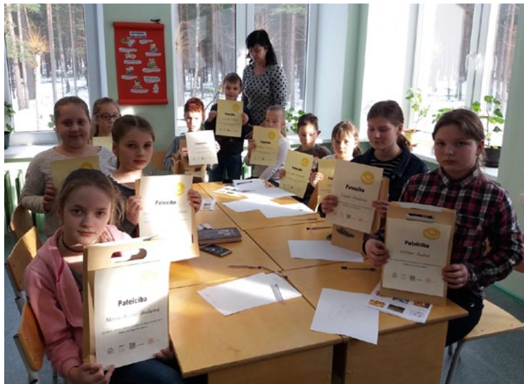
Bērnu žūrijas čaklo dalībnieku kopbilde