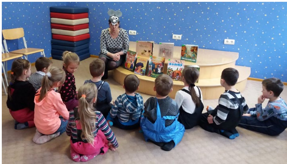
Bibliotēkas pelīte stāsta par jaunajām pasaku grāmatām

Martā Ainažu bibliotēku apmeklēja gan bērnu darza Randa sagatavošanas grupas audzēkņi, gan Krišjāņa Valdemāra Ainažu pamatskolas 3. un 6. klases skolēni. Mazie bērnu darza ģipari kopā ar bibliotēkas pelīti iepazīs ar jaunākajām pasaku grāmatīņām. Kopīgi lasījām brāļu Grimmu pa-