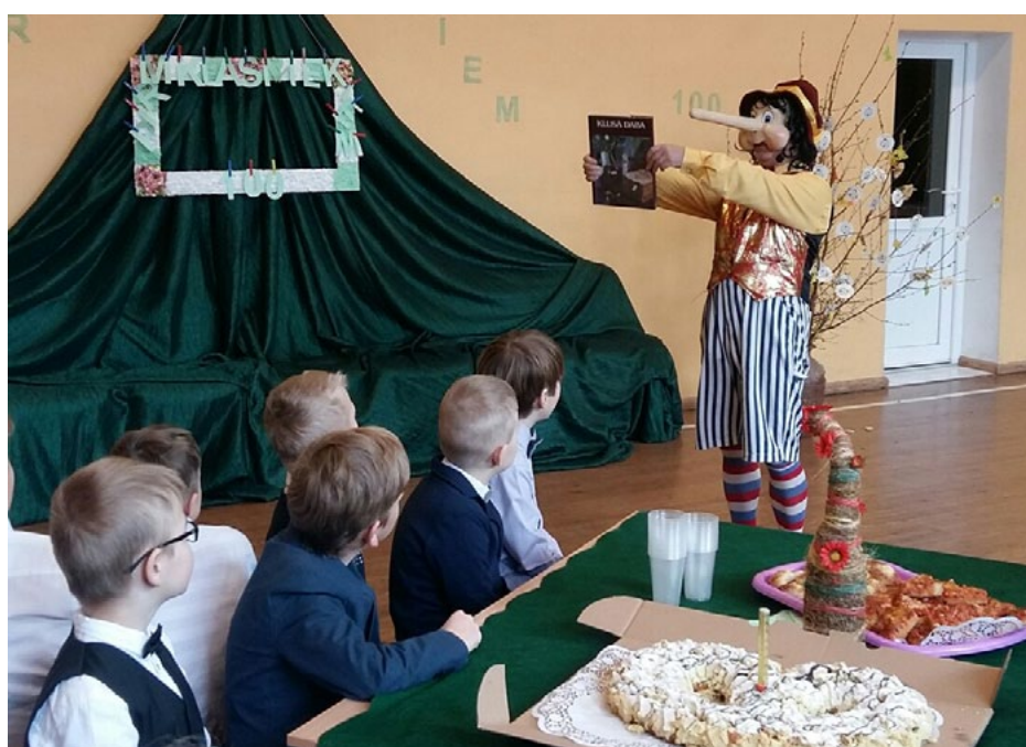
Pinokio tiekas ar novada pirmklasniekiem

Krišjāņa Valdemāra Ainažu pamatskolas 1. klases audzinātāja