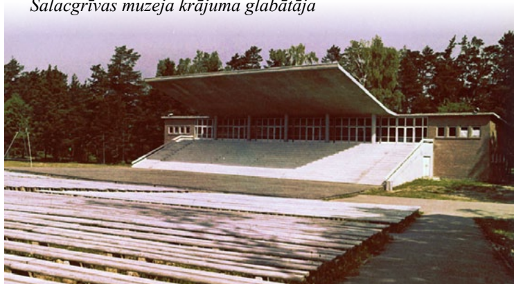
Ir tapusi vieta, kur ar vērienu svinēt svētkus, skatīties teātra izrādes un koncertus, rīkot balles!