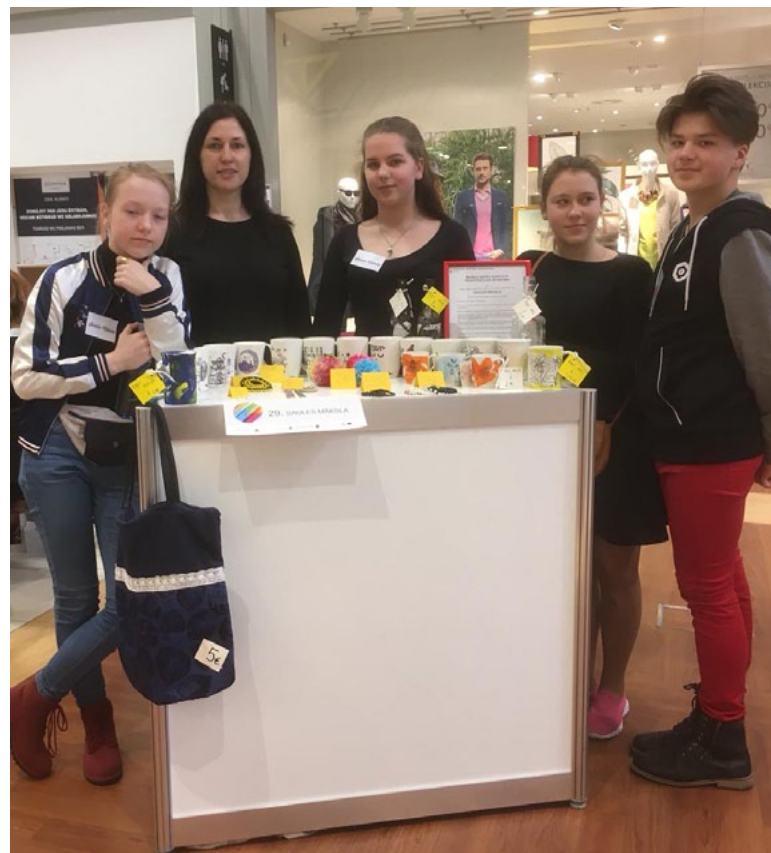
Salacgrīvieši SMU gadatirgū tirdzniecības centrā Domina Shopping Rīgā