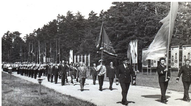
Pa piebraucamo ceļu tuvojas svētku gājiens. 1970. gadi