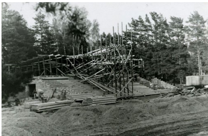
Galvenais objekts – estrāde, ko fotoattēlos var aplūkot jau no pašiem celtniecības sākuma posmiem