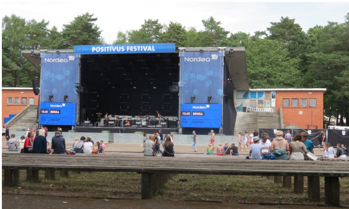
Nu jau vairāk nekā 10 gadu, kad Zvejnieku parkā notiek grandiozais festivāls Positivus , viena no skatuvēm tiek uzbūvēta arī uz vecās estrādes. Svētki turpinās!