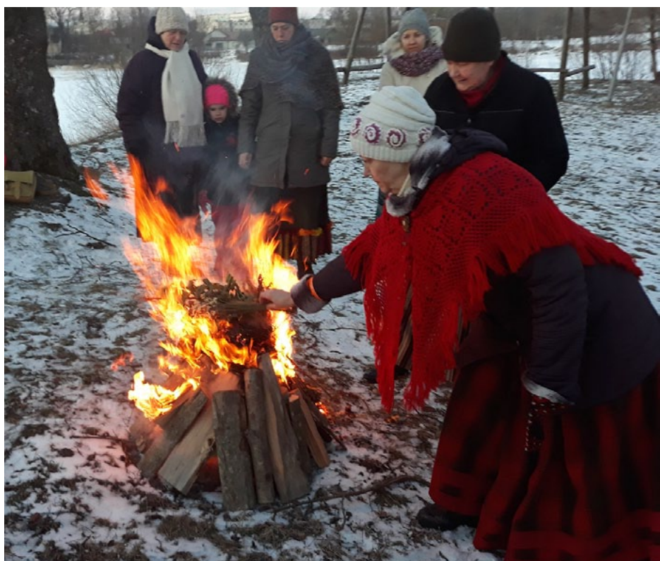
Folkloras kopa Cielava sveic sauli un pavasari Salacgrīvas pilskalnā

Lielā dienā jeb pavasara saulgrieži ir laiks, kad daba un cilvēki svin gaismas uzvaru pār tumsu. Saule ceļo pasaules kalnā augšup. Ikkatrs to jūt, redzot, kā diena kļūst aizvien garāka, parādās pirmie asni, atskan putnu balsis, aukstums atkāpjas un gaisma aizdzēn tumsu. Tuvojās brīdis, kad gaisma šajā gadskārtas lokā svinēs galīgo uzvaru pār tumsu.