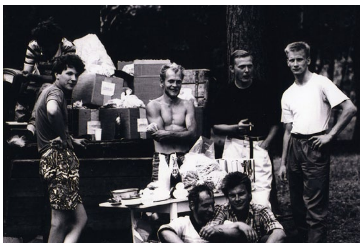
Neiztrūkstošā svētku sastāvdaļa – bufete, kas izvietojās aiz estrādes. 1989. gads