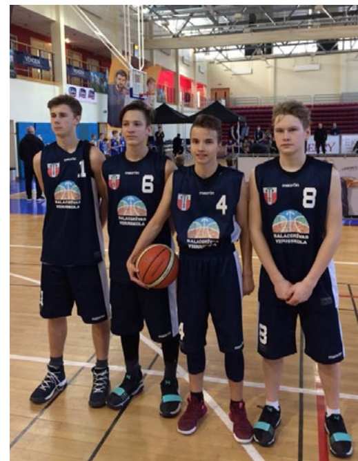
Mūsējie Ghetto Basket 3x3 skolu čempionātā