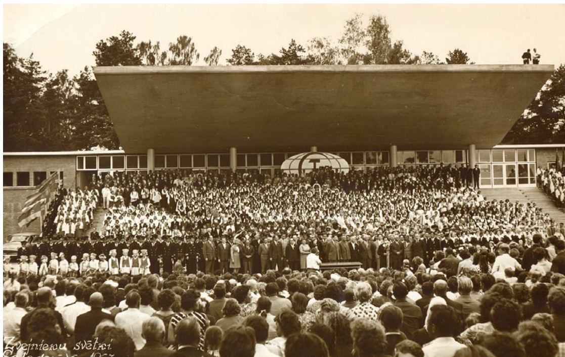
Sākot ar estrādes atklāšanu – 1967. gada Zvejnieku svētkiem –, tā katru gadu pulcē cilvēku tūkstošus