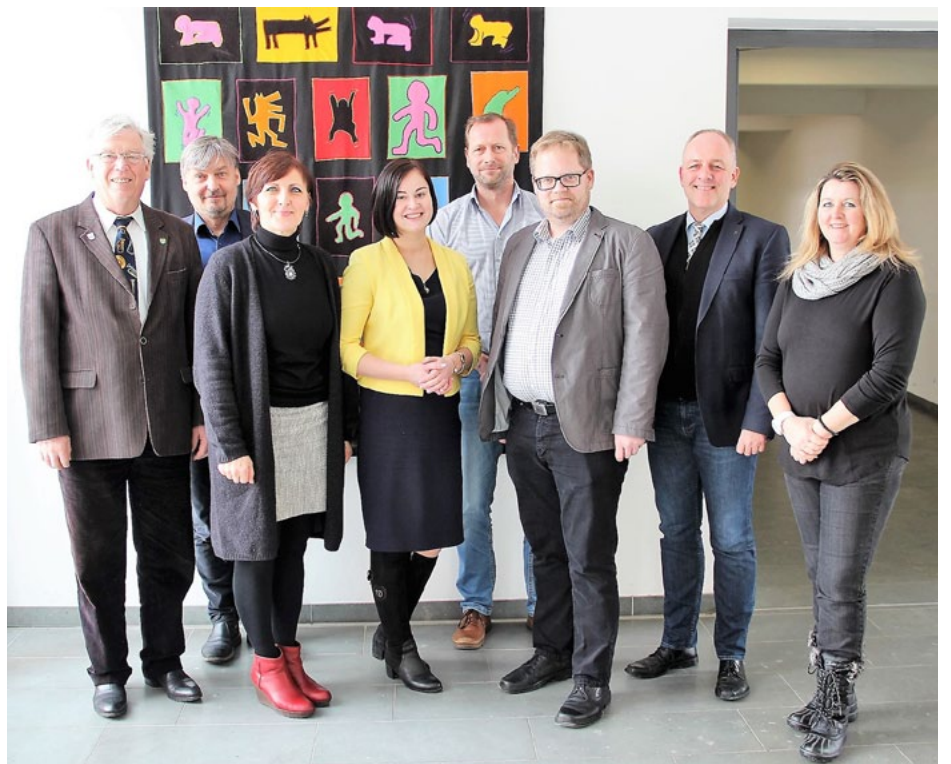
Salacgrīvas un Handevitas pašvaldības pārstāvji Siegfried-Lenz skolā Handevitā