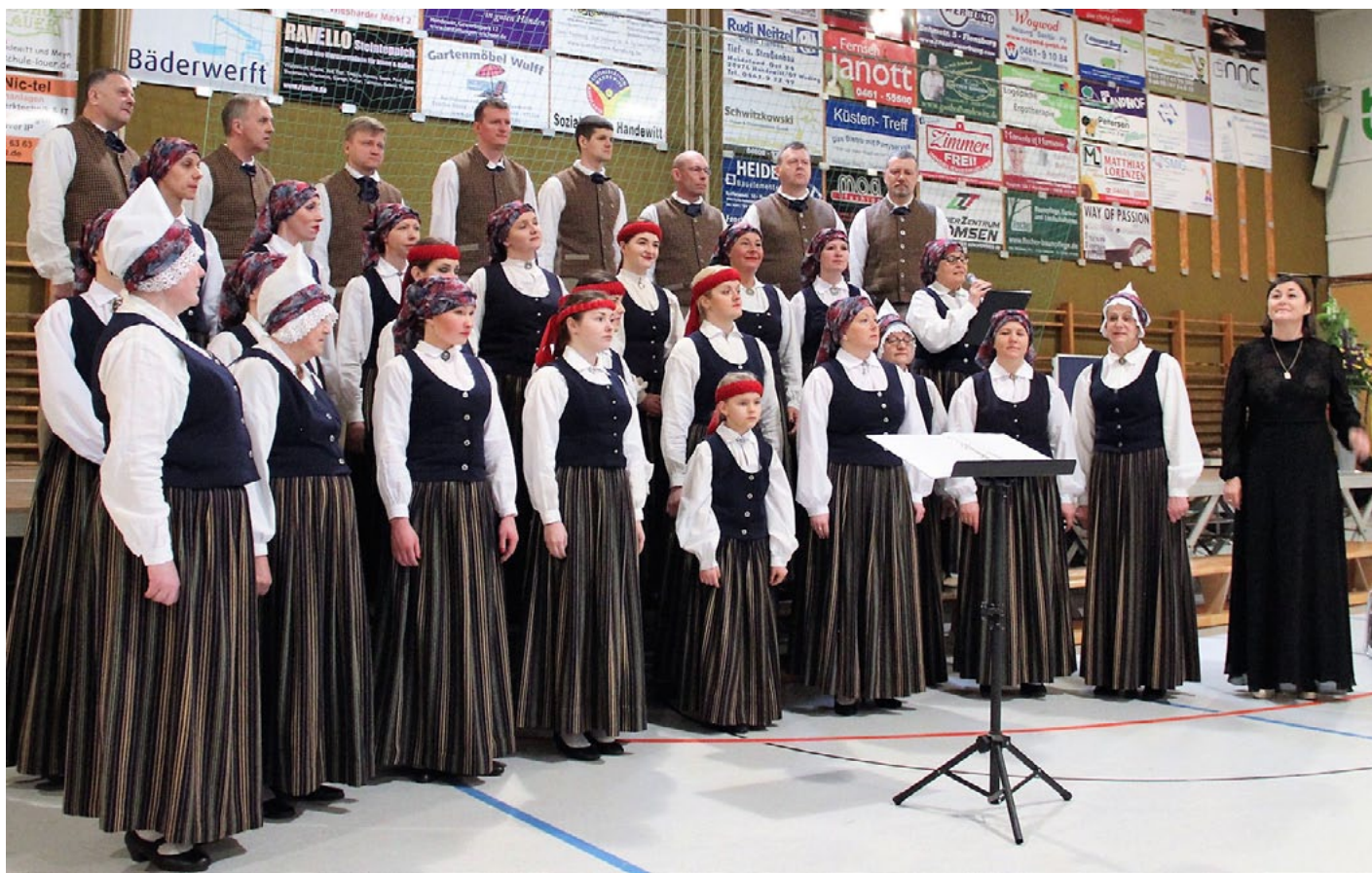
Koris Pernigele hallē Wiking Handevitā