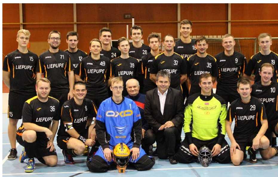
Liepupes florbolisti ir gatavi vieglām un grūtām uzvarām