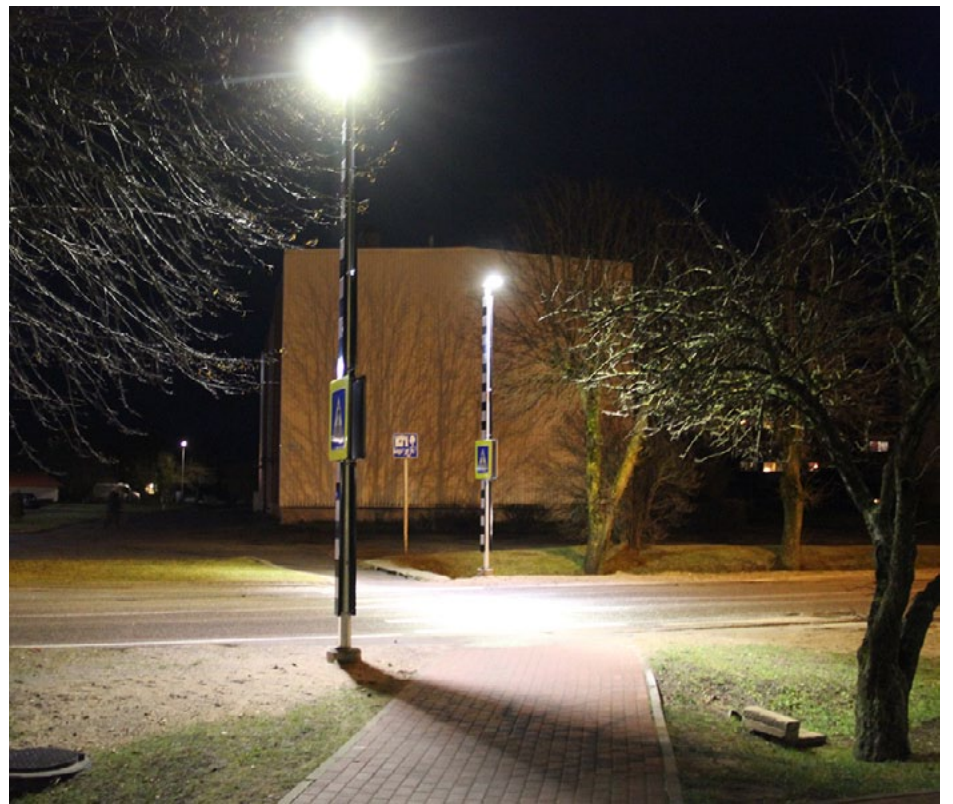
Gaiša un pamanāma tagad ir pāreja Vidzemes ielā pie veikala top!