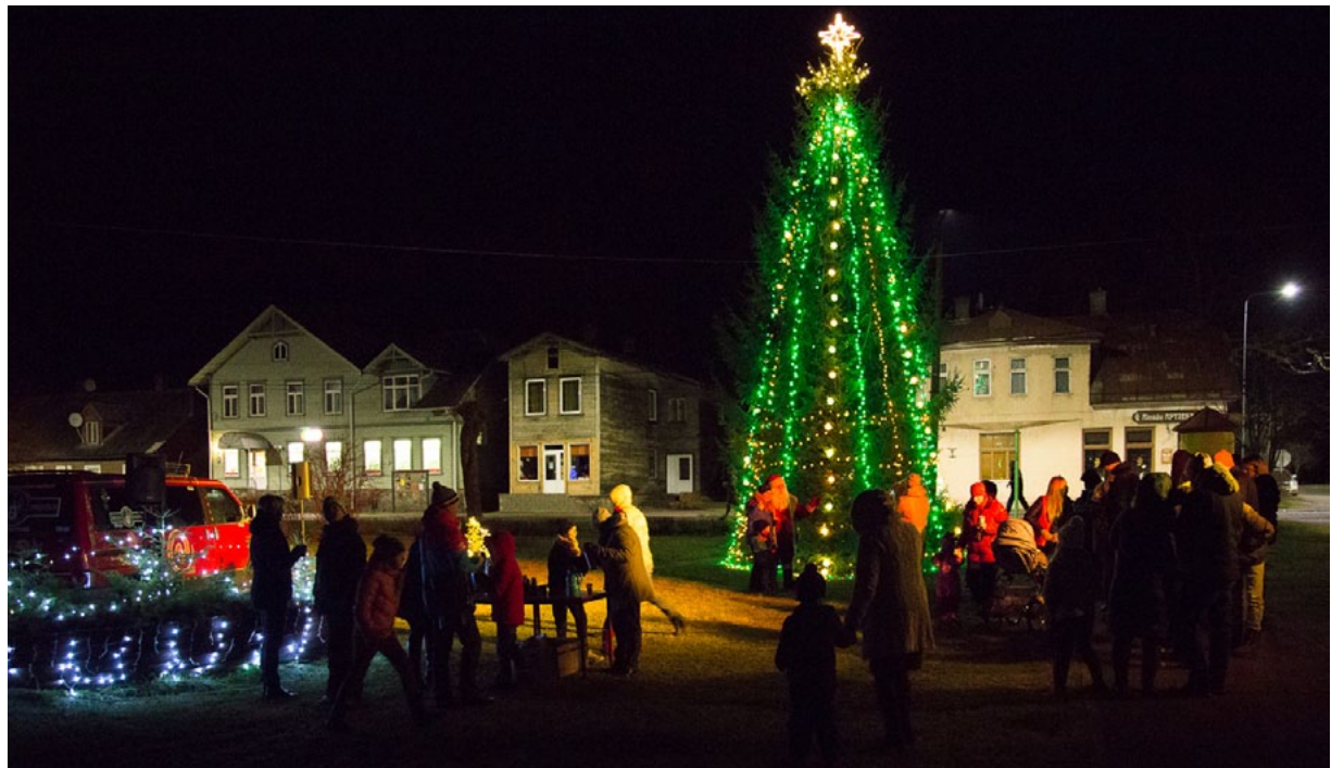
Lielajiem un mazajiem par prieku 9. decembra pēcpusdienā pilsētas centrā gaiši iemirdzējās svētku egle

Inese Vēriņa-Lubiņa, Ainažu kultūras nama Mākslinieciskās daļas vadītāja Autores foto