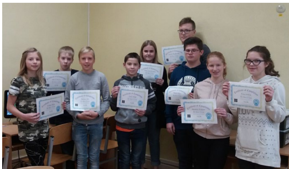
Beidzot pirmo Programmēšanas stundu, skolēni saņēma sertifikātus par dalību starptautiskajā kampaņā Hour of Code