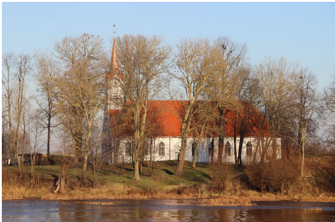
Lielsalacas ev. lut. baznīca nu priecē salacgrīviešus un viesus visā savā cēlumā

Vēl īpašs notikums bija tas, ka tagad varēja arī apsekot un digitalizēt abus vēstījumu oriģinālus, kas atrodas baznīcas torņa lodē. Abi vēstījumi (no 1857. un no 1909. gada) ir rakstīti vācu valodā rokrakstā, ko nemaz tik viegli nevar izlasīt. Vienā