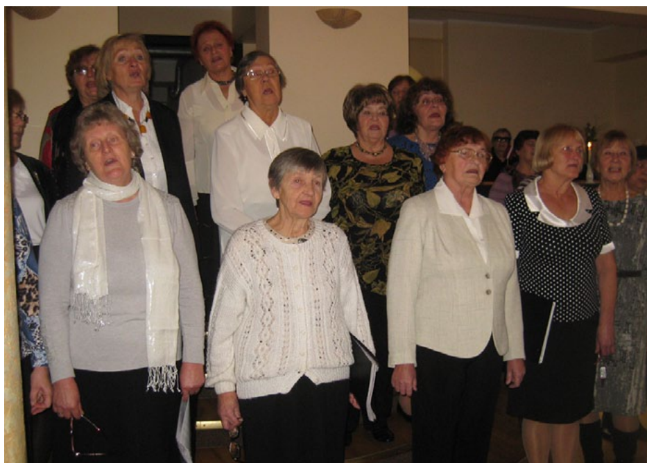
Brīziešus ar savām dziesmām priecē Salacgrīvas senioru koris Salaca

Gada nogalē SAR viesnīcā Brīze seniorus iepriecināja trīs kori. Vērojām, cik daudzveidīgs var būt dziesmas izpildījums un skanējums, jo katram korim ir sava seja . Taču visvairāk priecēja visu koristu vienkāršība, atvērtība un sirsnīgums, ar kādu viņi šeit ieradās. Savukārt mēs centāmies ciemiņus sirsnībā uzņemt un pateikties.