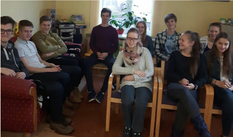
Salacgrīvas vidusskolēni pilsētas bibliotēkā

Salacgrīvas vidusskolas 11. klases skolēni 27. novembrī un 4. decembrī apmeklēja bibliotekārās stundas, ko rīko Salacgrīvas pilsētas bibliotēkas darbinieces. Šo stundu mērķis ir iepazīstināt skolēnus ar bibliotēkas piedāvājumu. Nodarbības skolēni tika iepazīstināti ar novada bibliotēku elektroniskā kopkataloga izmantošanas iespējām. Pateicoties tam, jebkuram lasītājam ir iespējams attālināti pārliecināties, vai meklētā grāmata ir bibliotēkā. To var arī pasūtīt laikus, pēc tam tikai aiziet to saņemt. Pats lasītājs attālināti var arī pagarināt grāmatas atdošanas termiņu. Tāpat iespējams aplūkot savu lasītāja statusu. Ja grāmatas nav bibliotēkā, to var iegūt lasīšanai arī no citas novada bibliotēkas, jo tās visas ir vienotā sistēmā.