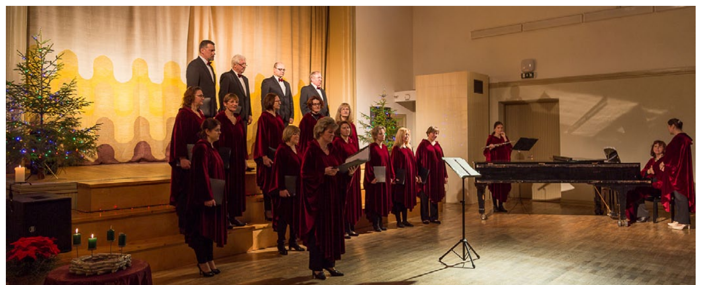
Īstu svētku noskaņu radīja kora Dvēseles dziesma dziedājums