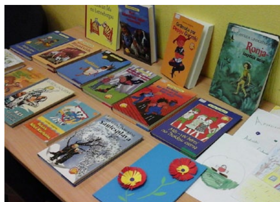
Svinot rakstnieces Astrīdas Lindgrēnes 110. dzimšanas dienu, bērni iepazīs ar autores darbiem

8. novembra pēcpusdienā Liepupes bibliotēkā ieradās Liepupes vidusskolas bibliotēkas 1.–4. klašu lasītāju pulciņš, lai atzīmētu populārās zviedru rakstnieces