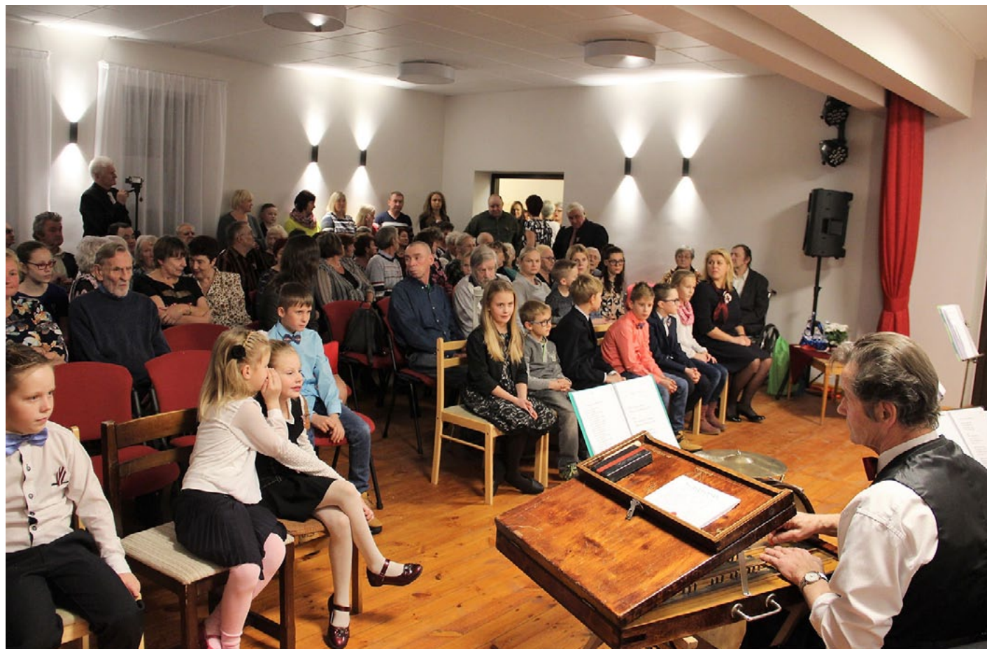
Atjaunotajā zālē sēdvietu vismaz atklāšanas pasākumā visiem nepietika!

Kad bija izskanējuši pateicības vārdi, pasniegtas dāvanas un nodziedāta dziesmi-