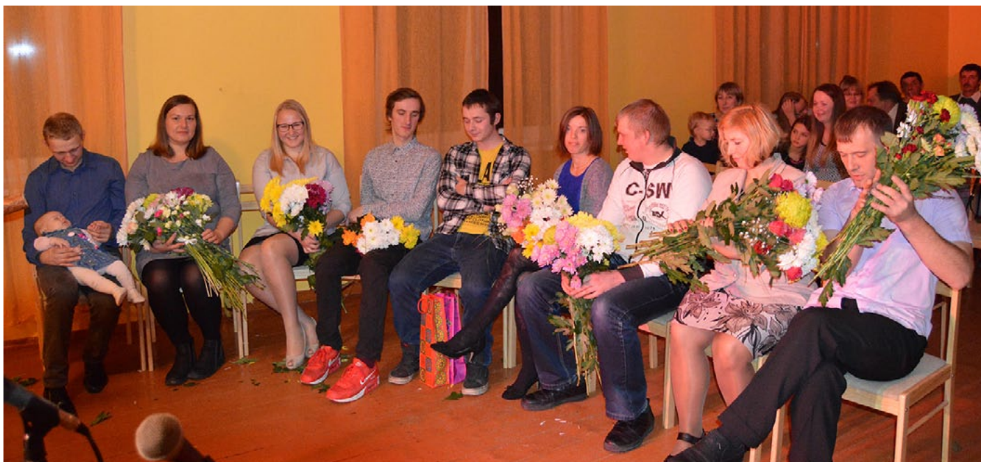
Novembra pirmajā sestdienā tautas namā tika mīļi gaidīti šā gada gaviļnieki tradicionālajā pasākumā Nāc gadu spietā veldzēties

Novembra pirmajā sestdienā tautas namā tika mīļi gaidīti šā gada gaviļnieki tradicionālajā pasākumā Nāc gadu spietā