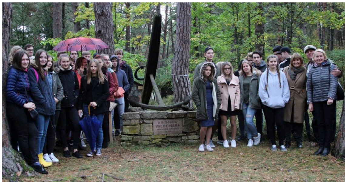
Salacgrīvas novada skolēni pie pieminekļa Krišjāņa Valdemāra 150 gadu atcerei