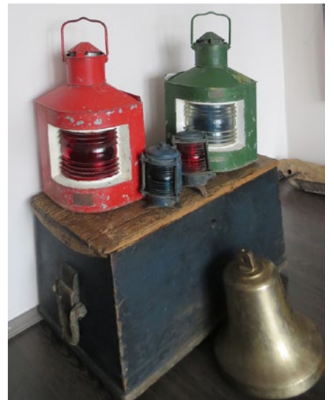
Salacgrīvas muzeja dārgumi piedalās festivālā Staro Rīga un pārstāv Salacgrīvu kopīgā Latvijas muzeju izstādē