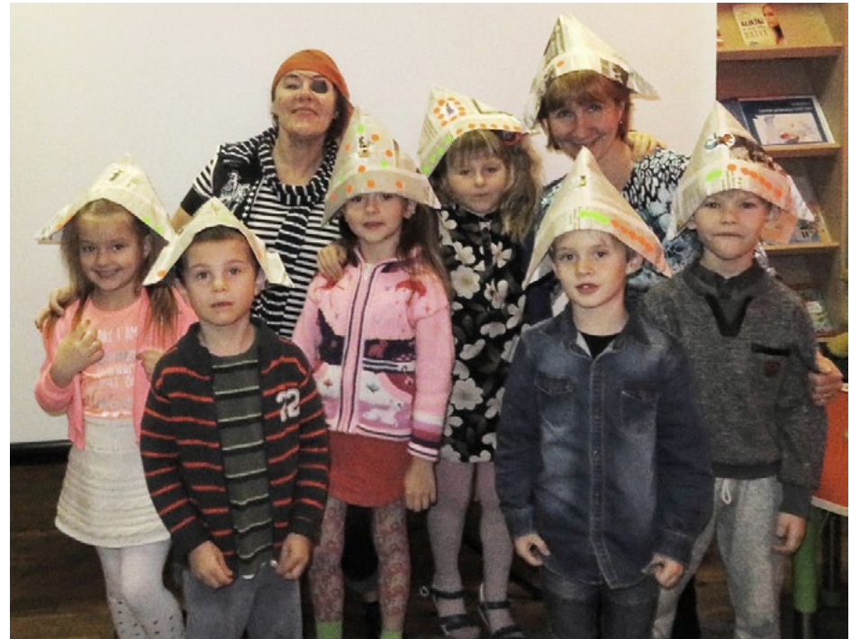
Mazie svētciešie patraucēja Pirātam atrast un nolaupt Dārgumu lādi

Nākamā diena sākās ar Rīta stundu bērniem. Agri no rīta mazos kaimiņus no Snīpju grupas pārsteidza Pirāts, kas tikko ieceļojis Svētupē, lai tieši bibliotēkā meklētu dārgumu lādi. Bet bērni viņu pārsteidza, plāns neizdevās, un bija vien