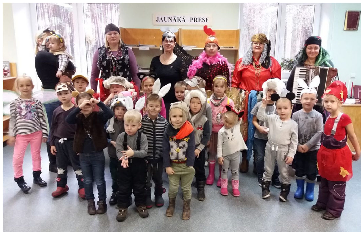
Bērnodārza Randa mazie ķipari kopā ar audzinātājām masku gājienā apciemoja Ainažu pilsētas bibliotēku

Zeme rīb, rati kladz, kas to zemi rībināja? Nu atbrauca Mārtiņdiena