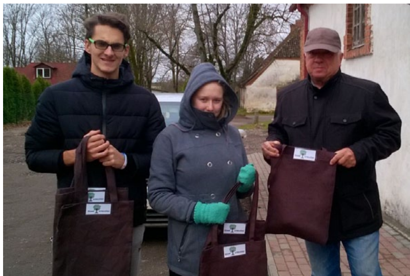
Pašu šūtie iepirkumu maisiņi liepupiešu rokās

Jau par tradīciju kļuvušas Ekoskolu Rīcības dienas. Kopš 2012. gada skolas no visas pasaules, tostarp gandrīz 200 Latvijā, rīko dažāda veida un mēroga pasākumus, lai aicinātu sabiedrību pievērsties videi draudzīgākam dzīvesveidam. Šogad Ekoskolu Rīcības dienas notika no 30. oktobra līdz 5. novembrim.