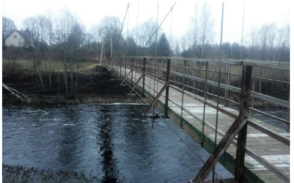
Kājnieku tiltam pār Salacu nu atjaunots dēļu klājums

23. novembrī pabeigti koka tilta pār Salacas upi pie Mērnikiem remontdarbi, ko veica vietējais uzņēmums – SIA Nobe .