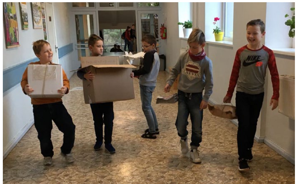
Makulatūras vākšanas akcija Nāc uz skolu ar makulatūras sainīti! Salacgrīvas vidusskolā