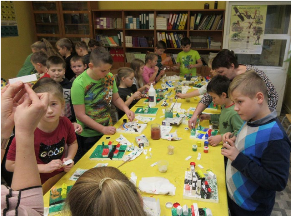
Skolēni radošajā darbnīcā veido savu mazās pasaules gabaliņu, ko vēlāk ielika vienā lielā, pašu veidotā mini Latvijas fragmenta maketā

6. novembrī Krišjāņa Valdemāra Ainažu pamatskolas 1., 2., 3. un 4. klases skolēni, pateicoties projektam Karjeras atbalsts vispārējās un profesionālās izglītības iestādēs , piedalījās aizraujošā nodarbībā. Ar modeļu izveidi, programmēšanu un mehatroniku saistītas nodarbes katru gadu kļūst aizvien populārākas visā pasaulē. Tās attīsta telpisko domāšanu, veicina radošu un izzinošu apmācības procesu, vienlaikus mudinot apgūt elektronikas un mehānikas prasmes.