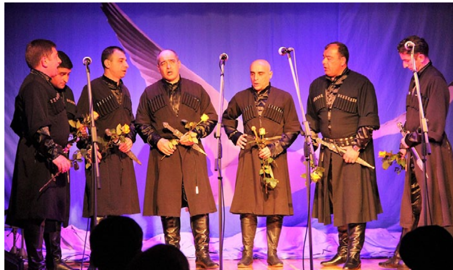
Gori vīri dzied akustiskās mūzikas festivālā Liepupē

Maija otrajā nedēļā Salacgrīvas novadā viesojās Gori pašvaldības no Gruzijas delegācija. Kopā ar Gori pilsētas domes pārstāvjiem bija atbraucis arī turienes vīru ansamblis, kas uzstājās akustiskās mūzikas festivālā Sudraba kaija koncertā Liepupes tautas namā 12. un 14. maijā un 15. maijā Salacgrīvas kultūras namā.