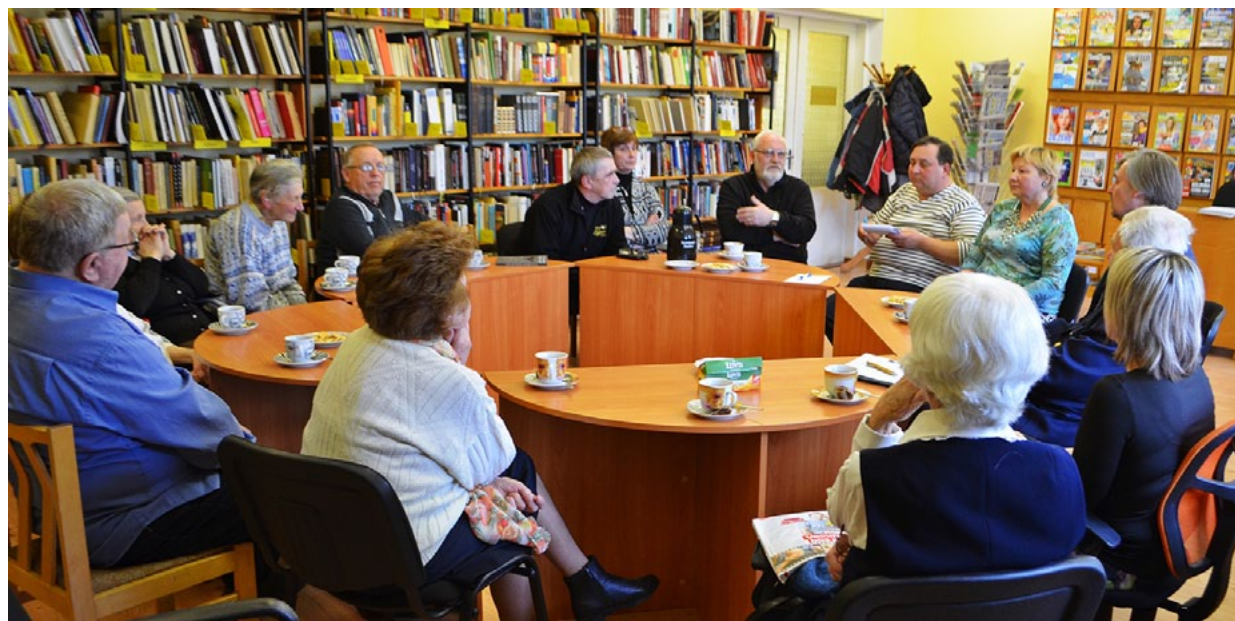
Bibliotēku nedēļā Salacgrīvas bibliotēkā viesojās Bibliokuģis

Projekts sevī ietver bibliotēku un jūrniecības centru vienuviet. Bibliokuģis nodarbina komandas biedru galvas jau vairāk nekā gadu. Šobrīd jau paveikta ļoti būtiska, taču citu acīm neredzama lieta – ir gatavs saturs jeb kuģa daļa, kas iegremdēta ūdenī.