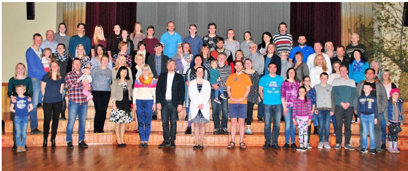
Sezonas pēdējās erudīcijas spēles dalībnieku kopbilde. Ceram, ka turpinājums sekos!

Sezonas noslēgumā erudīcijas spēlē Prātnieks piedalījās 12 komandu. Viena komanda šoreiz piedalījās pirmo reizi šajā sezonā.