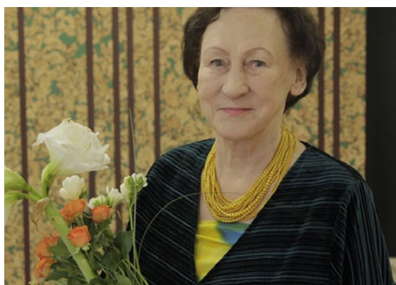
Māra Svīre aicina uzticēties dzimtajam krastam un novadam

Māru Svīri mēs pazīstam uzreiz – sejā, daiļdarbos, rakstos. Likteņa līdumniekus vai Limuzīnu Jāņu nakts krāsā zinām gandrīz no galvas. Protams, pateicoties ekranizējumiem, jo rakstnieka darbs tajos ir pacelts jaunā, atmiņā vēl paliekošākā kvalitātē. Un tāds arī ir dzīves skaudrais likums – viens tu nevari visu, divatā tomēr drošāk un paliekošāk. Ekrāna darbos kopā ar talantīgiem režisoriem Virdžīniju Lejiņu un Jāni Streiču, dzīvē – ar Vladimīru Kaijaku turpat 46 gadu garumā.