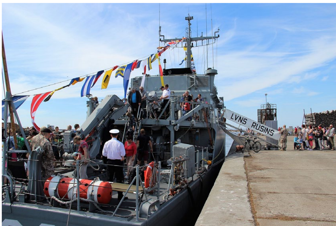
Jūras spēku mīnu kuģi apskatīja daudzi salacgrīvieši un svētku viesi