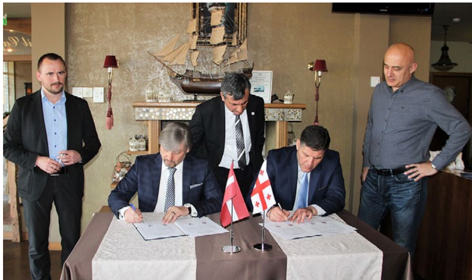
Gori un Salacgrīvas pašvaldību sadarbības līguma parakstīšanas brīdis