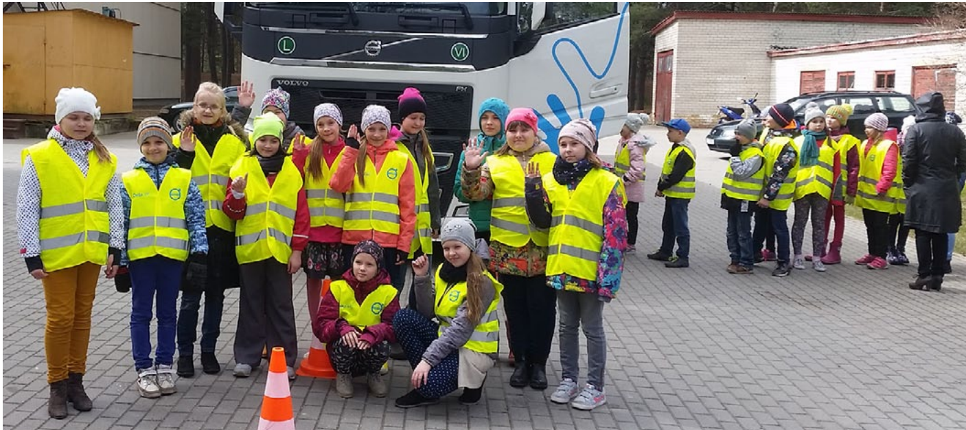
Uzņēmuma Volvo Trucks kampaņa Apstājies. Paskaties. Pamāj bija izzinoša, pamācoša un ļoti praktiska. Patika skolēniem un pedagogiem. Varbūt šādu akciju vajadzētu organizēt arī pieaugušajiem?

Centrālās statistikas pārvaldes dati liecina, ka pēdējos piecos gados uz Latvijas ceļiem ik gadu bojā iet vidēji septiņi, pērn – 11 bērni. Ievainoto bērnu skaits ir dramatiskāks – ik gadu vidēji 453 bērni satiksmes negadījumos gūst traumas. Lai dotu savu ieguldījumu un mazinātu bojāgājušo un cietušo bērnu skaitu, uzņēmums Volvo Trucks sācis kampaņu Apstājies. Paskaties. Pamāj. Tās laikā daudzās Latvijas skolās bērniem ir iespēja piedalīties praktiskajās nodarbībās, kuru laikā tiek stāstīts par drošību, īpaši, ja satiksmē iesaistītas kravas automašīnas un citi liela izmēra transportlīdzekļi. Tiek demonstrēta īpaša šai kampaņai radīta multfilma par kravas automašīnas šoferi Juri un bērnu drošību satiksmē, kuras tekstu ierunājis pazīstamais mūziķis Jānis Šipkēvics.