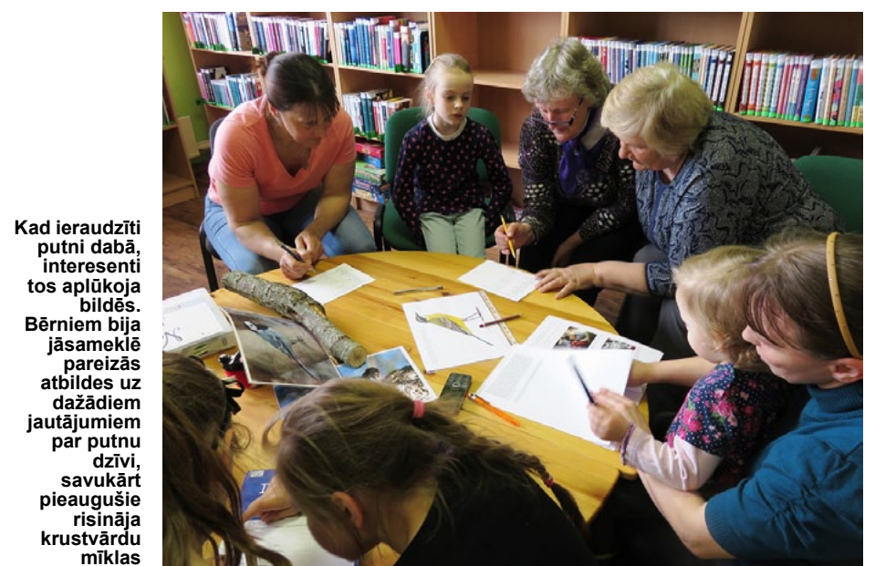
Kad ieraudzīti putni dabā, interesenti tos aplūkoja bildēs. Bērniem bija jāsameklē pareizās atbildes uz dažādiem jautājumiem par putnu dzīvi, savukārt pieaugušie risināja krustvārdu mīklas

Visi kopā mēģinājām salikt puzles un pazīt putnus pēc pierakstītajām skaņām. Tas nebija viegli, jo tik virtuozu trallināšanu, vīterošanu vai svilpošanu ar vārdiem nemaz pierakstīt nevar. Kura putna dziesmā mēs saklausām vhēēe , kura rju-pink , pink vai fiu-luū ? Skaņas jādzird. To arī darījām. Apbruņojušies ar binokļiem, devāmies vērot un klausīties putnus dabā. Ko tik te neieraudzījām! Jaunākie putnu vērotāji tepat pie puķu dobes esot redzējuši pat pūci, bet tai blakus dzeguzi... Jā, brīnumi notiek! Bet tas, ka tepat aiz sētas pastaigājas stārķi un dzērves, pat bez binokļa bija saskatāms. Baltais ievas krūms raisās vaļā savā ziedēšanas priekā un tam noteikti piestāvētu lakstīgala, bet mazo pogočāju ieraudzīt mums tā arī neizdevās, to tikai dzirdējām. Kuplajā kļavā izlikti būrtīši strazdiem, tāpēc ar interesi vērojām, kā šie svilpotāji pārnēs vakariņu labumus savām mazuļu saimēm. Ja viens no vecākiem aizlaižas pēc barības, otrs paliek pie bērniem. Pienesot dienā vairāk nekā 200 porciju kukaiņu, vecāki tos ļoti cītīgi baro un apsargā. Lai labāk pazītu apkārtne esošos putnus, izmantojām arī grāmatas par putnu sugu noteikšanu. Precīzas ziņas par Latvijā sastopamajām putnu sugām, to dzīvesvietām, uzvedību un balsīm iespējams atrast bibliotēkas krājumā esošajās LOB izdota-