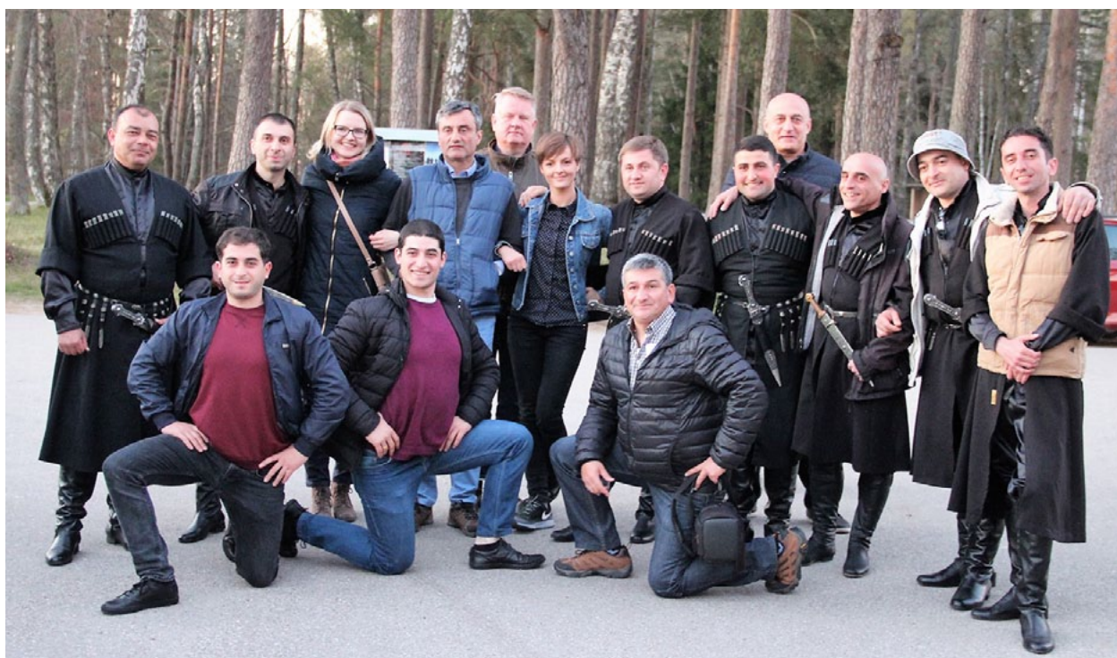
Viesi no Gruzijas pēc uzstāšanās festivālā ir gandarīti – gūta jauna pieredze, prieks un draugi!

un draudzība starp divām pašvaldībām ir svarīga ne tikai mums, bet arī nākamajām paaudzēm, savukārt Salacgrīvas novada pašvaldības vadītājs sacīja, ka līguma pa-