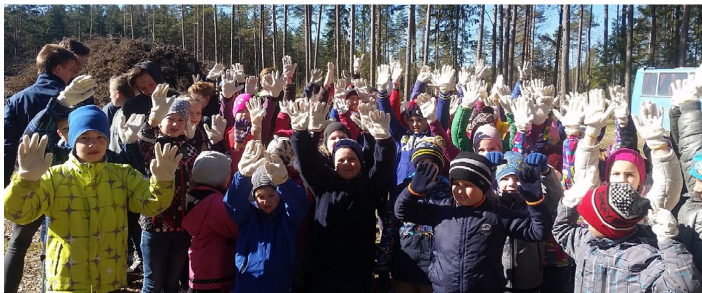
Cimdi rokās! Salacgrīvas vidusskolas skolēni gatavi darbam