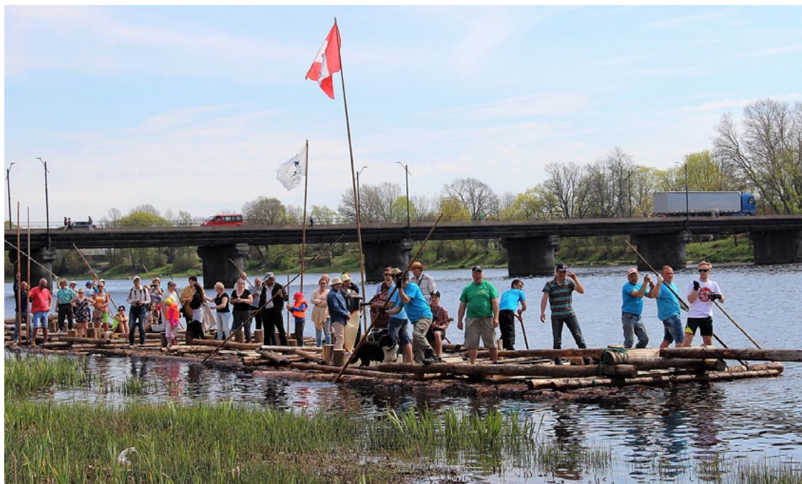
Plosts piestāj Salacas krastā pie promenādes