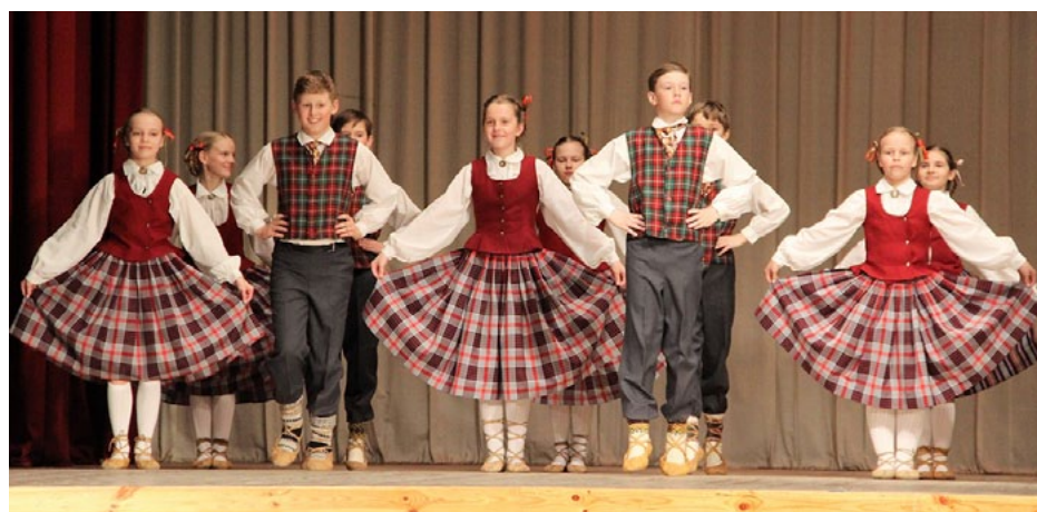
Dejo Vēverīšu 3.—4. klašu deju kolektīvs