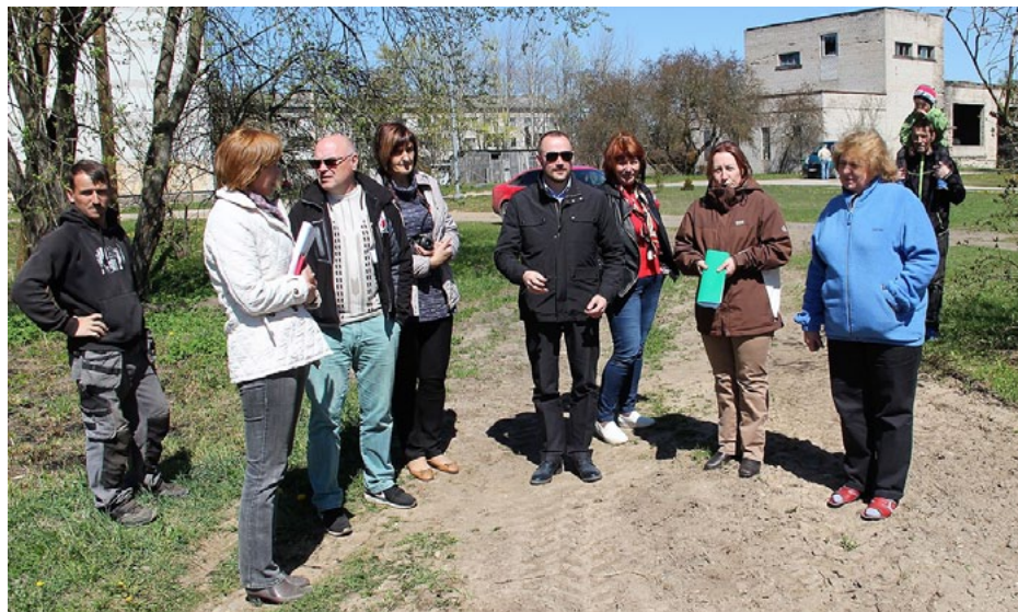
Svētciemā, Rīgas ielas 2.a nama iedzīvotājiem ir skaidrs, kādam jābūt plānotajam bērnu laukumam

16. maijā Salacgrīvas novada domes izveidota komisija devās iepazīties ar pašvaldības projektu konkursam Iedzīvotāji veido savu vidi iesniegtajiem projektiem un tajos veicamajiem darbiem. Šogad projektu konkursā iesniegts 11 pieteikumu no Salacgrīvas, Korģenes, Svētciemā un Liepupes.