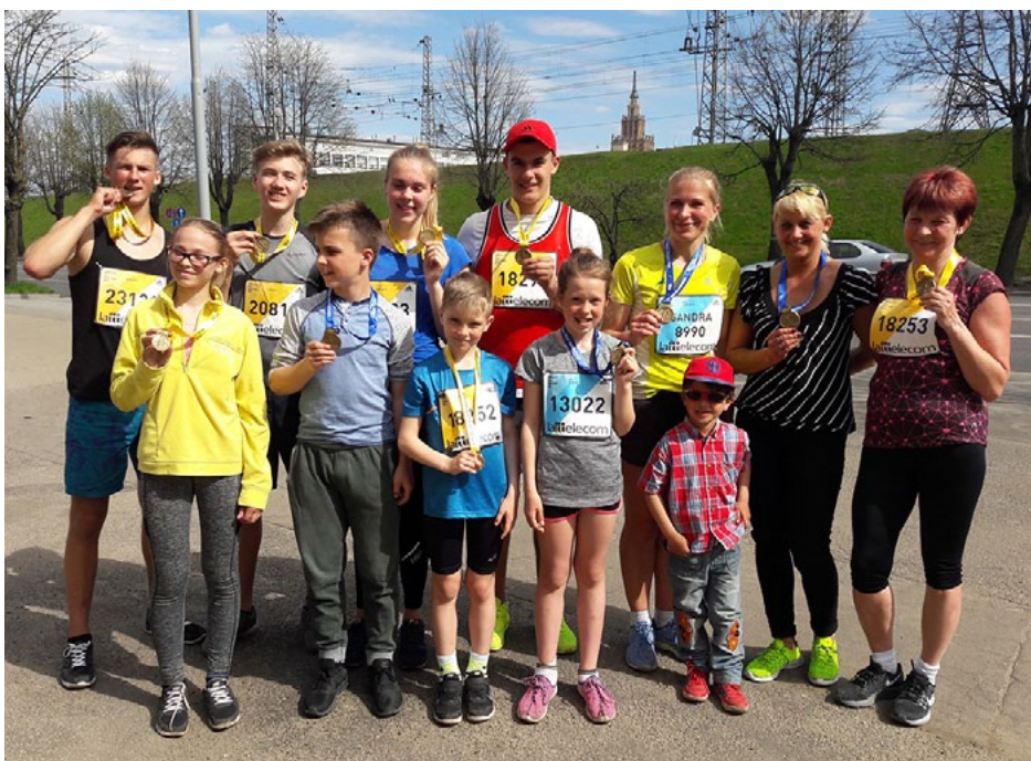
Lielie un mazie salacgrīvieši ir saguruši, bet priecīgi – uzdevums godam veikts!

14. maijā Salacgrīvas vidusskolas skolēni un arī daži pieaugušie piedalījās Lattelecom Rīgas maratonā. Šajā pasākumā Salacgrīvas vidusskola piedalās no pašiem pirmsākumiem, t.i., 26. gadu. Arī šogad ar