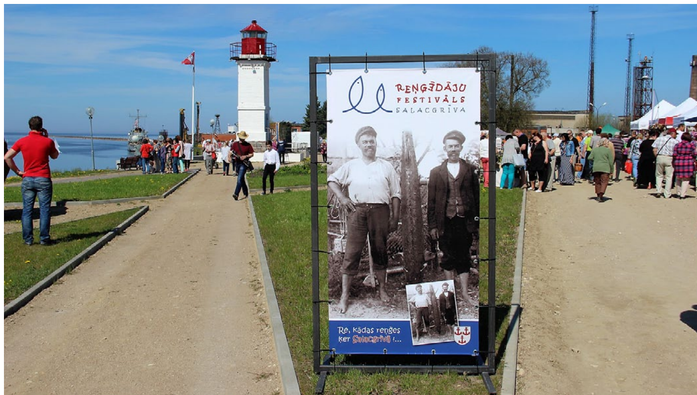
Otrais Reņģēdāju festivāls gaida savus viesus