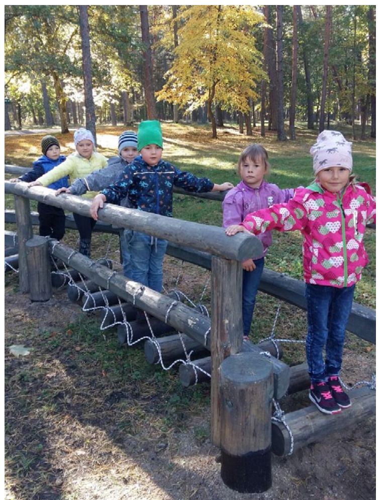
Mazie ainažnieki izmēģina nupat uzstādīto līdzsvara taku

Latvijas pašvaldību savienības Meža dienās 2016. gadā sākusi jaunu tradīciju trīs gadu garumā ar moto Kopā nākotnes mežam!