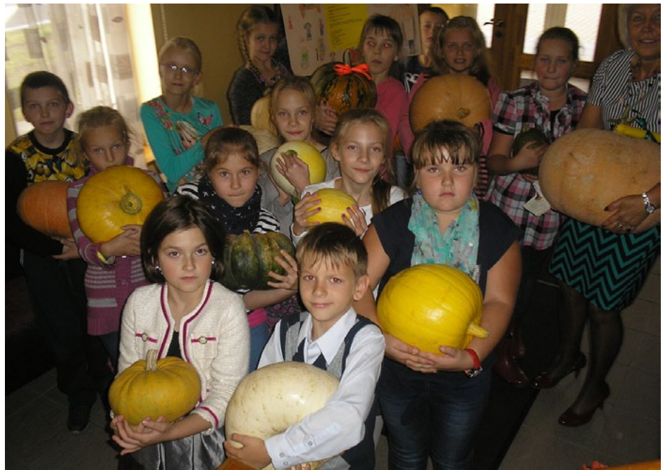
Pašu audzētie ķirbji nu atraduši ceļu pie senioriem Brīzē

Labdarības organizācija Palīdzēsim.lv jau vairākus gadus rīko akciju Labo darbu nedēļa , kad īpaši aktīvi darām labus darbus gan paši, gan mudinām to darīt arī citus. Labo darbu nedēļā pastiprināta uzmanība tiek pievērsta palīdzībai, kuras sniegšanai nav nepieciešams liels finansiālais ieguldījums. Tā var būt palīdzība kādam pensionāram mājas darbos vai vienkārša aprunāšanās, daudzdzīvokļu piemājas teritorijas sakopšana, rūpes par dabu, dzīvniekiem utt. Palīdzēt - tas var būt patīkami, aizraujoši un tik ļoti nozīmīgi grūtos brīžos. Palīdzība vairo arī prieku un gandarījumu pašam palīdzētājam. Tā domā arī Salacgrīvas vidusskolas 3.a klases skolēni un viņu audzinātāja. Nav jāgaida Labo darbu nedēļa, lai paveiktu kaut ko labu, kas sniedz gandarījumu gan saņēmējiem, gan pašiem darītājiem, devējiem.