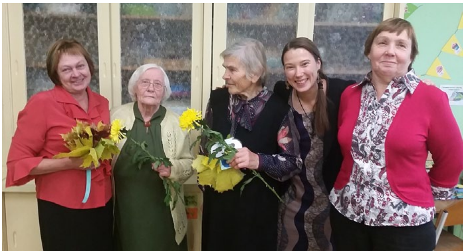
Ļoti sirsnīga un atmiņu stāstījumiem bagāta bija šī tikšanās

Mēdz uzskatīt, ka pirms mūsu ierašanās šajā pasaulē Dievs jau lielajā Likteņa grāmatā ierakstījis gan mūsu katra dzīves ceļu likločus un cilvēkus tajā, gan arī mūsu profesiju. Skolotāja profesija ir īpaša. Skolotājs, dodot no sevis labāko, iedvesmo bērnu mācīties un palīdz viņiem piepildīt savus sapņus. Aristotelis savulaik teicis: - Skolotājs, kam bērni ir pateicību parādā par labu audzināšanu, ir godājamāks par vecākiem, kuriem bērniem ir jāpateicas vienīgi par savu nākšanu pasaulē: viņi ir dāvājuši tikai dzīvību, bet citi - labu dzīvi.