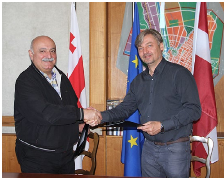
Nupat parakstīts nodomu protokols par Gori un Salacgrīvas pašvaldības sadarbību

Pēc Gori pašvaldības uzaicinājuma Salacgrīvas novada pašvaldības delegācija no 30. septembra līdz 3. oktobrim viesojās Gori pilsētā Gruzijā. Draudzība ar Gori pašvaldību aizsākās pērn, kad deju kolektīvs Tingeltangels tur piedalījās deju festivālā. Šogad augusta beigās Salacgrīvā viesojās Gori pašvaldības deputāti, bet septembra sākumā Gori uzstājās koris Krasts un pūtēju ansamblis All Remember .