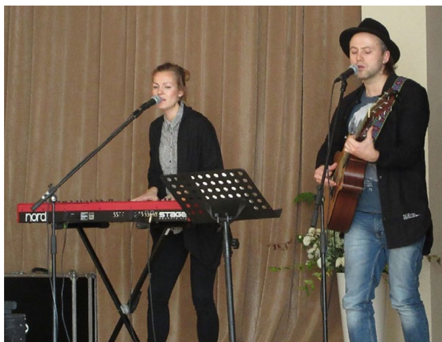
Grupa My Radiant U plašāku popularitāti ieguva pēc iekļūšanas 2016. gada Eirovizijas nacionālās atlasē konkursa Supernova finālā

Fragments no Diānas darba: „ Kas man patīk Tavās stundās? Man patīk, kā Tu komunicē ar mums, skolēniem. Man patīk, kā Tu centies iesaistīt mūs diskusijā, lai arī paši to nevēlamies. Man patīk, kā Tu skaidro jauno tēmu, lai visi saprastu un, ja ir vajadzība, izmanto papildu materiālus vai arī savas aktiermākslas prasmes. Un tas viss tikai tālab, lai mēs, skolēni, saprastu. Man patīk, kā Tu pievērsies tiem, kuriem iet grūtāk ar mācībām. Lai arī Tev ir grūti, Tu tomēr to neizrādi un centies cik spēka, lai skolēns saprastu, lai mums tas šķistu interesanti. Lai mēs nevis atsēdētu stundas, jo tā vajag, bet lai meklētu atbildes uz vēl neizdibinātiem jautājumiem. Skolotāj, paldies Tev! Paldies, ka iemācīji domāt citādāk! Paldies, ka palīdzēji saprast! Paldies, ka atbalstīji tad, kad gribēju visu mest pie malas! Paldies, ka palīdzēji augt! Skolotāj, es vienmēr Tevi atcerēšos! ” Šādus vārdus ar asarām acīs un smaidu sejā būtu klausījies skolotājs, ar kuru tiek runāts. Vai tas vēlies būt arī Tu?”