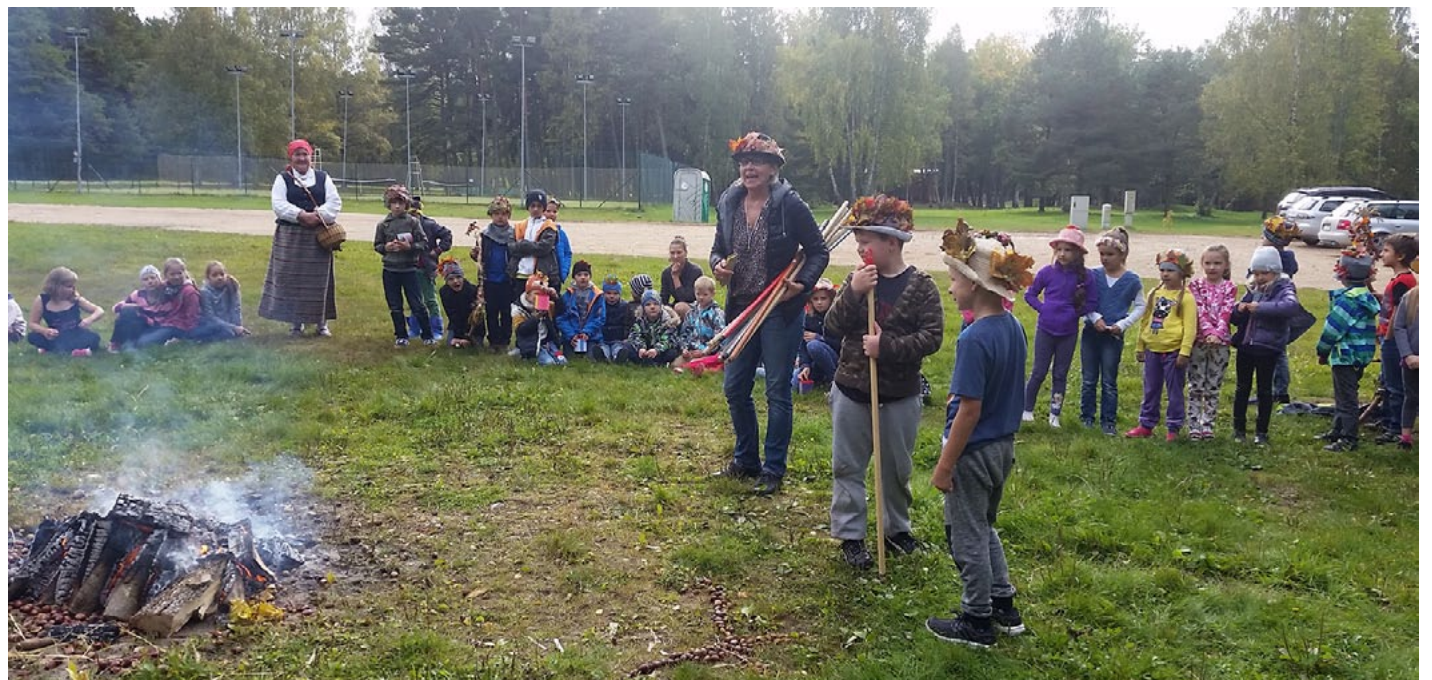
Kārtīgas rotaļas un izkustēšanās ir obligāta Miķeļdienas tradīcija