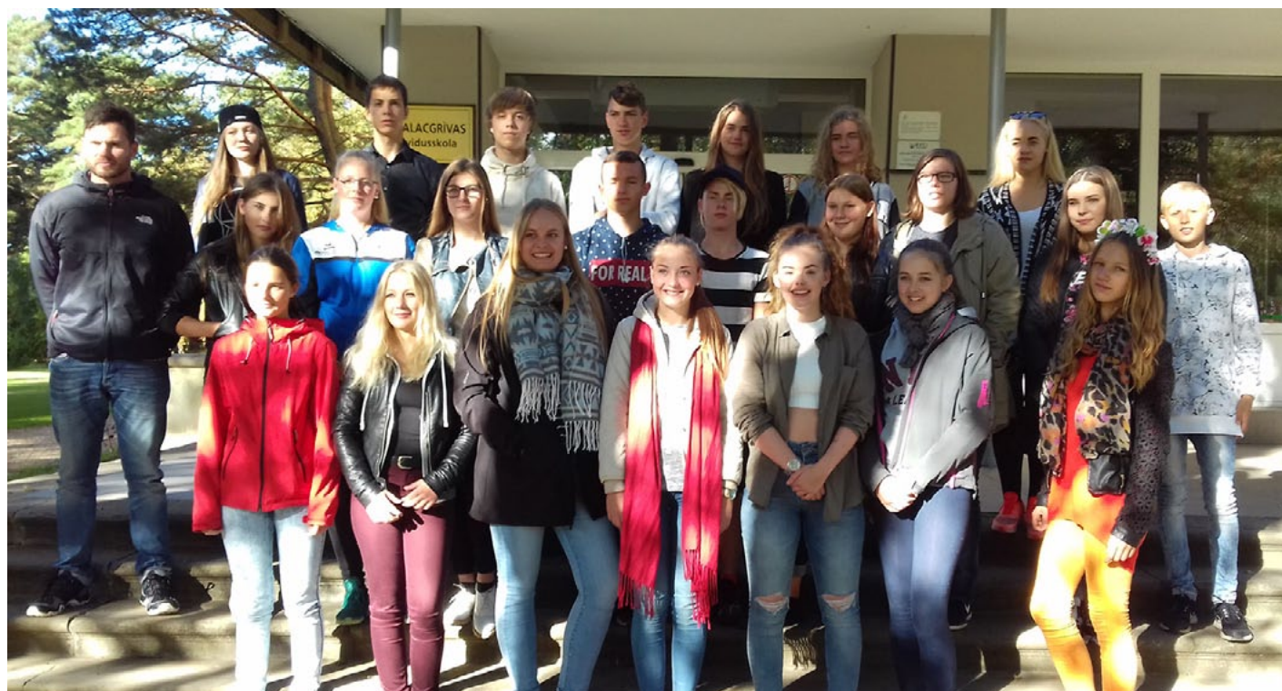
Salacgrīvieši kopā ar Handevitas skolēniem un skolotājiem