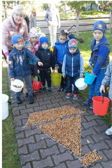
Mazo ainažnieku no ozolziļēm veidotais burinieks uz Ainažu jūrskolas bruģa

Vēlamies teikt lielu paldies audzēkņu vecākiem par atbalstu visos pasākumos. Un liels paldies tiem labajiem un mīļajiem