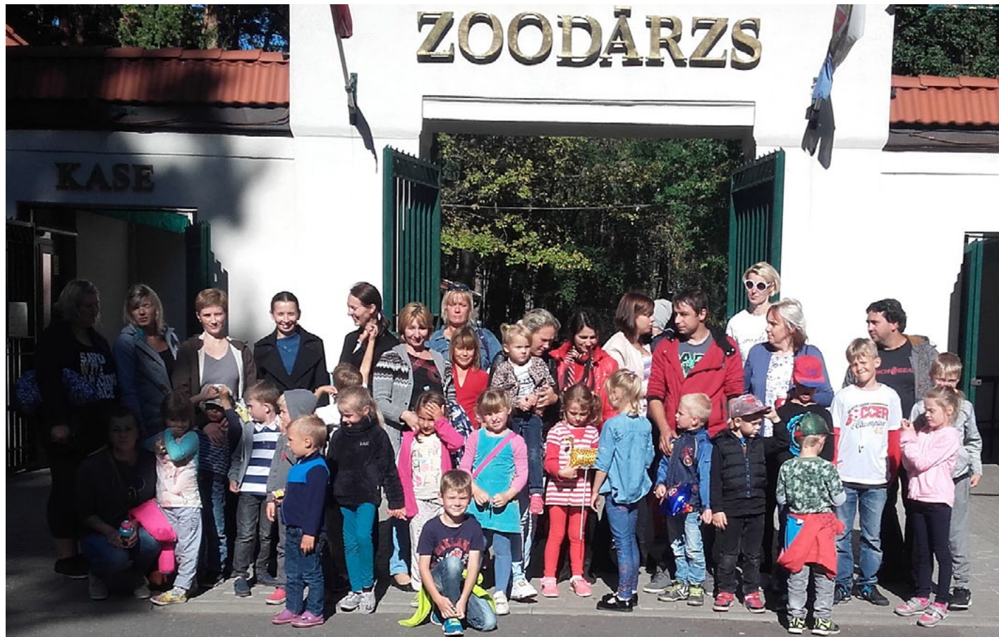
Ekskursija zooloģiskajā dārzā ļoti patika gan lielajiem, gan mazajiem svētciemiešiem

Piektdienas rīts mazajiem Snīpiem un Snīpišiem bija satraukumu pilns, jo viņi kopā ar vecākiem uz pirmsskolas izglītības iestādi devās neparastā veidā - ar riteņiem, kājām. Sapulcējušies pie strūklakas un saņēmuši balviņas, visi pēdoja un ripoja uz bērnudārzu. Paldies vecākiem, kuri bija padomājuši par bērnu drošību, lai varētu kopīgi droši aizriņot un aizpēdot līdz bērnu darba vietai! Šajā dienā pārsteigumiem nav ne gala, ne malas. Bērnu pie bērnudārza sagaidīja autobuss, lai kopīgi ar vecākiem un iestādes darbiniekiem dotos uz Rīgu, nacionālo zooloģisko dārzu.