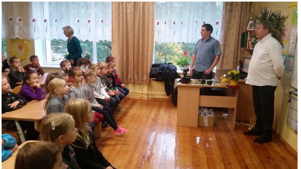
Teorētiskajās nodarbībās skolēni skatījās videomateriālu par gājēju un autovadītāju drošību uz ceļiem un redzēja atstarotāju efektivitātes demonstrēšanu