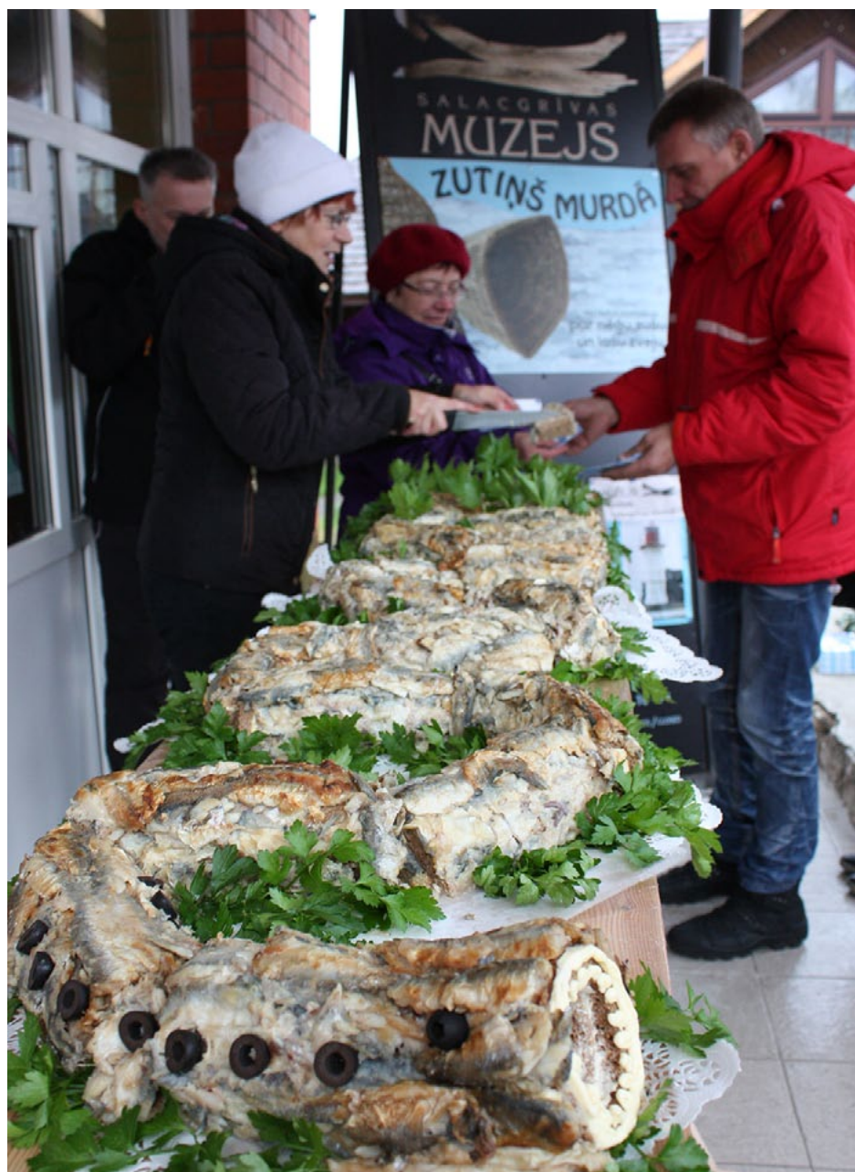
Salacgrīvā ir tapis garākais viltotais nēģis. Tā garums ir 4,08 metri!

Īss ieskats Nēģu svētkos - fotogrāfijās. Ilga Tiesnese