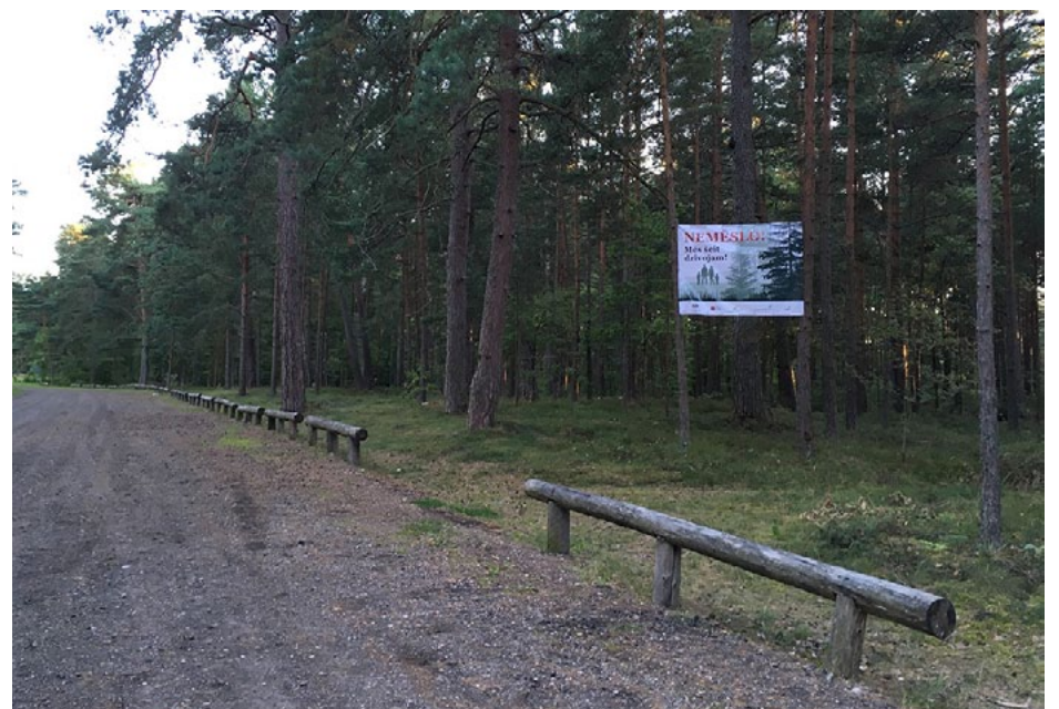
Plakāti ar aicinājumu nemēslojot mežā redzami Vitrupē un Ainažos

Jau ziņots, ka, gatavojoties Latvijas simtgadei, atkritumu apsaimniekošanas uzņēmums ZAAO uzsācis vides iniciatīvu 100 darbi Latvijai un aicina iedzīvotājus apvienot savas zināšanas, idejas, prasmīgās darbarokas un resursus, lai līdz 2018. gada 18. novembrim kopīgiem spēkiem paveiktu vismaz 100 nozīmīgu darbu vides labiekārtošanā, izdaiļošanā