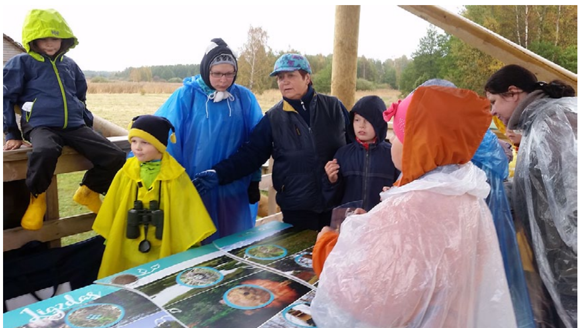
Ar lielu interesi bērni un pieaugušie vēroja apkārtni