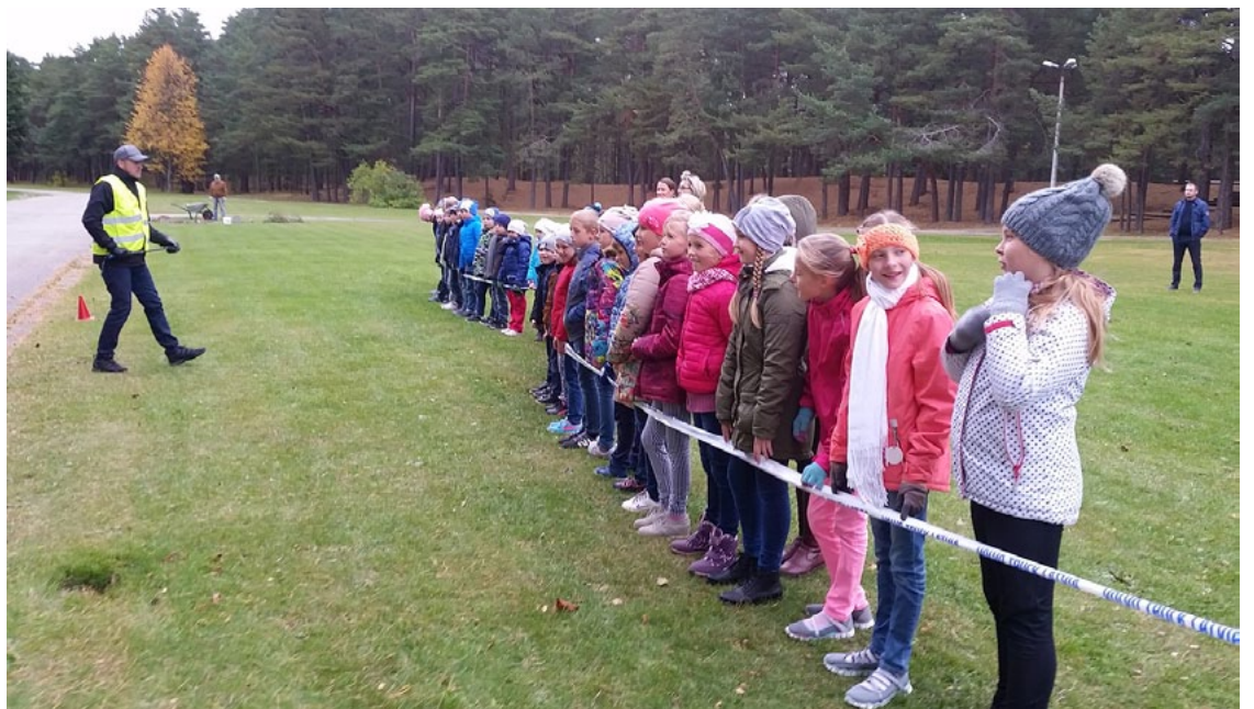
Visvairāk skolēni bija sajūsmināti par nodarbību ārā, kuras laikā kauca bremzes, dūmoja riepas un bija jūtama kūpošās gumijas smaka