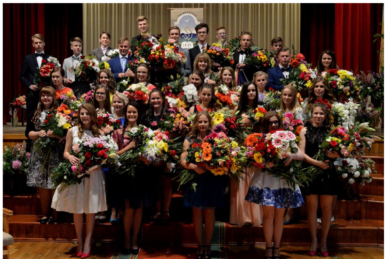
Izlaiduma valsi nodejojuši 9.a un 9.b klases audzēkņi

To jauniešiem arī novēlam turpmākajā dzīvē.