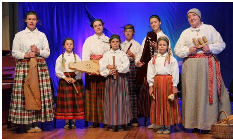
Zēģelīte akustiskās mūzikas festivālā Liepupē

Populārās mūzikas konkursu grupā bija sepiņi dalībnieki. Pirmie uzstājās grupa Voice of Instruments , tad Audiokvartāls , Skinny Cheese , Lorete Medne, Pa papa , The Citizens LV un Summer