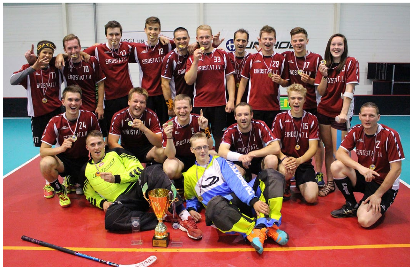
Liepupes florbola komanda ar Kocēnu turnīrā izcīnītām zelta medaļām

Kocēnu čempionātā, kurā Liepupe spēlēja B divīzijā, regulāro turnīru komanda pabeidza kā pirmie. Varbūt kļūdu izvērtējums Vidzemes un Limbažu čempionātos lika liepupiešiem pusfināla spēlēs cīnīties jau no spēles pirmās minūtes. Abās spēlēs svinējām uzvaras un nodrošinājām sev vietu finālā. 4. jūnijā komanda pilnā sastāvā devās uz Kocēniem, lai cīnītos par zeltu. Pretī liepupiešiem stājās spēcīga komanda IBK Griffin . Spēli labi sāka liepupieši, spēlētāji cīnījās par katru laukuma centimetru, kas, izskanot 1. perioda beigu svilpei, deva rezultātu 3:0. Bet pretinieki nedomāja padoties. Līdz spēles beigu signālam bija 38 sekundes, kad rezultātu tablo rādīja vairs tikai 3:2. Liepupiešiem noraidījums! Ļoti saspringtas sekundes, tomēr liepupieši spēja izturēt. Milzīgs prieks bija par līdzjutēju gavilēm, sagaidot spēles beigu signālu! Izcīnīts zelts!