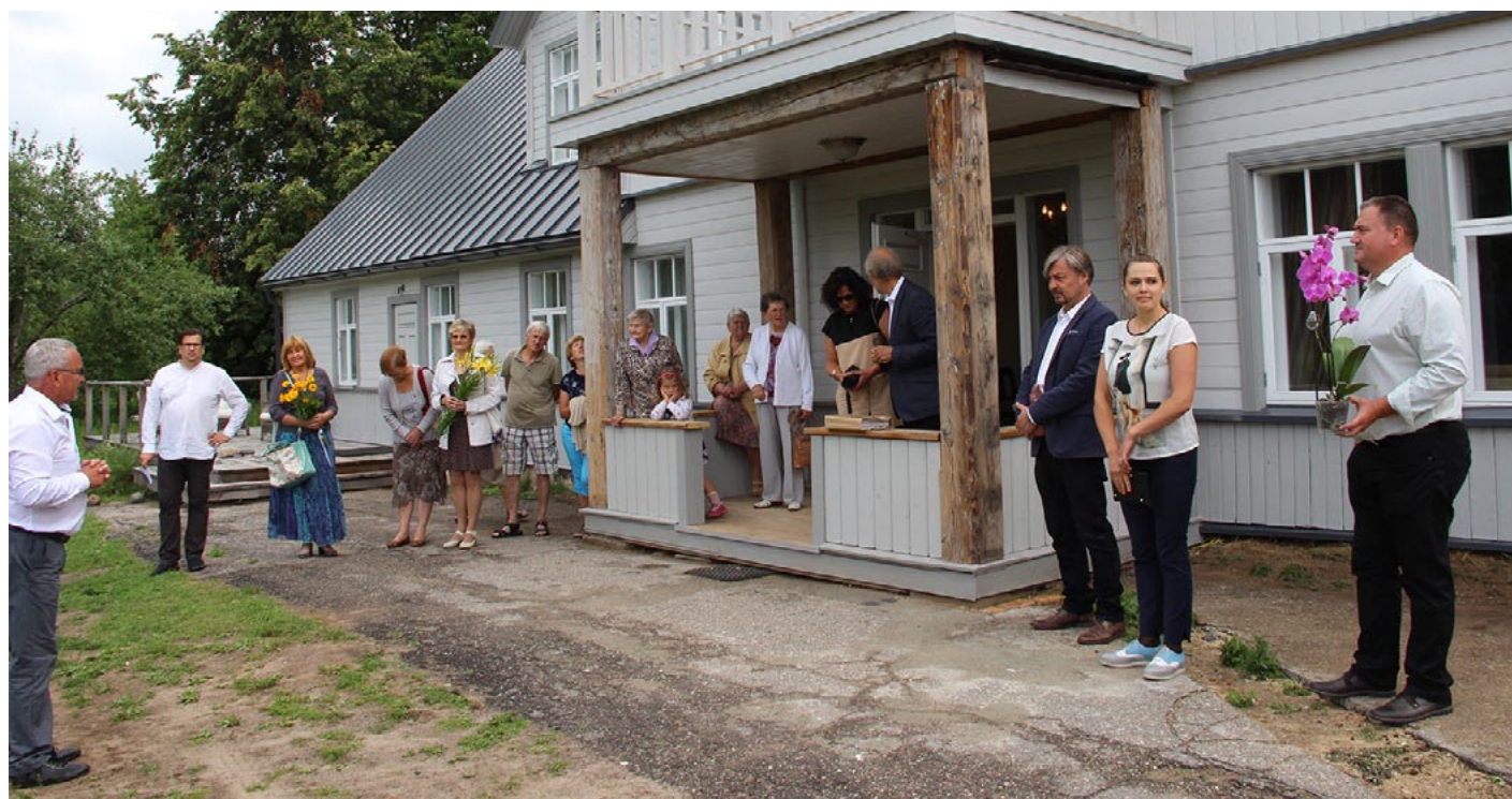
Tūlīt durvis vērs viesnīca Meke bijušajā Duntē skolā

1. jūlijā durvis vēra bijusī Duntē skola, kurā tagad varēs atpūsties ceļotāji un novada viesi. Pēc pusotra gada remontdarbiem bijušās Duntē skolas ēkā mājvietu sev radusi viesnīca Meke .