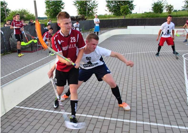
Florbola čempionāts Liepupē

Šajā vasarā Liepupē norisinās vēl nebijušas sacensības - florbola čempionāts 3:3. Dalību tajā ir sākušas 8 komandas: 4 no Liepupes, 3 no Salacgrīvas un 1 no Limbažiem. Komandas izspēlēs divu apļu turnīru katru ar katru, pēc tam sekos izslēgšanas spēļu turnīrs. Vienas spēles garums ir 2x12 minūtes. Sacensības norisinās pēc sabraukuma principa darbdienų vakaros.