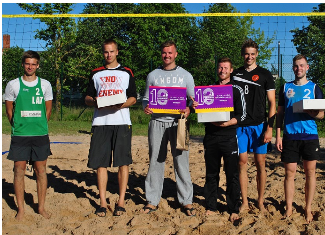
Pludmales volejbola čempionāta pirmā posma uzvarētāji