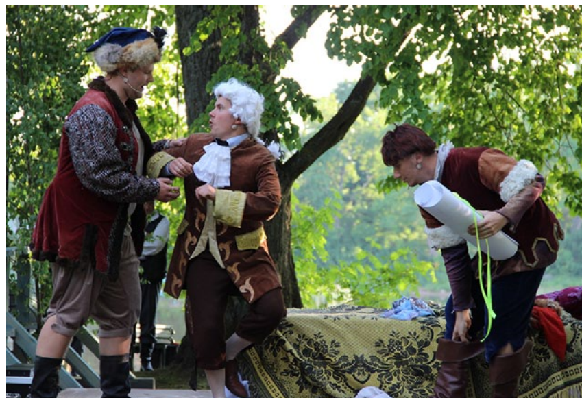
Baronam Heksenbergam klājas plāni, jo satikti paša zemnieki - piķieris Jānis un kalējs Mārtiņš