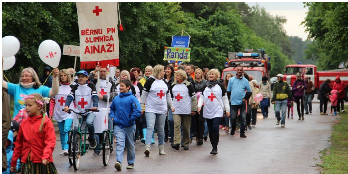
No veikala top! gājiens devās cauri Ainažiem vispirms pa Valdemāra ielu un tad pa Parka ielu uz estrādi pie skolas

Koncerta starplaikā biedrība Sprints A apbalvoja sporta sacensību uzvarētājus. Spītējot lielajam vējam un lietum, ļoti sīvajās sacensībās piedalījās četras komandas. Starp pirmajām trim vietām starpība ir tikai četri