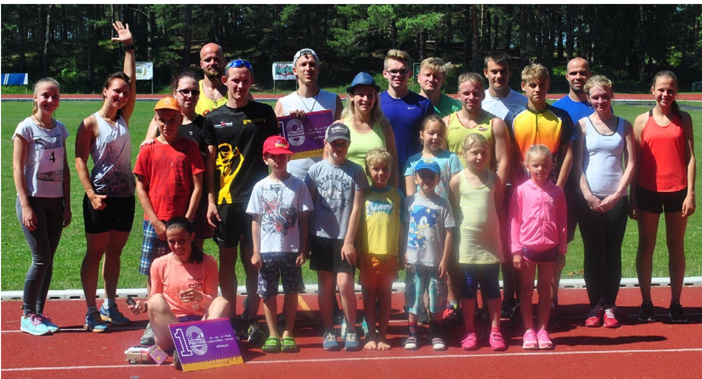
Skriešanas seriāla 1. posma dalībnieki un uzvarētāji saguruši, bet priecīgi

25. jūnijā Salacgrīvā norisinājās 1. skriešanas seriāla Salacgrīvas novads skrien posms. Trase izveidota gar jūras krastu, tāpēc sacensību dalībniekiem tā bija ļoti grūta, jo jūras smiltis visu sarežģīja, turklāt todien bija arī liels karstums - 32 grādi. Dalībnieku skaits nebija ļoti liels, visticamākais iemesls, kas atturēja cilvēkus skriet, bija tieši tas. 10 km distancē no Zvejnieku parka stadiona startēja 11 dalībnieku (6 vīrieši un 5 sievietes), 5 km distancē devās 4 dalībnieki (3 vīrieši un 1 sieviete). 1 km distancē pieteicās 6 dalībnieki (4 pui-