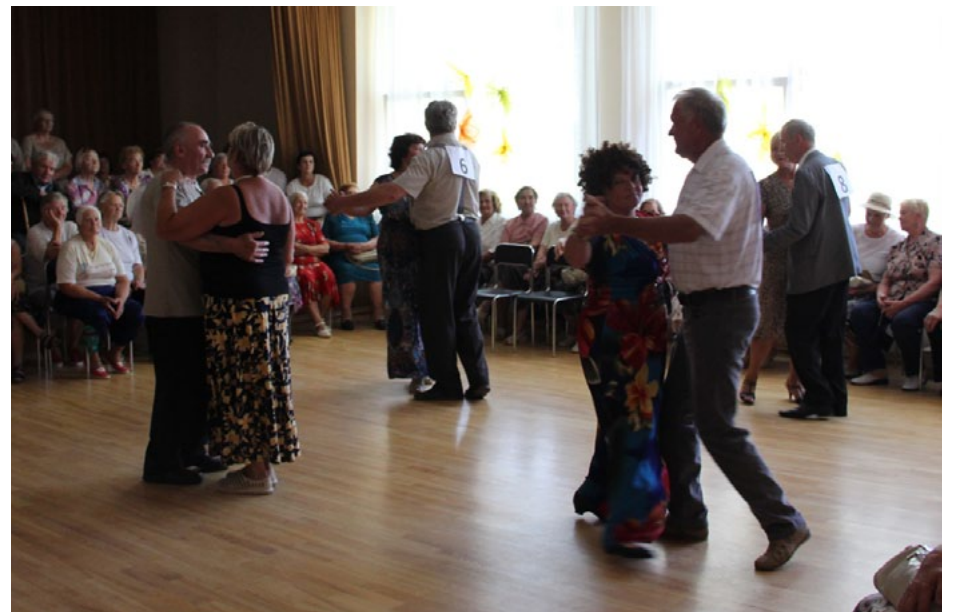
Valša sacensībās netrūka ne deļotāju, ne skatītāju!