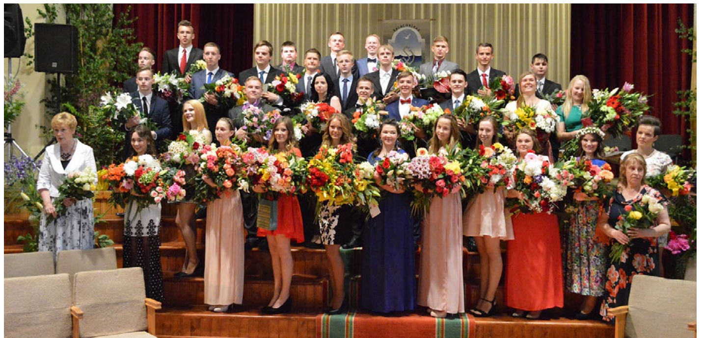
12.a un 12.b klasei ceļš lielajai dzīvei nu ir vajā