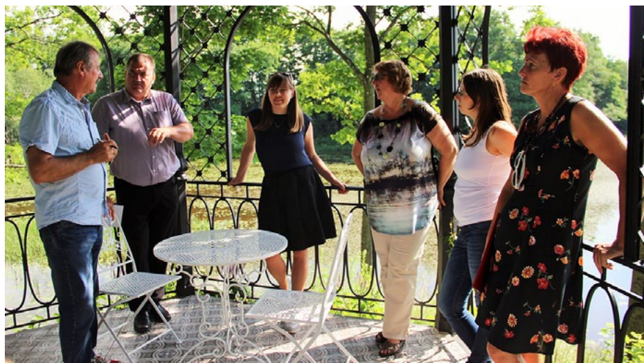
Vērtēšanas komisija pēdējā apskates objektā - Liepupes muižā, šoreiz uz mirkli piestājot parka lapenē