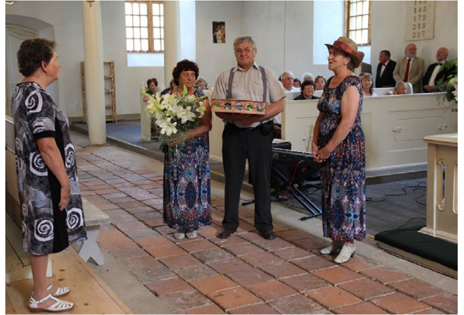
Ainažnieki atbraukuši uz novada senioru svētkiem ar labiem vārdiem un gardu klišēri