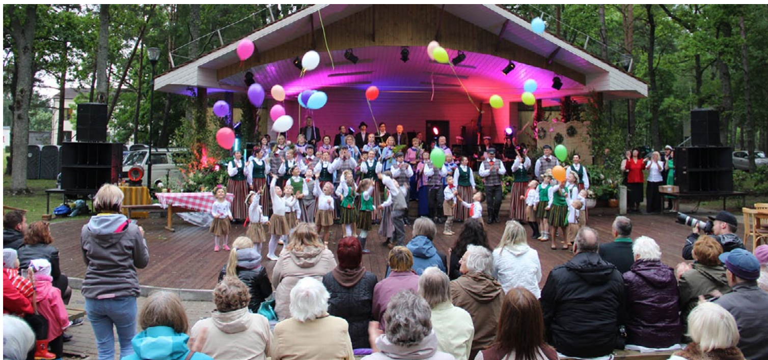
Svētku krāšņais uzvedums noslēdzās ar bērnu dejām un gaisā palaistiem baloniem - daudz laimes Ainažiem 90 gadu jubilejā!