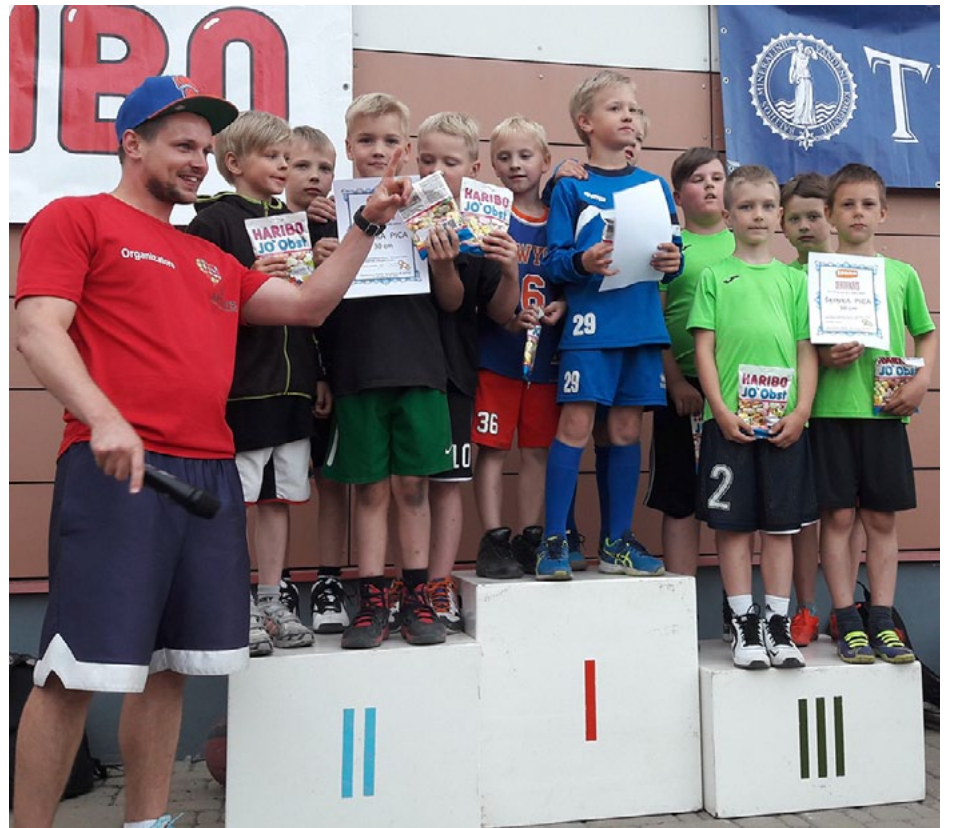
Mazajiem salacgrīviešiem 3. vieta! Apsveicam!

7. jūnijā Ķekavā notika Ķekavas novada atklātās sacensības 3x3 ielu basketbolā. Sacensības notiek četros posmos. Pirmajā posmā A (2007. g.dz. un jaunāki) un B (2005. g.dz. un jaunāki) grupā piedalījās arī Salacgrīvas mazie basketbolisti.