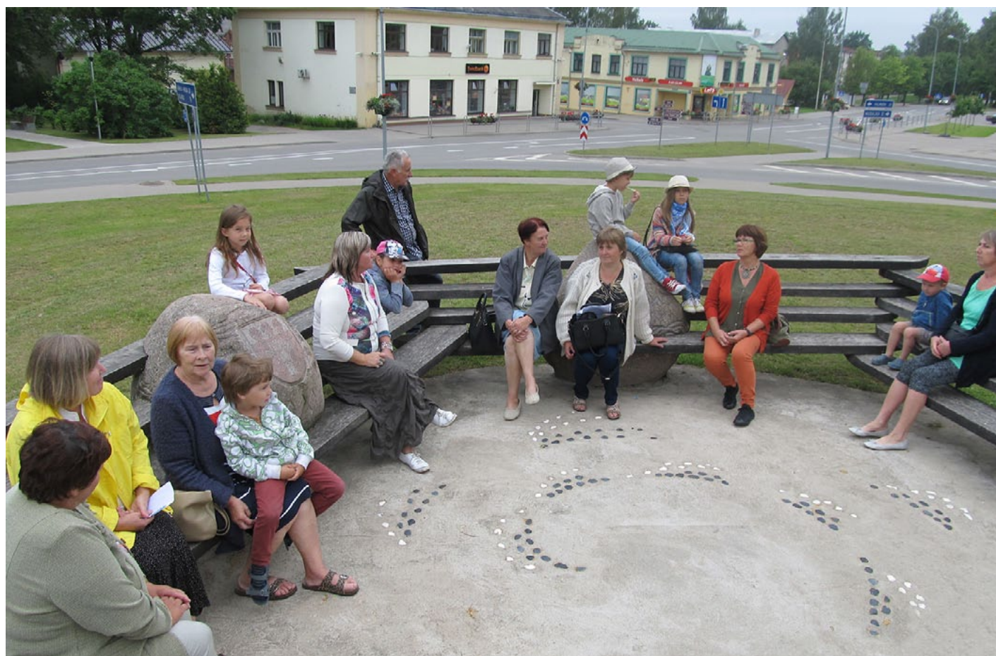
Neliels atpūtas brīdis Rūjienas iepazīšanas laikā

Pēc lielās saldējuma ēšanas prasīties prasījās izkustēties. Devāmies uz saimniecību Līgotnes . Bērniem tā bija izskriešanās, izšūpošanās, šinšillu samīlošana un