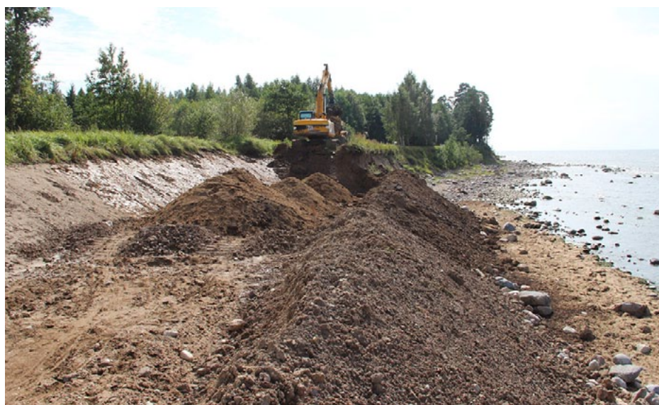
Uz ceļa Lielurgas - Oltūži notiek pamatīgi darbi

berot virsū ceļa segumu. - Šo ceļu citā vietā izpostīja arī 2005. gada vētra, tas atjaunots tāpat, kā šobrīd paredzēts. Kādu