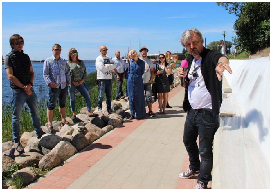
Slavas aleja Salacgrīvas promenādē nu ir atklāta

16. jūlijā Salacgrīvas promenādē atklāja Slavas aleju, kurā apskatāmi un savai rokai piemērojami pieci Salacgrīvu apmeklētāju ievērojamo cilvēku roku nospiedumi.