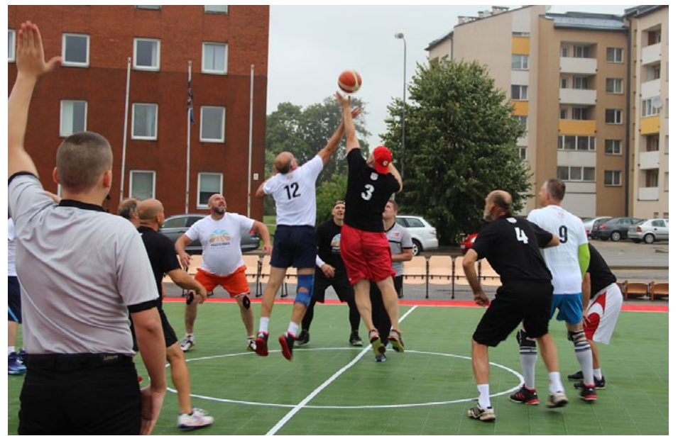
Nekādi laikapstākļi nespēja sabojāt spēles - īpaši karsts bija abu krastu leģendu mačs

Krastu maču atklāšanas brīdī uz Salacas tilta piedalījās basketbola pamatlicē-