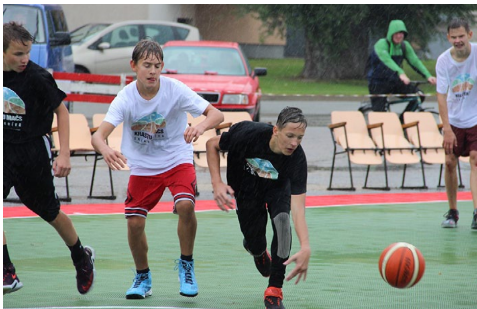
Krastu mačā uz laukuma pirmie izgāja un uz savas ādas brāzmaino vēju un lietu izbaudīja U-16 jaunieši