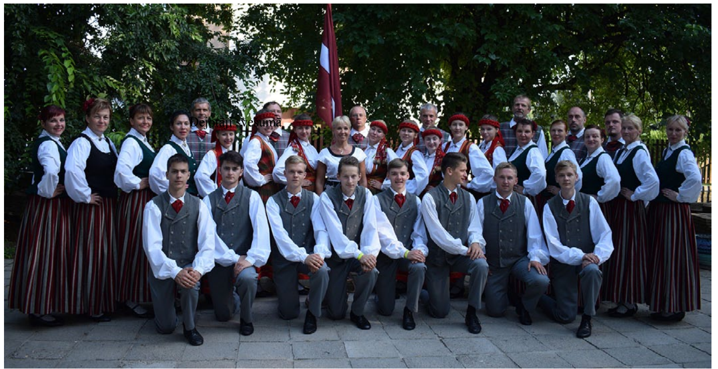
Novada dejotāji Ungārijā godam pārstāvēja mūsu valsti un pašvaldību

Piektiena, 5. augusts, bija mūsu brīvdiena, ko izmantojām pēc saviem ieskatiem un devāmies uz Szegedu - trešo lielāko pilsētu Ungārijā. Braucām ar kuģi pa