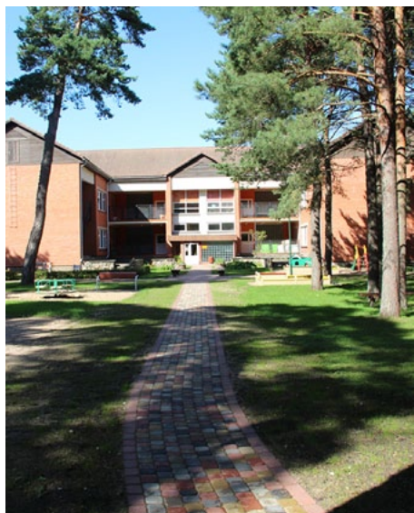
Mūzikas un mākslas skolas un Vilniša apkārtnē no glīti, krāsaini un priecīgi bruģēti

Nupat noslēgusies gājēju celiņu atjaunošana Salacgrīvas novada mūzikas skolas, Salacgrīvas mākslas skolas un pirmsskolas izglītības iestādes Vilniša teritorijā. Ir noņemtas nekvalitatīvās betona plāksnes un to vietā ierīkoti bruģēti celiņi.