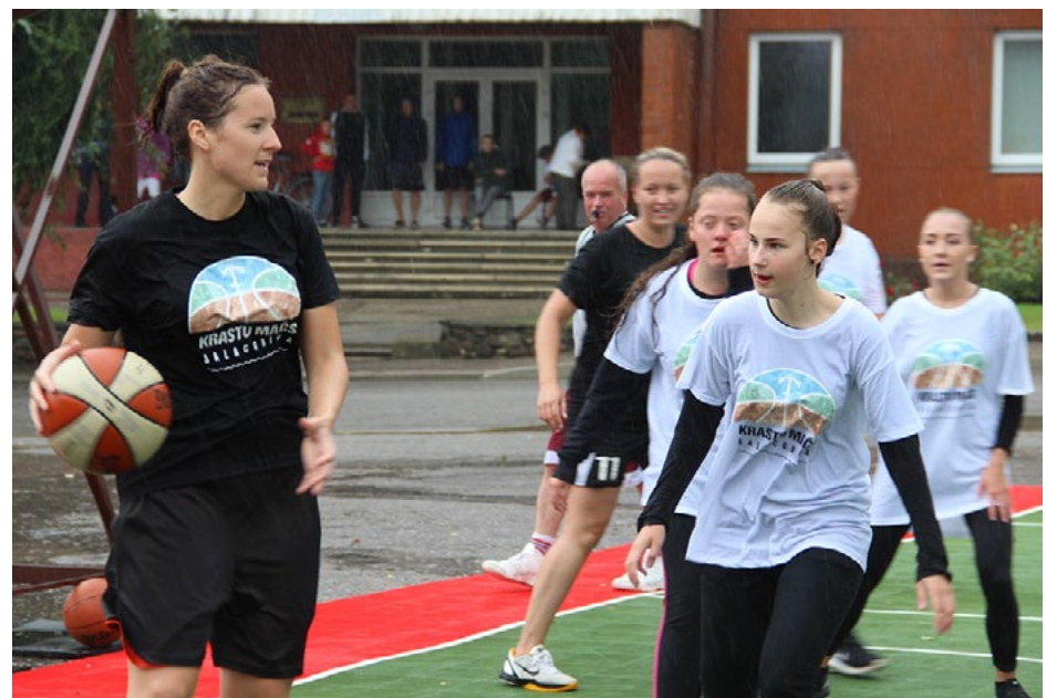
Droši var teikt - kreisā krasta uzvaru tā kārtīgi nostiprināja abu krastu sieviešu spēle