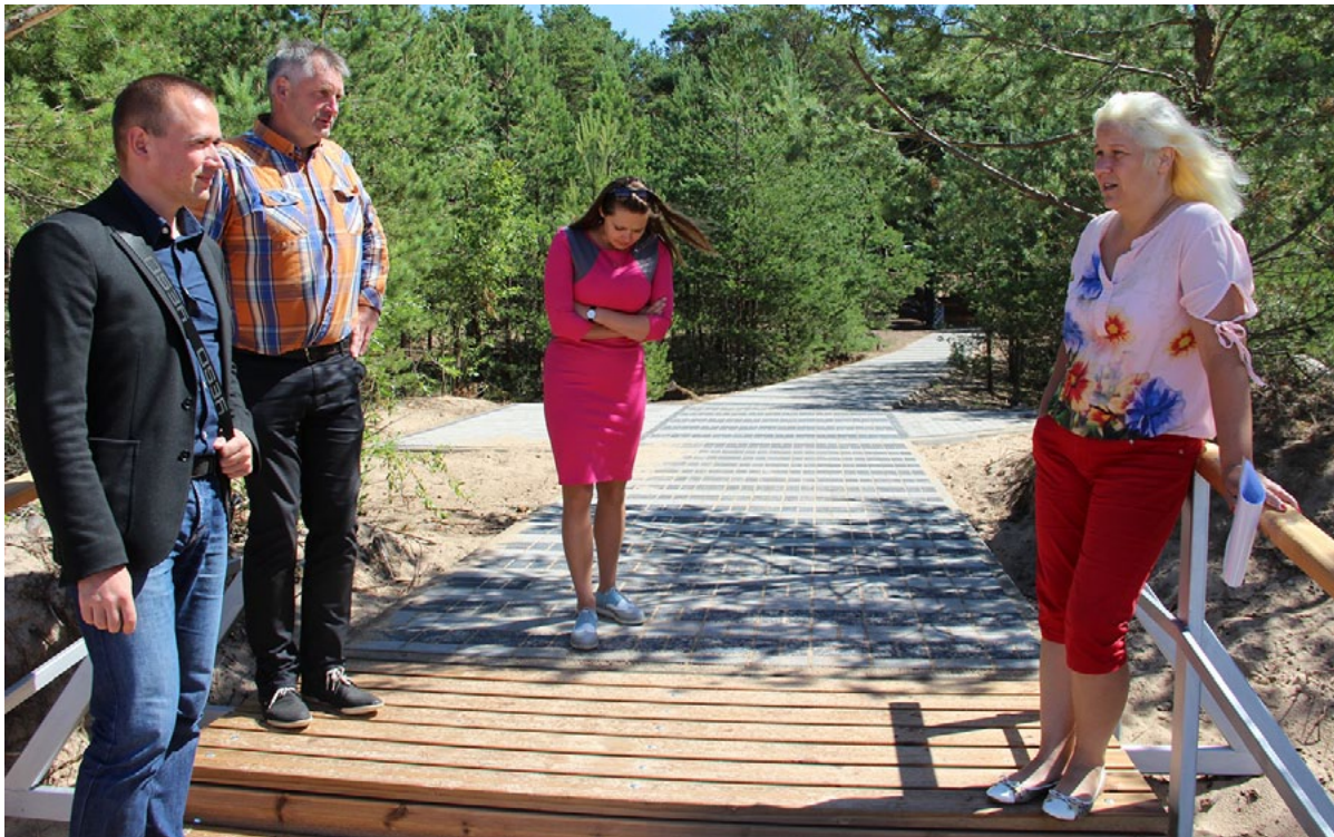
Esam tikuši pie jaunām laipām - noejām Salacgrīvā pie Zvejnieku parka un...

Ainažos un Salacgrīvā ekspluatācijā pieņemtas atjaunotās noejas uz jūru.