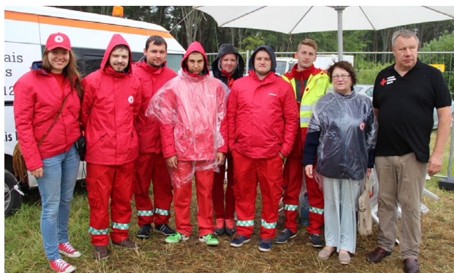
Latvijas un Igaunijas Sarkanā Krusta apvienotā komanda Positivus festivālā