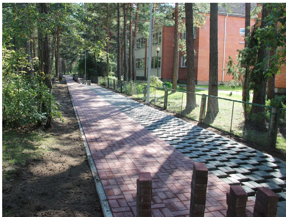
Ceļš uz Salacgrīvas vidusskolu tagad būs bruģēts, ar joslu velobraucējiem