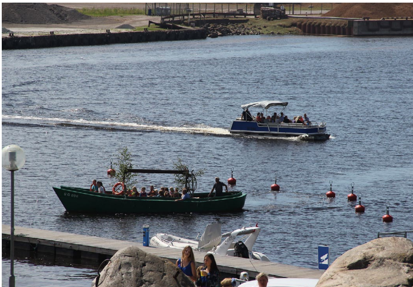
Lai arī šogad izpalika vizināšanās jūrā ar zvejas kuģiem, jūras alku pilnie izvizinājās ar zvejas laivām