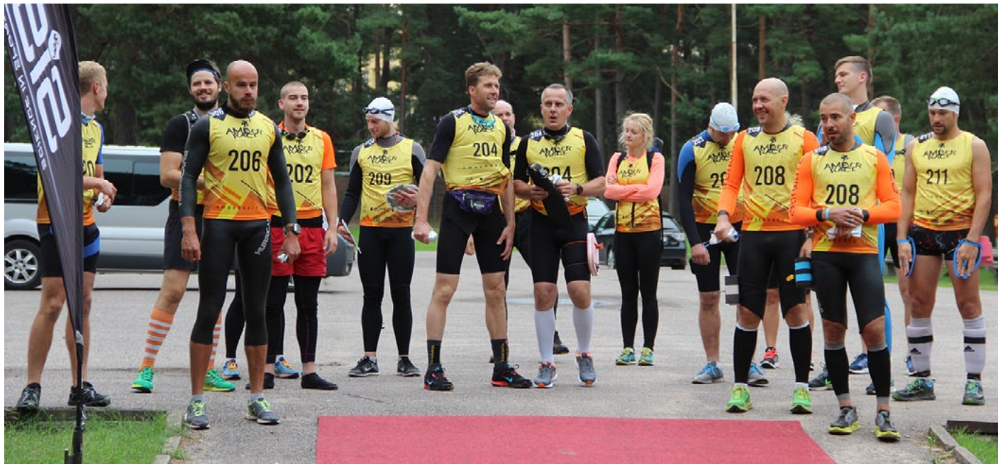
Tautas klases skrējēji startā - vēl sausi un smaidīgi

13. augustā Salacgrīvā pirmoreiz Latvijā norisinājās swim&run sacensības Amber race . Kas tad īsti bija jādara šajās sacensībās? Viss ir vienkārši, jāizpilda divas lietas - jāskrien un jāpeld. Sacensības noritēja sporta un tautas klasē. Sporta klasē kopā bija jāveic 33 km (28 km skrējiens un 5 km peldējums) tautas klasē - 18 km (15 km skrējiens un 3 km peldēšana). Sacensības aprūtināja sliktie laikapstākļi (vējš un lietus).