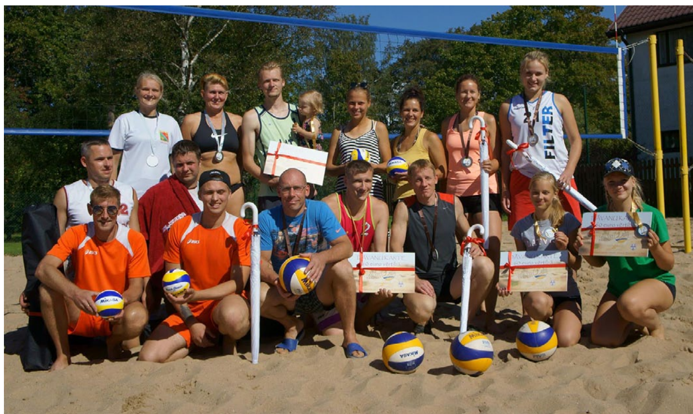
Pludmales turnīra Smiltis pa gaisu uzvarētāji