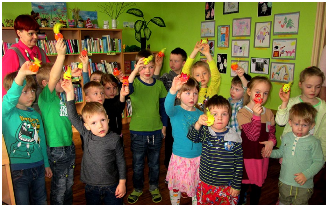
Apalģie Oliņi Boliņi, smalkās Džimpiņas Rimpīņas, nebēdnīgie Vējiņi Kājiņi un svarīgie Bumi. Jā, jā, nekādas smukās Lieldienu oliņas, bet Bumi ir tie, kas bērniem kabatiņās bija!