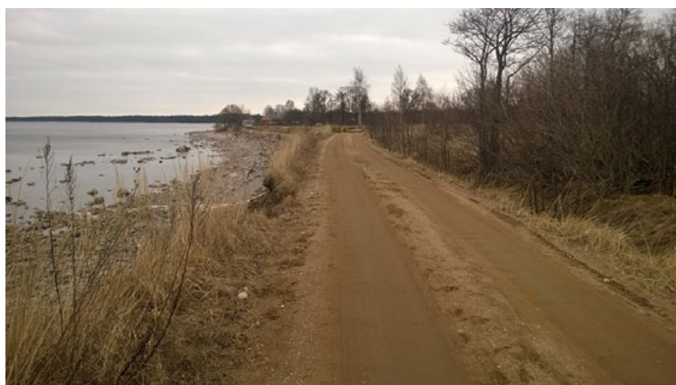
Šis posms automašīnām ir slēgts!

No 31. marta auto kustībai slēgts Meleku ceļš gar jūru posmā Lielurgas - Oltūži. Šajos apmēram 200 metros gar jūru izveidojušies bīstami izskalojumi, ceļš var nobrukt. Ceļa posmā ir uzstādītas zīmes Lebraukt aizliegts . Tuvākajā laikā pie nobrauktuves no Via Baltica un pie atpūtas vietas Veczemju klintis tiks uzstādītas zīmes Strupceļš .