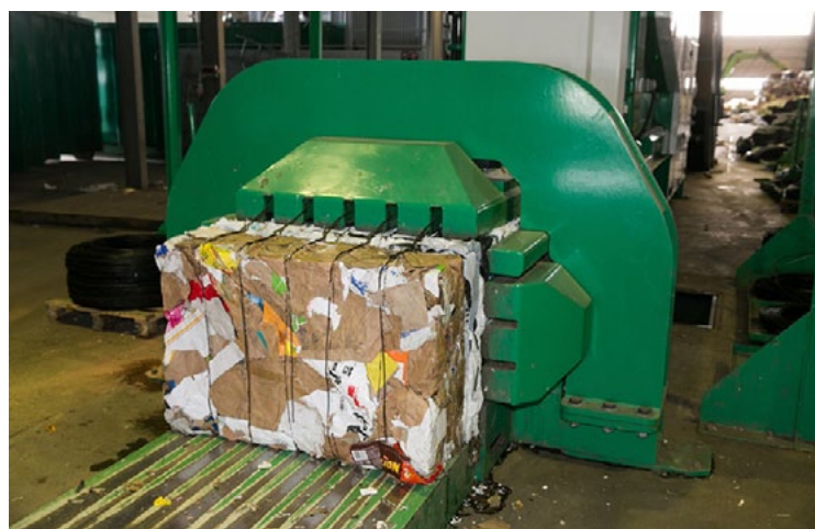
Projektā uzstādīta jauna šķiroto atkritumu ķīpu prese

Pašvaldību atkritumu apsaimniekošanas uzņēmums SIA ZAAO reģionālajā atkritumu apsaimniekošanas centrā Daibe īstenojis infrastruktūras modernizācijas projektu, kura