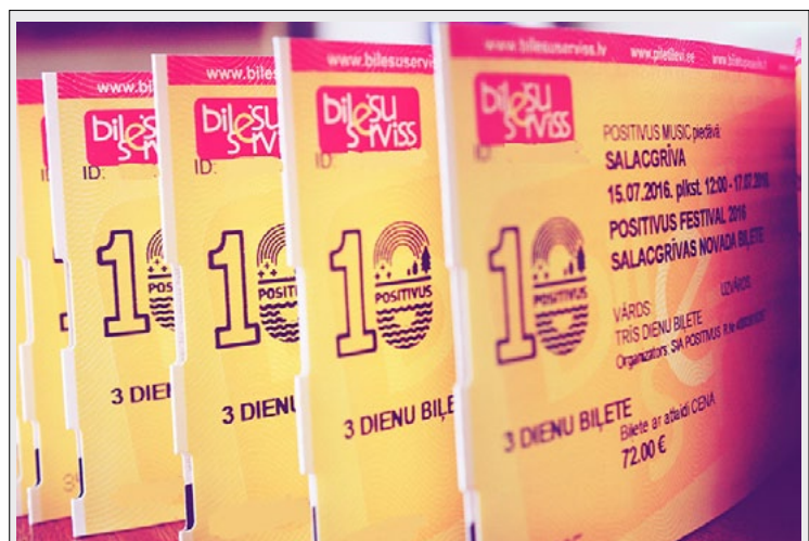
Novadā deklarētie iedzīvotāji var iegādāties lētākas biļetes uz festivālu Positivus

Lūdzu, dodiet ziņu par vēlmi iesaistīties un ziedot savus augus Salacgrīvas novada ainavu arhitektei Līgai Apsītei, liga.apsite@salacgriva.lv , t. 27336698. Gaidīsim!