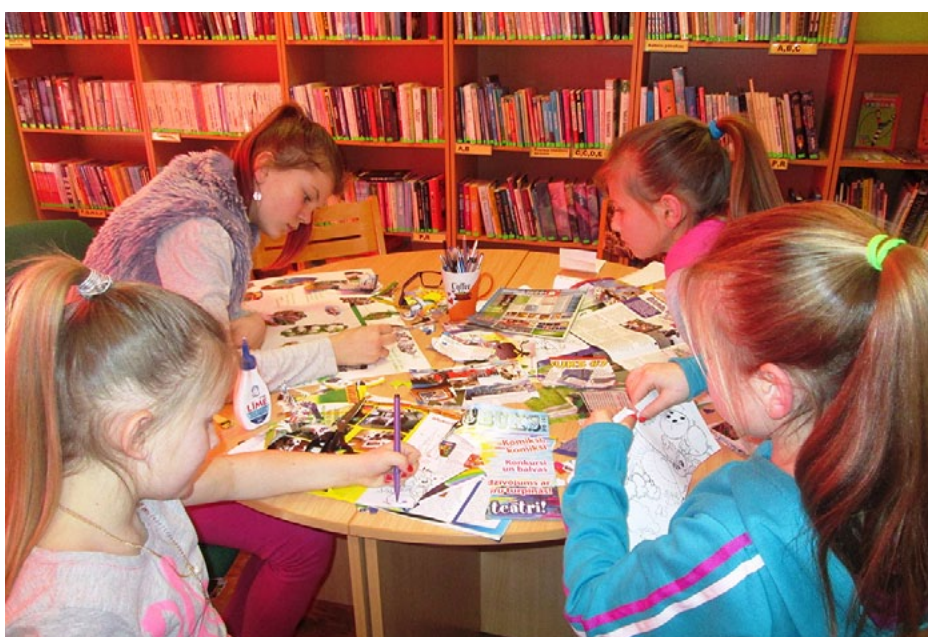
Svētciema mazie lasītāji ar lielu aizrautību veidoja reklāmas kolāžas