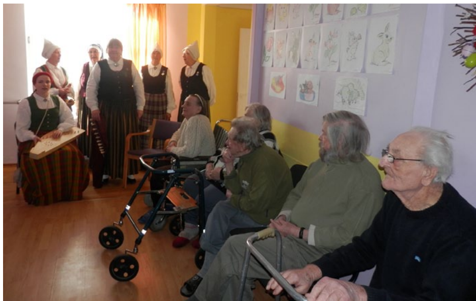
Lieldienās Sprīdīšos ciemojās folkloras kopa Cielava