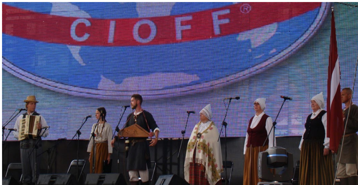
Noslēguma koncerts Zakatekas uz lielās skatuves

šies ielas abās pusēs un uzgavilēja gājiena dalībniekiem ar tādu prieku un sajūsmu, ka aizmirsās, ka ārā ir +40 grādi un mums mugurā ir tautastērps pilnā komplektā.