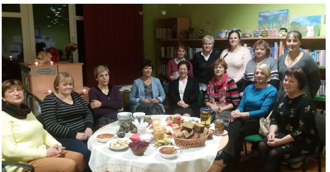
Pievakares sarunas Svētcieņa bibliotēkā noteikti turpināsies, aicinām pievienoties!

Turpmākās sarunas raisījās, baudot līdzpaņemtos burciņus kārums. Viss pašu gatavotais