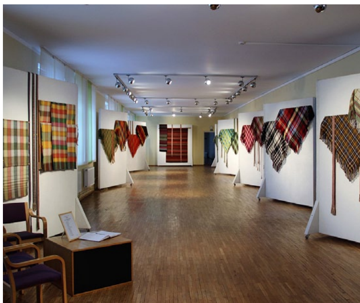
Košos TLMS Valmiera darbus var arī iegādāties

Salacgrīvas kultūras namā līdz 3. decembrim skatāma Tautas liecības mākslas studijas (TLMS) Valmiera dalībnieču darbu izstāde Izkrāsosim rudeni .