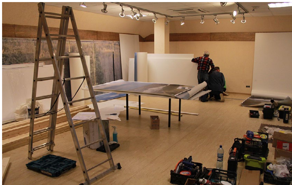
Gan lielos, gan mazos izstādes Lasis godā celts! apmeklētājus gaidīsim jau decembrī

DAP DIC «Ziemeļvidzeme» vides izglītības speciāliste