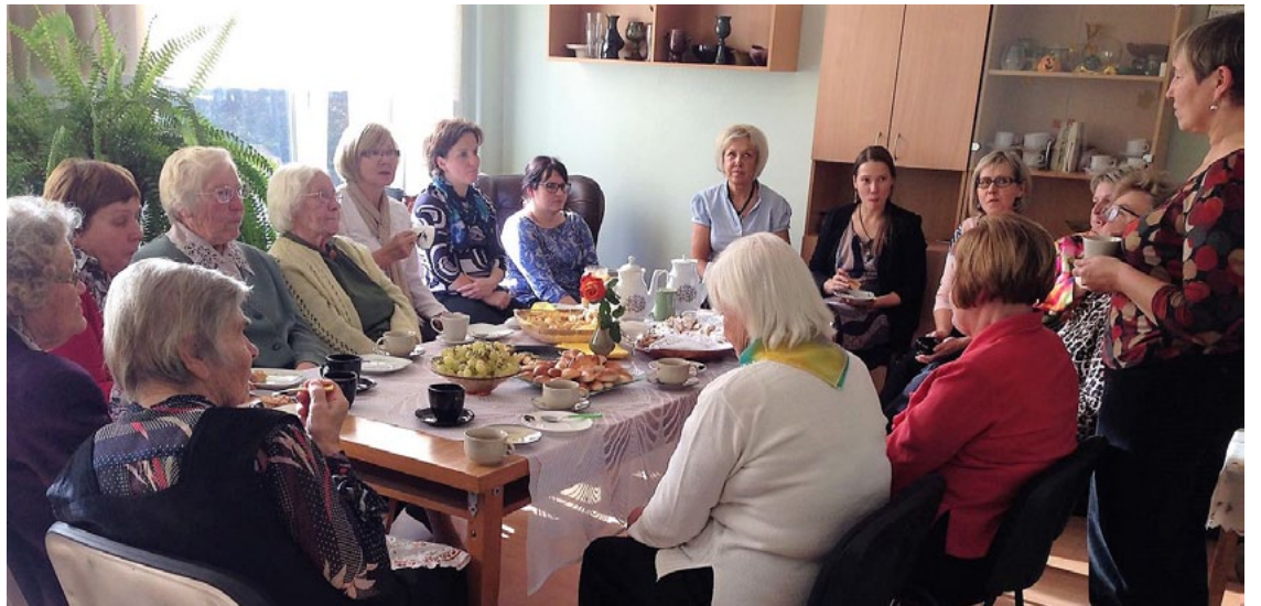
Pie tējas tases skolotājas risināja sirsniņas sarunas

Mani visskaistākie gadi ir pagājuši Salacgrīvas vidusskolā. Grūti izstāstīt, cik daudz siltu atmiņu ir par pieciem gadiem, kad mācījies Salacgrīvas vidusskolā, un par 43, kurus nostrādāju Salacgrīvas vidusskolā kā sākumskolas skolotāja!