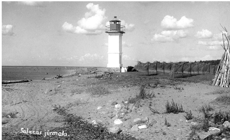
Bāka 1930. gados. Blakus uz vabām zūst zvejas tīkli