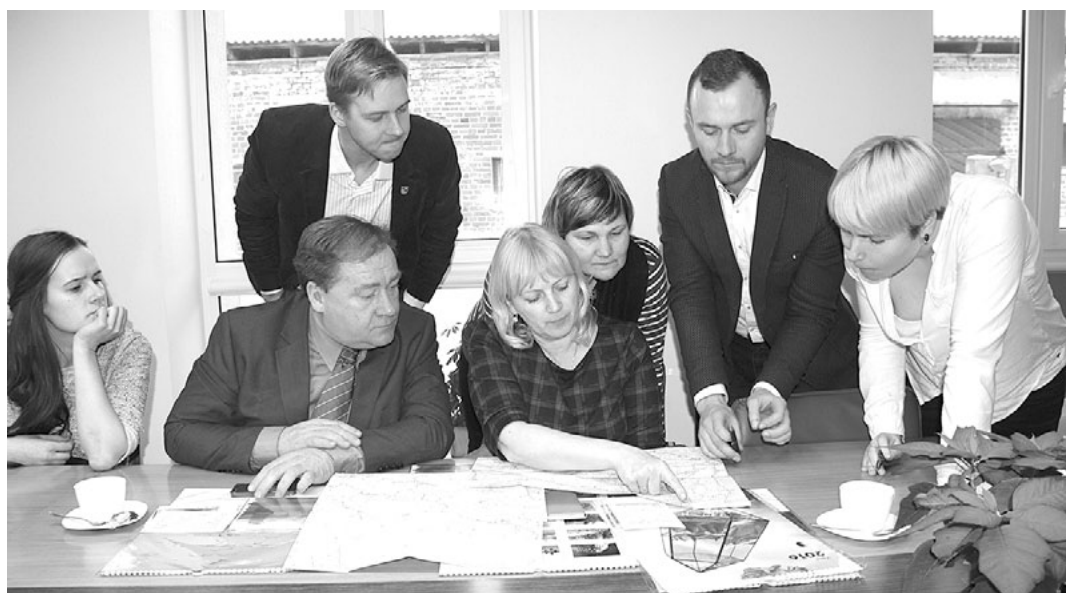
Mazsalacas, Alojās, Rūjienas un Salacgrīvas pašvaldības pārstāvji iepazīstas ar takas iespējamo novietojumu

Ar zīmuli taka un ceļš gar Latvijas robežu ir iezīmēts. Projekta laikā katru gadu notiks 20 koncertu, kopā 43, katrs citā pašvaldībā - tā projekta veidotāji būs bijuši visās pierobežas pašvaldībās. Koncerti notiks no maija līdz septembrim, viens no tiem - arī Salacgrīvas novadā.