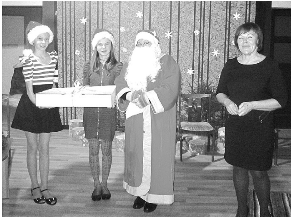
Svētciema bibliotēkas apmeklētājus Ziemassvētku rūķis sveica ar gardu kliņģeri