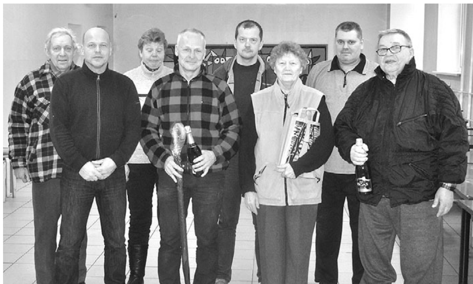
Novusa čempionāta 1. kārtas uzvarētāji un dalībnieki

16. janvārī Salacgrīvas vidusskolas telpās norisinājās novusa čempionāta pirmais posms. Tajā startēja 10 dalībnieku, kuri cīnījās par Salacgrīvas novada domes dāvētajām balvām. Sacensības bija spraigas un sivas, un līdz pat pēdējai kār-