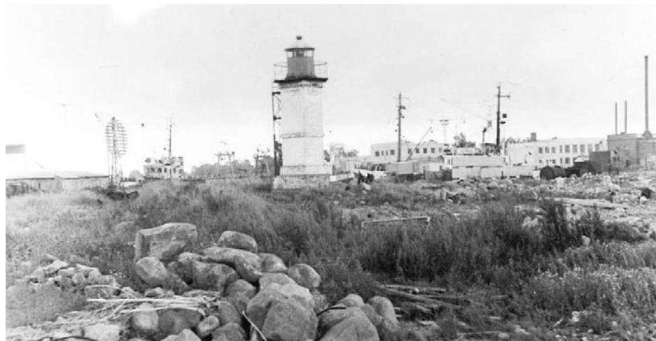
Bākas apkārtnē 1970. gados