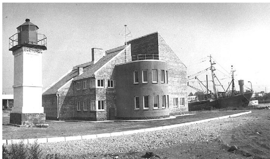
Salacgrīvas bāka blakus ostas mājai. 1980. gadi.