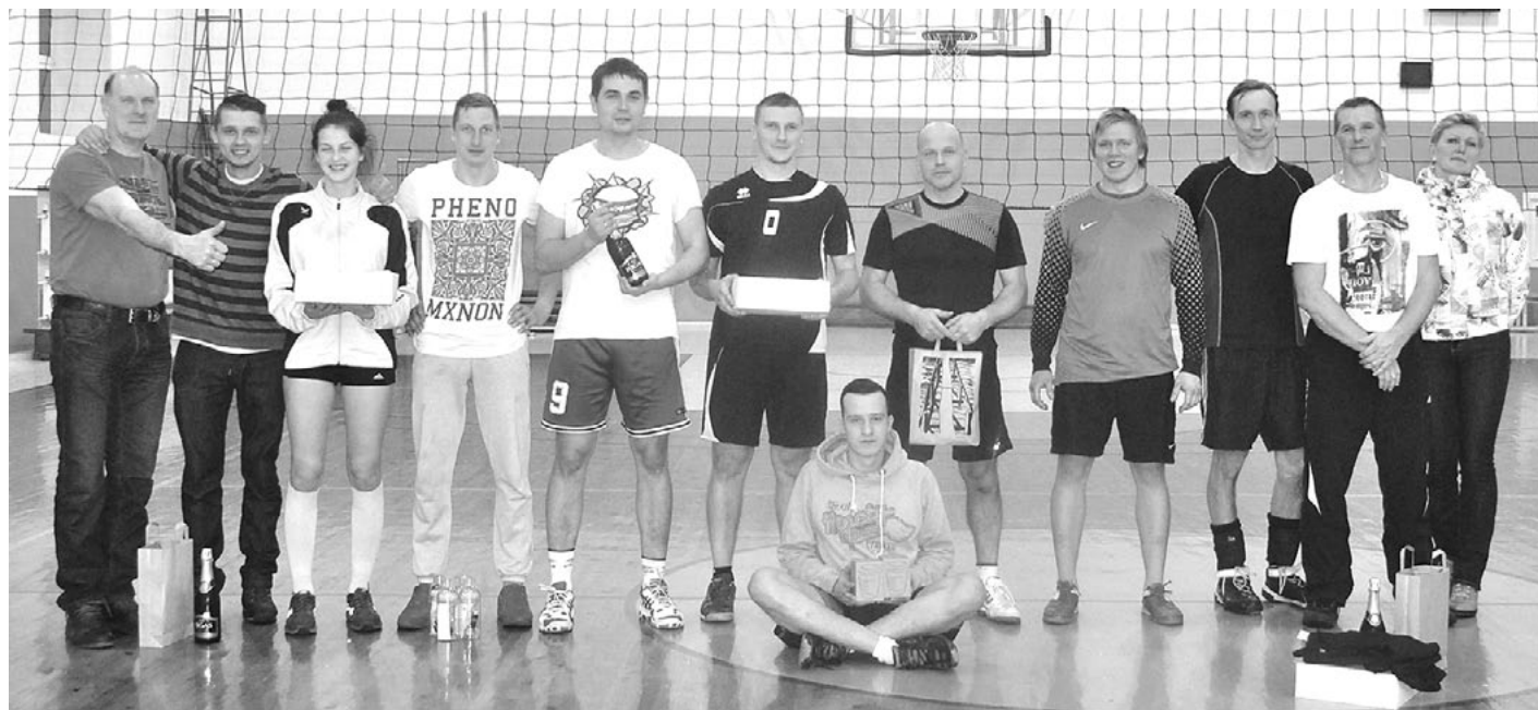
Nakts volejbola turnīra uzvarētāji