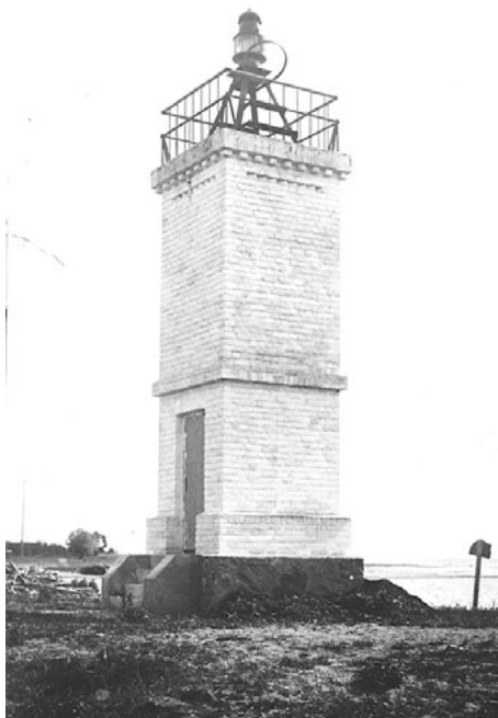
Salacgrīvas bāka savā sākotnējā izskatā. Celta 1925. gadā. Izslēgta 1970. gadā

Daudzo sēkļu dēļ visā Rīgas līča Vidzemes piekrastē bīstamākais apgabals kuģošanai ir piekraste starp Salacgrīvu un Ainašiem. Tādēļ 1925. gadā Jūrnieceības departamenta Hidrogrāfiskā daļa pieņēma lēmumu Salacgrīvā, ostas teritorijā un upes labajā krastā celt jaunu bāku. Jūrnieceības departamenta Hidrogrāfiskās daļas 1925. gada 24. septembra vēstulē finanšu ministram teikts: (...) Bīstamās vietas apzīmēšanai jūrā ir uzstādīta ugunsboja, kura jāizņem, jūrai aizsalstot, bet kuģošana tanī laikā vēl iespējama. Ir domāts celt Salacgrīvā jaunu bāku ar diviem uguns sektoriem - baltu un sarkanu. Pēdējais norobežo bīstamās vietas un atvieglo kuģošanu arī tanī laikā, kad boja izņemta. Turienes zvejniekiem bācai būtu liela nozīme, kuri naktīs laikā atgriežoties zinātu ceļu uz Salacgrīvu. Apgaismošanas aparāts jau iegādāts agrāk; jāceļ tikai bākas stāvs, kas izmaksātu apm. Ls 1500.