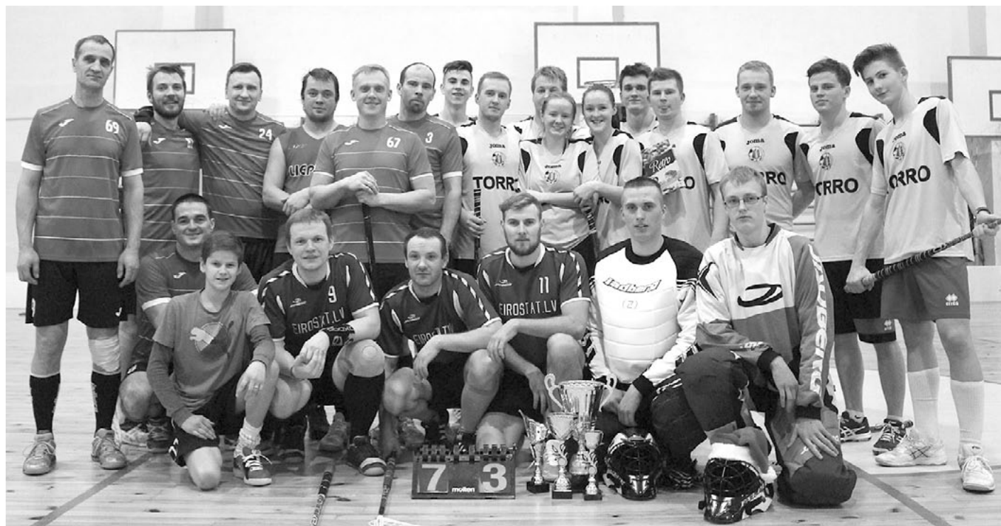
Vecgada florbola kausa sacensību uzvarētāji