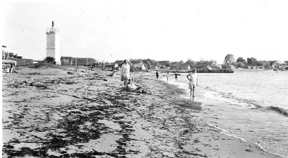
Jūrmalā pie bākas 1920. gadu beigās