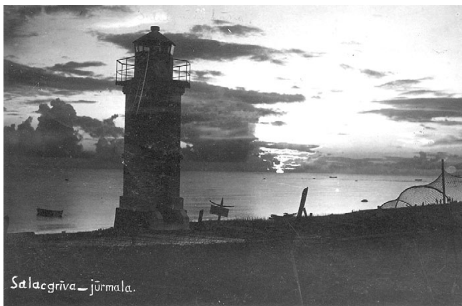
Pie bākas naktī. 1930. gadi.

skolas absolvents, 65 gadus vecais Fricis Zīlemanis.