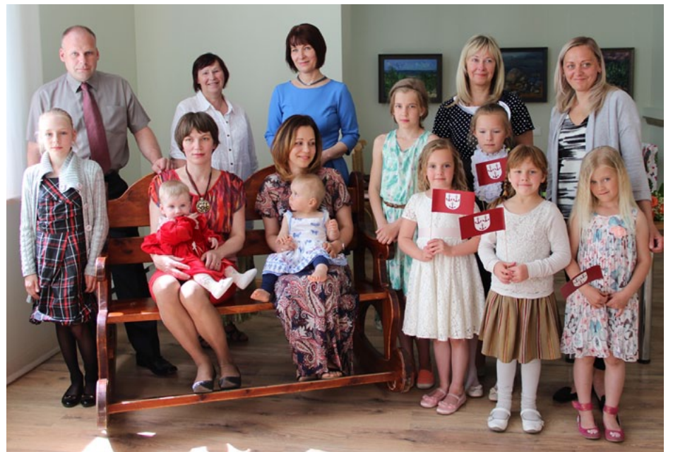
Mazie un lielie svētku dalībnieki Ainažos