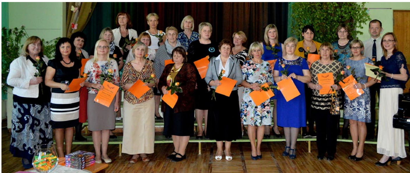
Paldies jums, skolotāji, par pacietību un laiku, ko veltījāt saviem skolēniem!