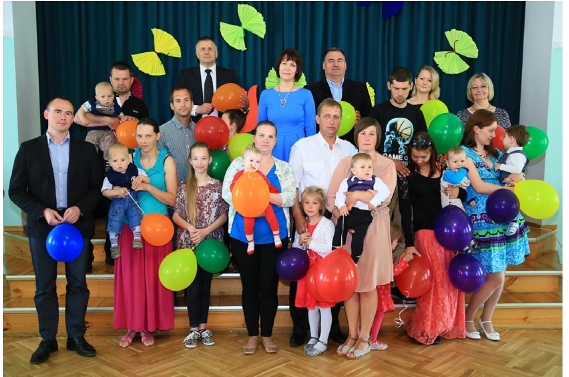
Liepupes mazuļu un viņu atbalstītāju kopilde