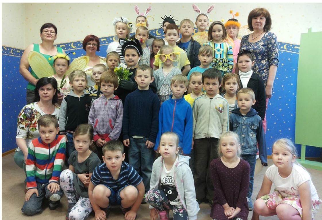
Krišjāņa Valdemāra Ainažu pamatskolas teātra pulciņa iestudēto ludiņu Kaķēna raizes bibliotēkā noskatījās bērnodārza Randa sagatavošanas grupas audzēkņi un audzinātājas