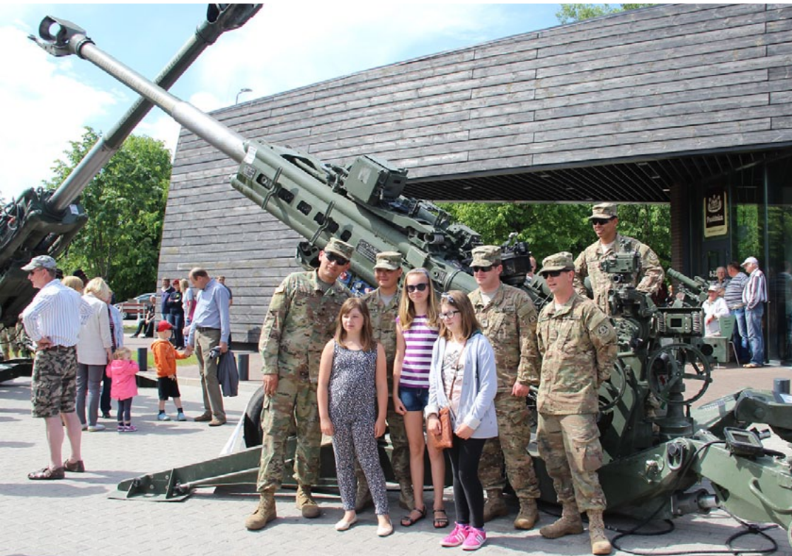
Iespēju nofotografēties kopā ar ASV karavīriem izmantoja daudzi salacgrīvieši

14. jūnijā Salacgrīvā, pie veikala top! piestāja ASV 2. kavalērijas pulka mācību marša Dragoon Ride II kājnieku kaujas mašīnas Stryker , militārās apvidus un smagās automašīnas, kas pēc tam turpināja ceļu uz Igauniju, lai piedalītos mācībās Saber Strike . Salacgrīviešiem bija iespēja apskatīt ASV, Vācijas un Latvijas militāro tehniku.