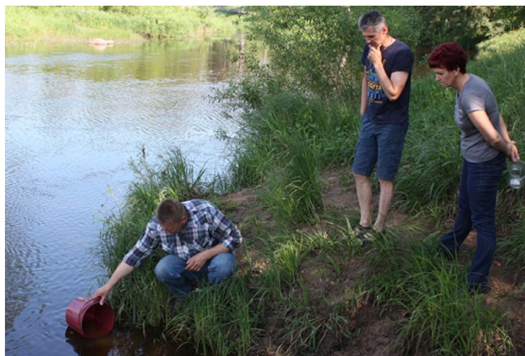
Nēgu kāpuri sāk savu ceļu lielajā dzīvē

Pēmruden uz Salacas tačiem zvejojošie nēgu zvejnieki par simbolisku samaksu Pārtikas drošības, dzīvnieku veselības un vides zinātniskajam institūtam BIOR nodeva 70 kg vaislas nēgu