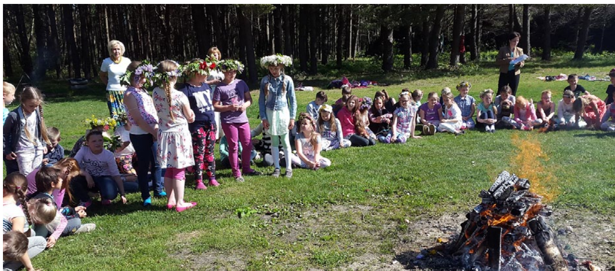
Mācību gada noslēgumā Salacgrīvas vidusskolas sākumskola kopā ar ūsiņu (pavasara beigas un vasaras sākums), Līgām un Jāņiem, kuri, protams, vēl priekšā, ieskandināja vasaru

Kā jau katrā mācību gada noslēgumā, arī šajā gadā Salacgrīvas vidusskolas sākumskola ieskandināja vasaru. To darījām kopā ar ūsiņu (pavasara beigas un vasaras sākums), Līgām un Jāņiem, kuri, protams, vēl priekšā. Taču tas netraucē skolas māzākajiem svinēt svētkus pēc tautas tradīcijām. Kūrām ugunsgrāvu, dziedājām uguniņ, apsveicām Līgas un Jāņus, dziedājām tautasdziesmas. Katra klase bija sagatavojusi mazu stāstījumu, tradicionālo ēdienu receptes, ticījumus, tautasdziesmas, mīklas par ūsiņa dienu un vasaras saulgriežiem. Kad mīklas bija atminētas, vajadzēja mazliet