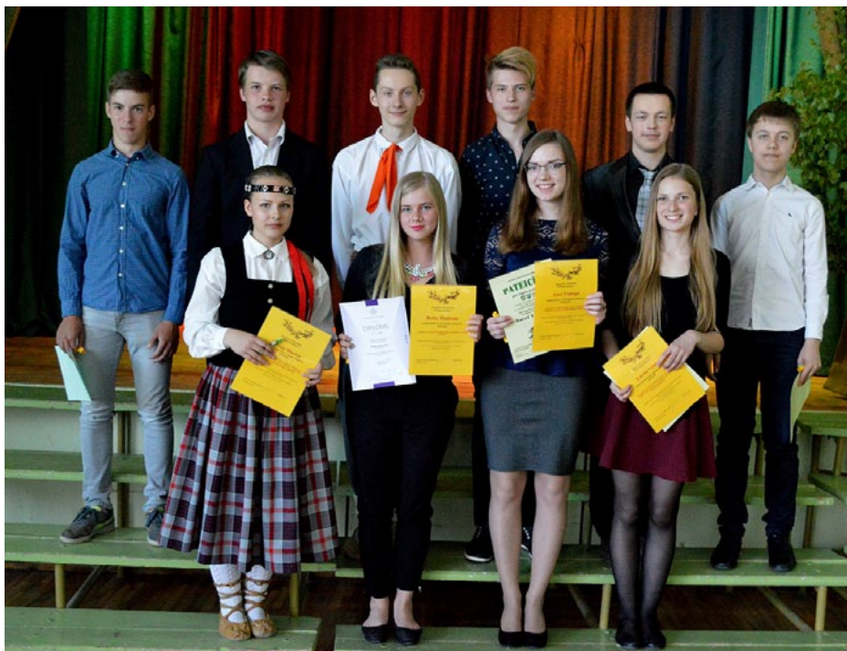
Šajā attēlā ir tikai daļa aktīvo, gudro, čaklo un sportisko Salacgrīvas vidusskolas audzēkņu...