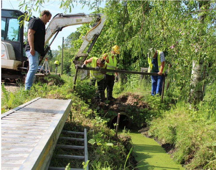
Notekgrāvju tīrīšana Salacgrīvā

SIA Salacgrīvas ūdens šobrīd aktīvi strādā, lai Salacgrīvā sakārtotu ūdenssaimniecību - konkrēti - kanalizācijas pieslēgumu sistēmu.