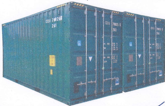
- Konteineru ārējais izskats.